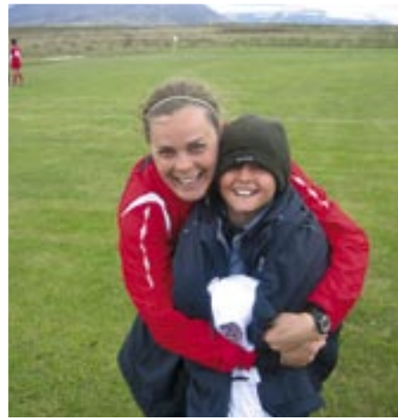
Starfsmaður mótsins og norskur leikmaður.