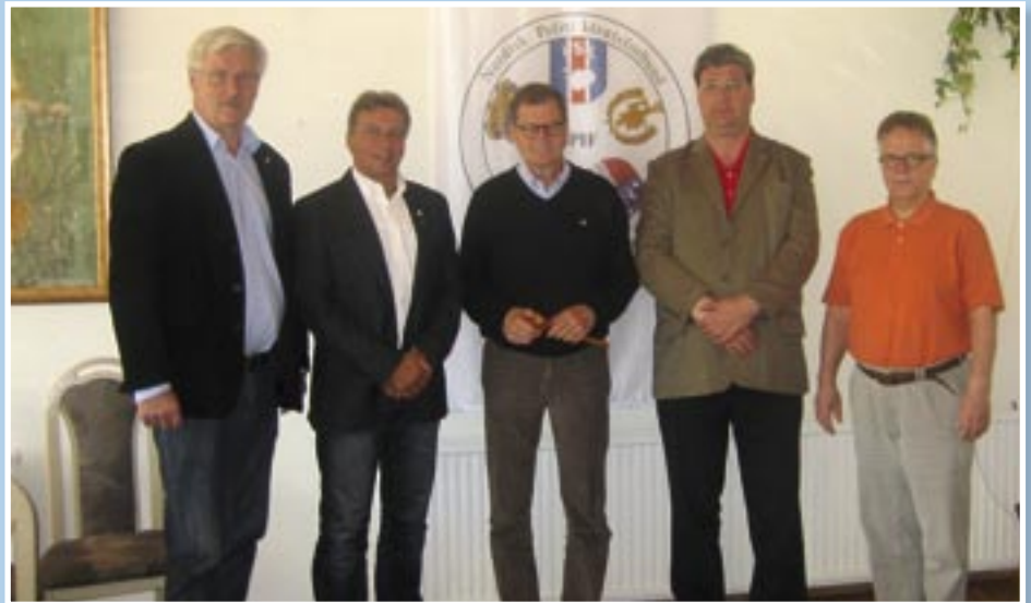
Stjórn NPIF 2011 - 2013.