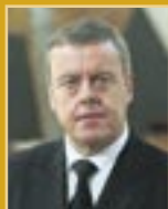
Þorsteinn Elísson útfararþjónusta