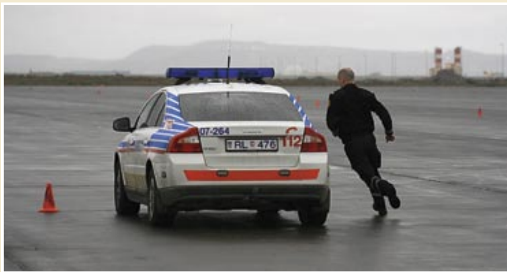
Tímataka í þrautabraut

um yfirmönnum í þetta verkefni og upphaflegar hugmyndir um þjálfun gengu út á að þeir myndu þjálfu samstarfsmenn sína, hver í sínum landshluta, sem sérstakir trúnaðarmenn LSR. Fljótlega var ákveðið að þiggja boð Norðmanna um að hópurinn kæmi til viðbótarþjálfunar í Noregi til að tileinka sér öryggi við forgangsakstur í vetraraðstæðum og fór hópurinn til Noregs í febrúar 2009 og var þar í þjálfun í eina viku.