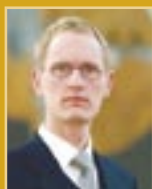
Frímenn Andrússon útfararþjónusta