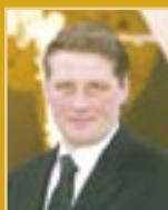
Svafar Magnússon útfararþjónusta