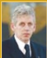
Guðmundur Baldvinsson útfararþjónusta