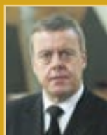
Þorsteinn Elísson útfararþjónusta