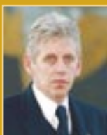
Guðmundur Baldvinsson útfararþjónusta