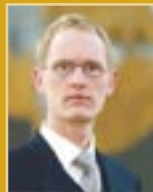
Frímánn Andrésson útfararþjónusta