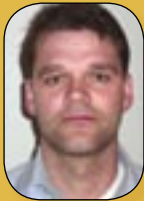
Ritstjóri: Steinar Adólfsson

1. tölublað - 25. árgangur 2009 - 65. blað