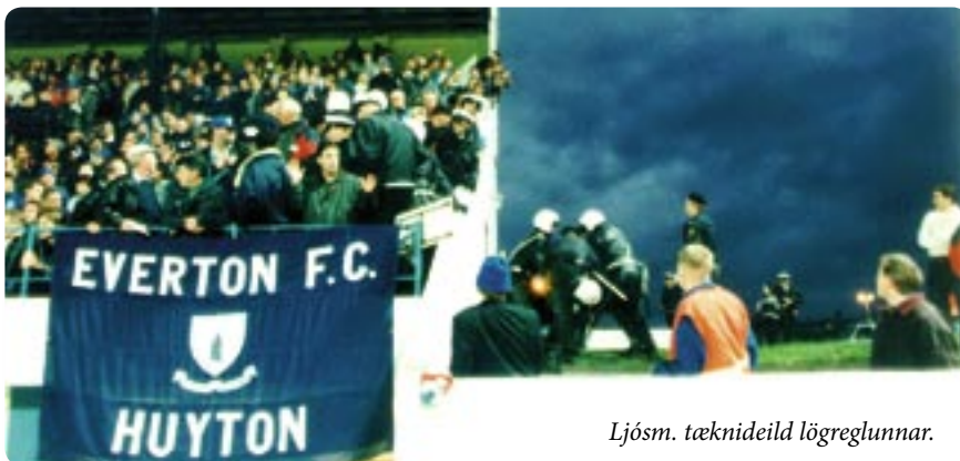
Ljósmynd tæknideild lögreglunnar.

Ríkislögrelustjóri gaf út handbók og verklagsreglur um mannföldastjórnun árið 2002 sem tóku mið af reynslu lögreglunnar hérlendis en einnig var stuðst við aðferðir og skipulag dönsku, bresku og norsku