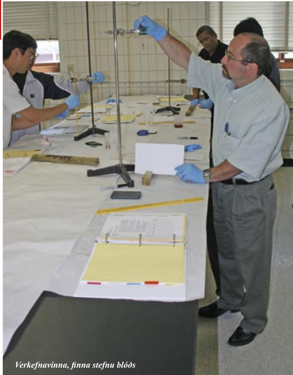
Verkefnavinna, finna stefnu blóðs

hæfðum tæknibúnaði. Hann er þekktur fræðimaður og hefur skrifað kennslubækur um vettvangsrannsóknir auk bóka um sakamál sem hann hefur unnið að. Henry er e.t.v. einna þekktastur fyrir þátt sinn fyrir hönd varnaraðila í máli O J Simpson, þar sem Henry “rasskellti” lögregluna í L.A. fyrir slægleg vinnubrögð. Finna má bækur eftir Henry á http://www.amazon.com t.d. bókina Cracking Cases (the science of solving crime - útg. 2002 Prometheus Books) en sú bók er mjög fræðandi og tekur á ýmsum sértækum tæknirannsóknum.