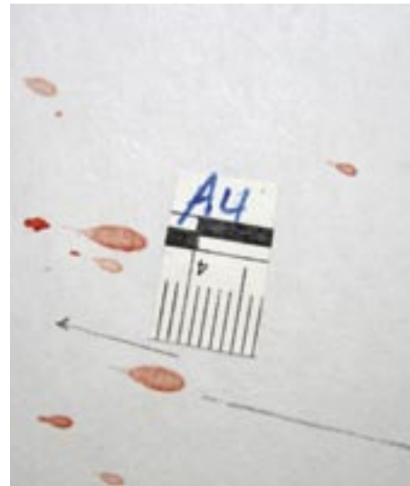
Mynd af algengustu blóðslettum vegna barsmiða

Athyglivert var að bera gögn okkar og vitnisburð undir þrautreynda leiðbeinendur sem yfirfóru skýrslur okkar með stækkunargleri og dásamlega hvössum athugasemdum þegar þeir fundu minnstu smáatriði sem þeir gátu sett út á. Á þessari viku var stofnað til kynna við aðra þátttakendur sem og leiðbeinendur sem getur reynst okkur vel í náinni framtíð ef við þurfum að fá svör við áleitnum spurningum varðandi framkvæmd einhverra tæknilegra rannsókna á vettvöngum hér á landi. Má segja að slík kynni séu ekki síður mikilvæg en sjálf námskeiðið þar sem erlendir starfsfélagar okkar búa yfir mikilli reynslu á sviði vettvangsrannsókna og eru reiðubúnir að miðla þekkingu sinni.