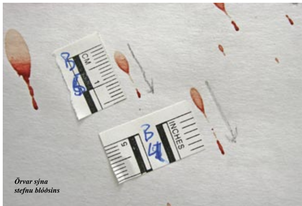
Örvar sýna stefnu blóðsins