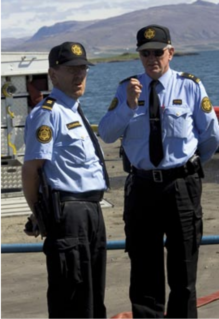
Sumar og sól