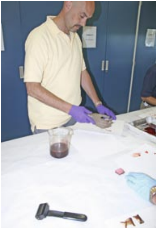
Blóðug handaför búin til

hrekja frásögn um atburðarás. Með blóðferlagreiningu er hægt að komast að því hvað gerðist á vettvangi og með hvaða hætti.