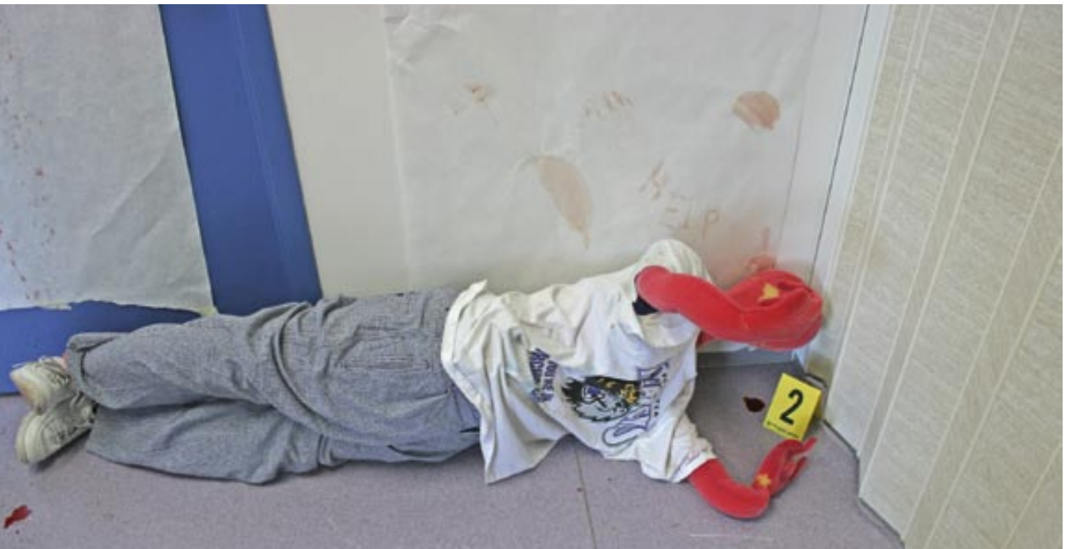
„Hinn látni“ í einu verkefninu