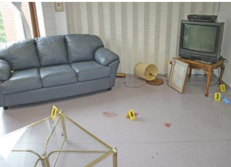
Brotavettvangur, númer við gögn sem tengjast rannsókninni

merkilegri rannsókn á líkamsleifum 76 einstaklinga sem fundust í Lima, Peru. Með nýjustu tækni að vopni komust vísindamennirnir að þeirri niðurstöðu að búíð væri að finna elstu minjar um skotsár á líkamsleifum sem vítað er um, þ.e. frá árinu 1536, þegar Spánverjar réðu niðurlögum Inca.