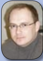
Ritstjóri: Páll Winkel