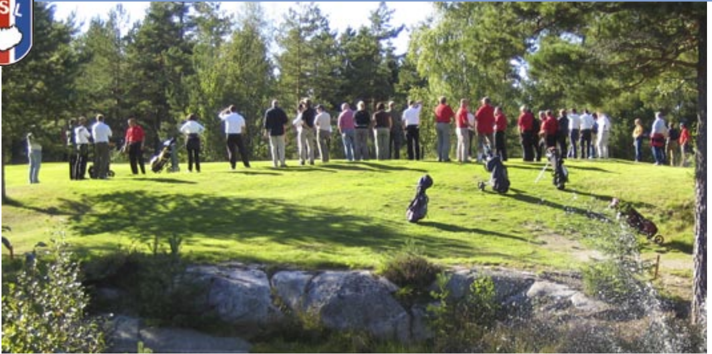
Norðurlandamót í golfi: