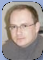
Ritstjóri: Páll Winkel