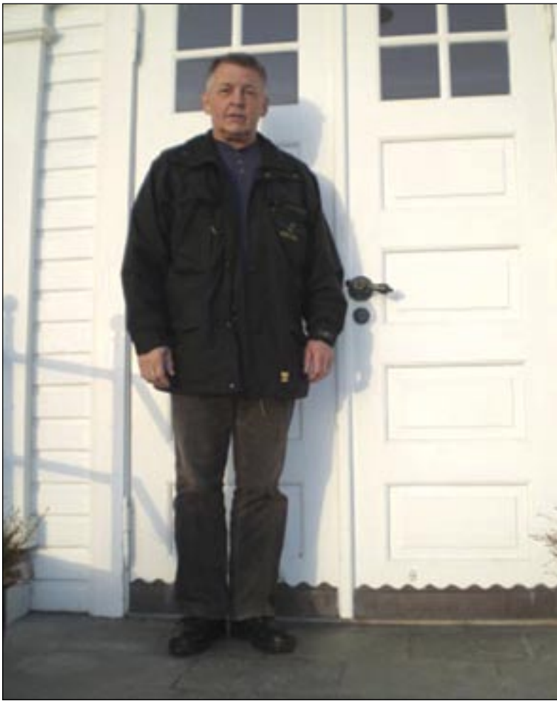
Greinarhöfundur fyrir utan Höfða 20 árum síðar.

Um leið og Reagan kom út úr Höfða eða einkabílnum, opnaðist afturrúðan á honum og upp komu tvö byssuhlaup á stórum rifflum eða vélbyssum og á bak við voru fjórir menn sem skönnuðu svæðið með augunum. Og svo voru það þessir tveir öryggisverðir sem ávallt hlupu með bíl forsetans fyrstu metrana, til hvers eiginlega?