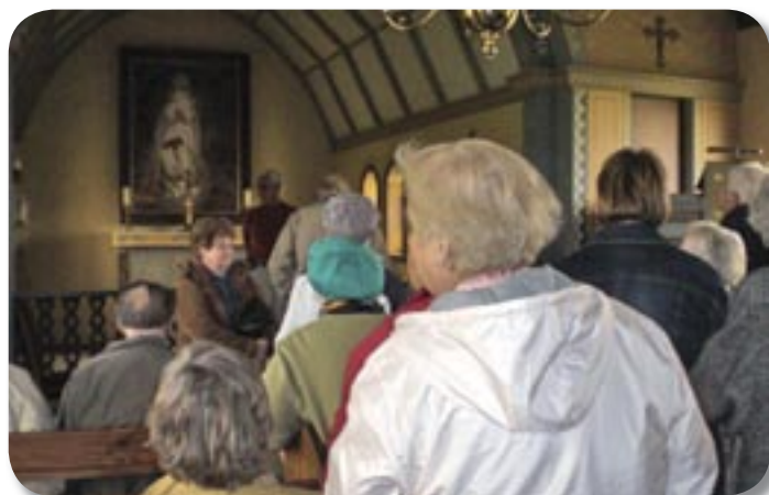
Kirkjan í Odda á Rangárvöllum heimsótt