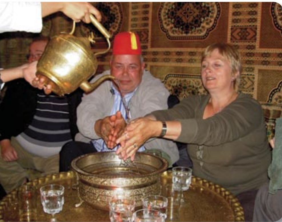
Á marokkóskum veitingastað – hver þjóð hefur sinn sið og matarvenjur.