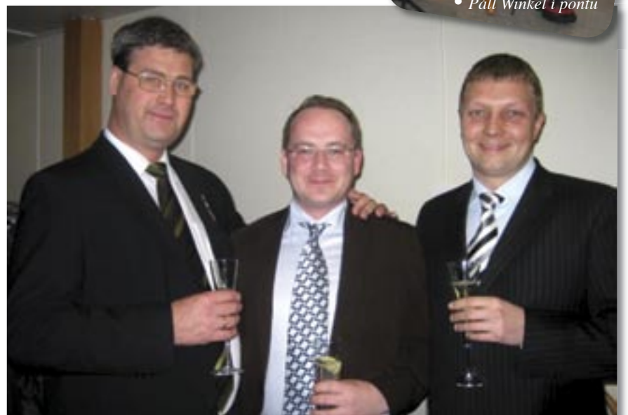
• Ánægðir í lok þings