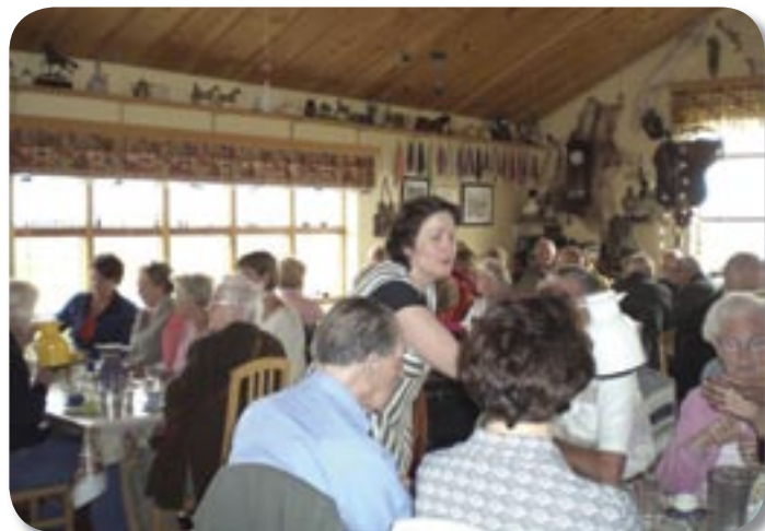
Kvöldverður snæddur í Hestheimum. Húsfreyjan skenkir kaffi