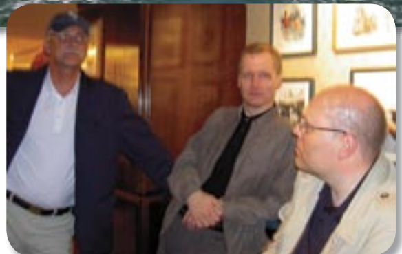
Í hléi frá fyrirlestrum.

manndrápsrannsóknarmenn, sérfræðingar lögreglu í tækni-rannsóknum, lögreglumenn á vettvangi glæpsins, réttarmeinafræðingar og fulltrúar ákærvaldsins. Undantekningar er hægt að gera varðandi aðra einstaklinga eða hópa, sem hafa lagt fram framúrskarandi vinnu við að upplýsa manndrápsrannsóknir. Þeir þyrftu þó ekki að vera félagar í IHIA.