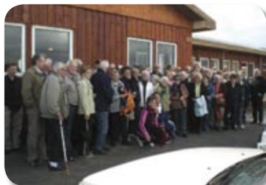
Allur hópurinn saman kominn við Hálendismiðstöðina í Hrauneyjum

Það voru 65 ferðalangar sem lögðu af stað frá lögreglustöðinni við Hverfisgötu en nú brugðust veðurguðirnir okkur því í upphafi ferðar var talsverð rigning og rok en ekki var það látið hefta för. Ekin var Nesjavallaleiðin að Þingvöllum og dást að fallegu umhverfinu á Hengilssvæðinu og meðfram Þingvallavatni sem við hefðum eðlilega notið betur ef veðrið hefði verið betra en ekki þýðir að tala um það. Eftir stutta viðdvöl á Þingvöllum var farið yfir Lyngdalsheiðina að Laugarvatni og Geysi og réttu ferðalangar úr sér þar. Þegar þar var komið höfðum við útsýni yfir Suðurlandið og upp á hálendið þar sem fyrirheit um hádegishressingu var staðsett. Áfram var haldið um Brúarhlöð og niður Hrunamannahrepp og síðan upp Gnúpverjahrepp og Þjórsárdal og stefnan sett á Hálendismiðstöðina við Hrauneyjar. Á þessari leið var sæmilega bjart yfir en talsvert hvasst svo bílstjórinn þurfti að aka mjög varlega. Er komið var að miðstöðinni voru fjórir sýslumenn staddir þar í hlaði í fullum skrúða og heilsuðu þeir upp á mannskapinn. Hér var boðið upp á súpu, brauð og kaffi. Ýmsar vangaveltur urðu um súpuna en hvað um það, ferðalangar voru hressir er haldið var til baka niður Lands-sveitina og stefnan tekin að Odda þar sem stoppað var og kirkjan skoðuð. Eftir hring um Fljótshlíðina var haldið að Hestheimum í Ásahreppi en þar beið okkar hlaðið borð af frábærum mat í mjög notalegu