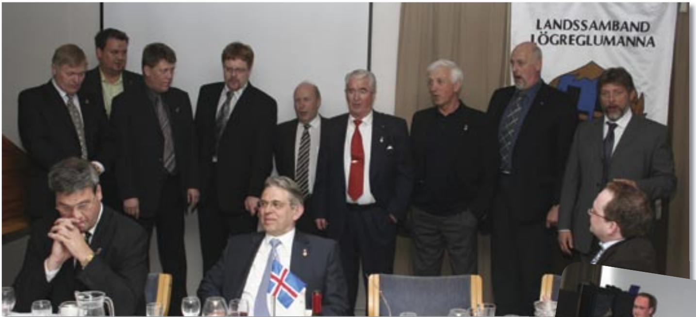
• Viðstaddir félagar úr Lögreglukórnum tóku lagið

þær hugmyndir sem skólinn hefur verið að skoða en taldi jafnframt að eitt af stærstu vandamálunum þar væri að ekki lægi fyrir skýr menntastefna stjórnvalda um menntun lögreglumanna.