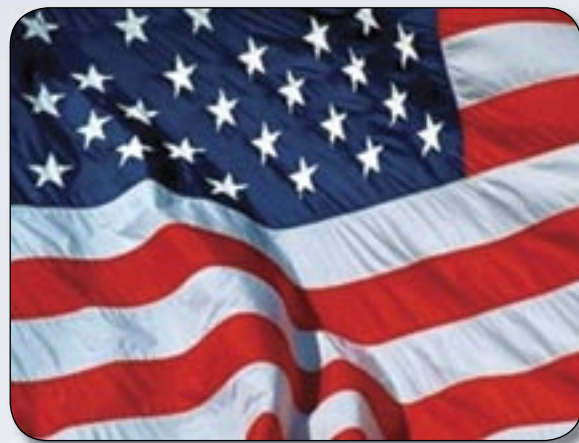
Tákn Bandaríkjanna, ýmist dád eða hatað.