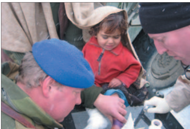
Íslendingar búa um kalsár flóttamanna

er tungumál meirihluta Afgana, fyrir afganska verkamenn á flugvellingum. Við fengum Afgana sem vinnur á vellingum en er einnig lærður kennari til þess að kenna þeim. Afganirnir hafa tekið því fagnandi og leggja sig mjög fram. Námsgögnin fengum við hjá Laugarnesskóla og fluttum þau út sjálfir.