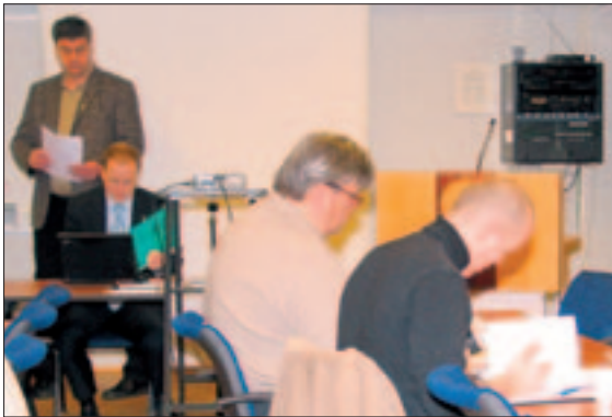
Djúpt sokknir fundarmenn