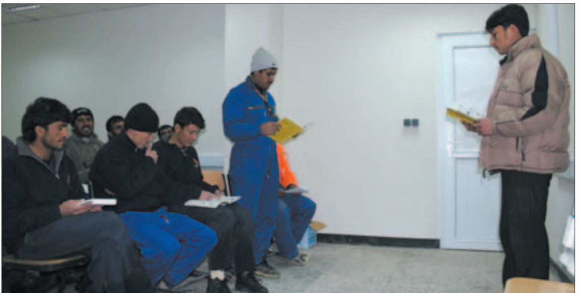
Íslendingar stóðu fyrir ensku og dari kennslu fyrir verkamenn á flugvöllum.