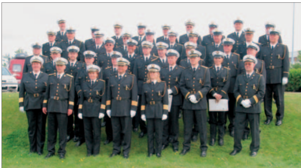
Fyrsti útskriftarhópur Stjórnunar 1

Tuttugu og sex svör bárust af 37, sem er u.þ.b. 70% svarhlutfall.