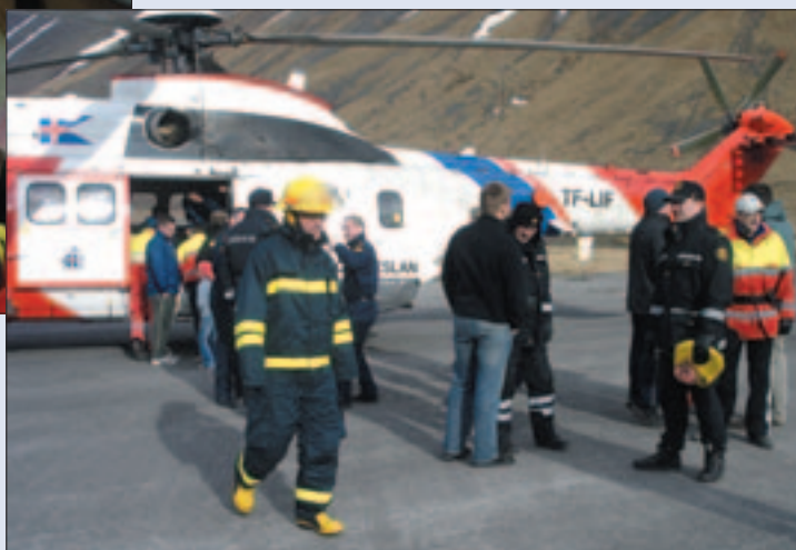
Farið var yfir móttöku á þyrlu