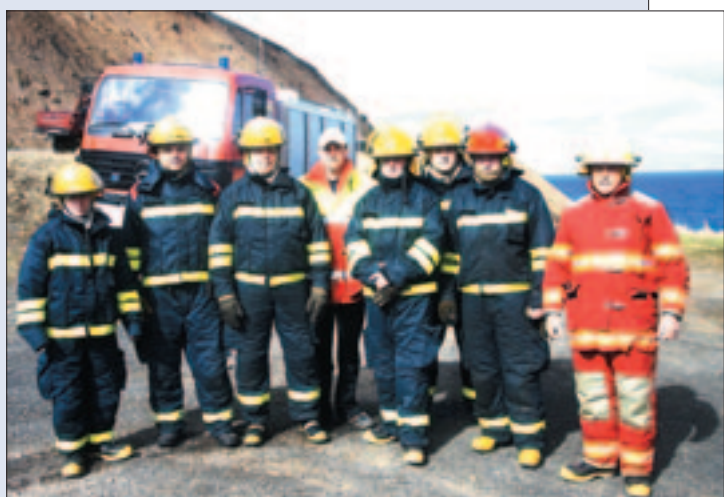
Lögreglumenn á Ísafirði í óhefðbundnum búningum