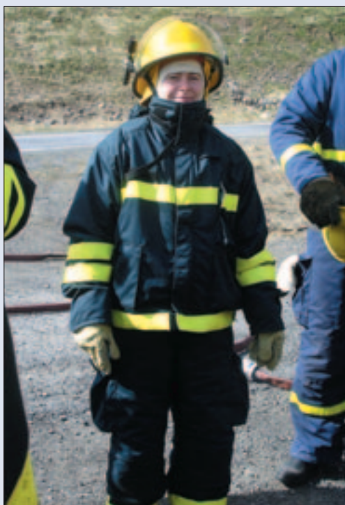
Ágústa komin í gallann, allan gallann