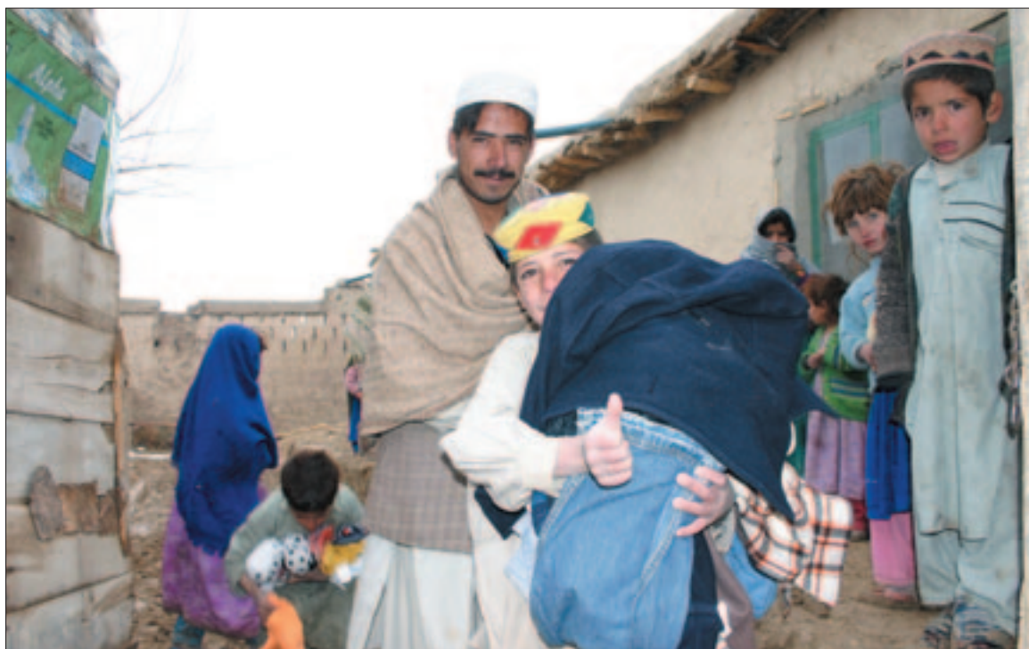
Íslenskir friðargæsluliðar við úthlutun á fötum í flóttamannabúðum,