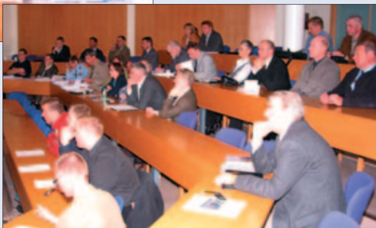
Áhorfendur og hluti nema.