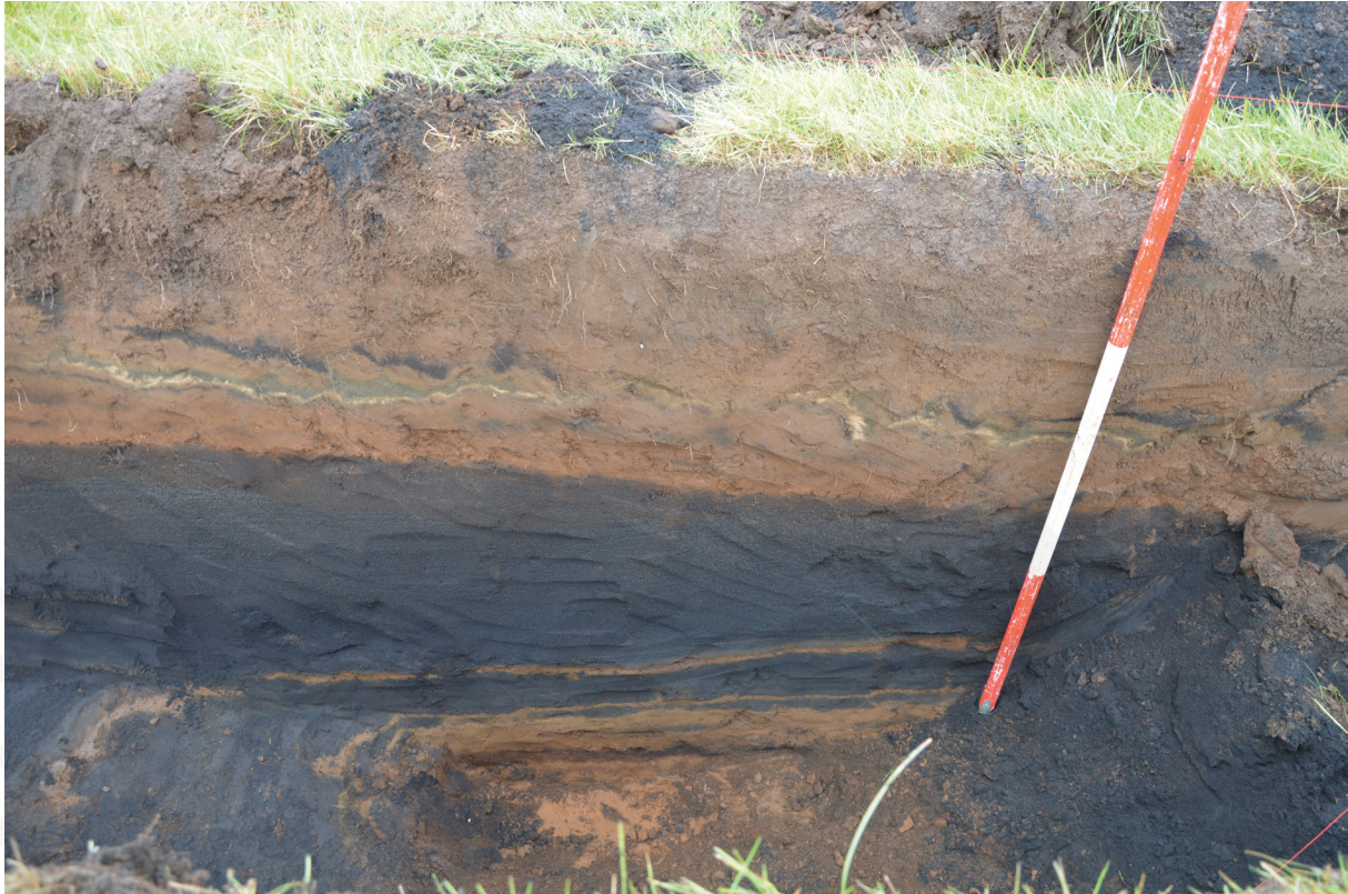
Mynd 4. Þústin reyndist ekki geyma nein mannvistarlög en neðst í skurðinum var mjög fingerður sandur.