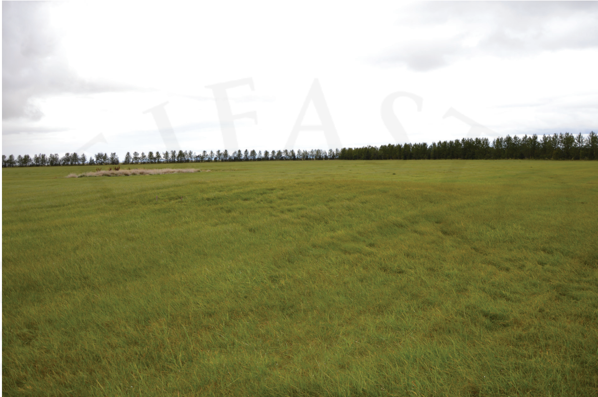
Mynd 2. Þúst RA-255:036 sést hér fyrir miðri mynd og er myndin tekin til norðurs.