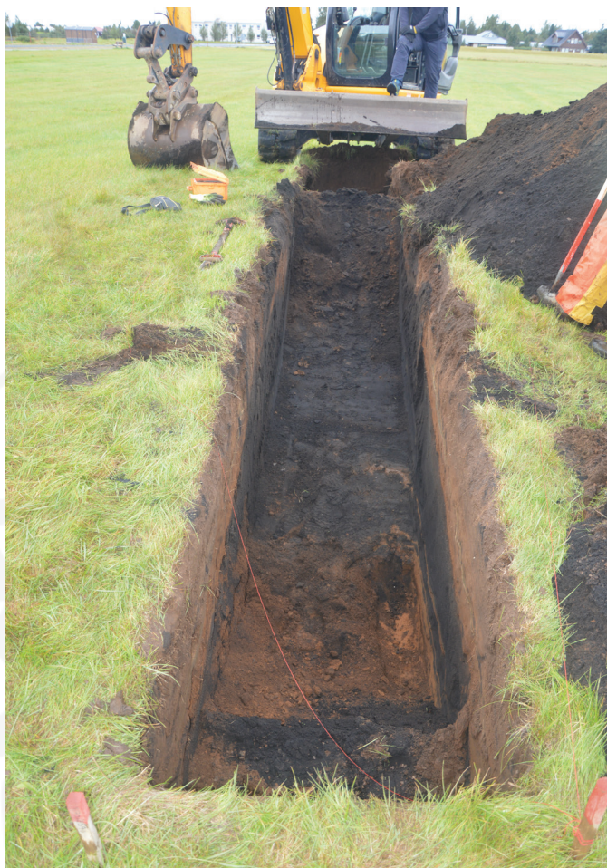
Mynd 3. Grafinn var um 6m langur skurður þvert í gegnum þúst RA-255:036.