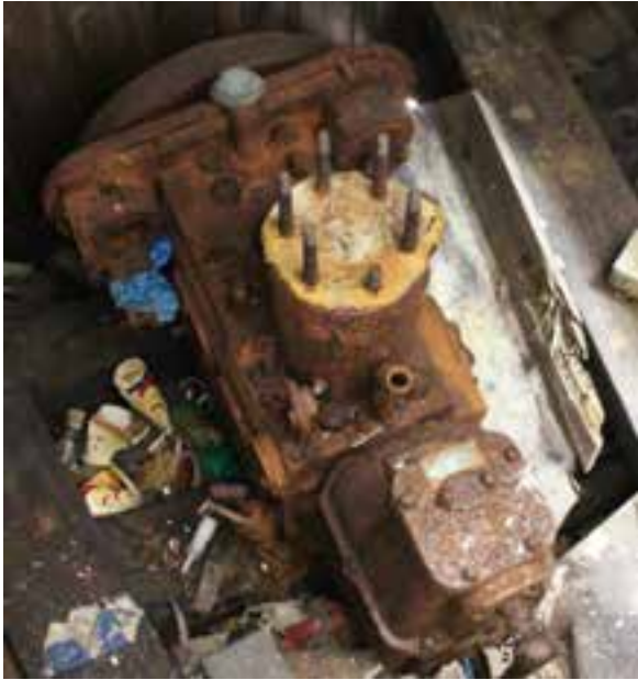
Hrólfur Gautreksson SU 299, vélin. Ljósmynd. HMS 2018