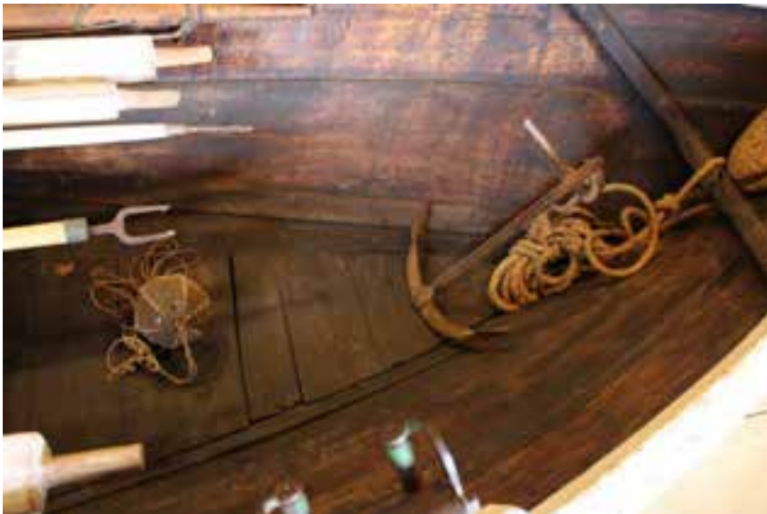
Árabátur, árgangur 1915-1916, barki.