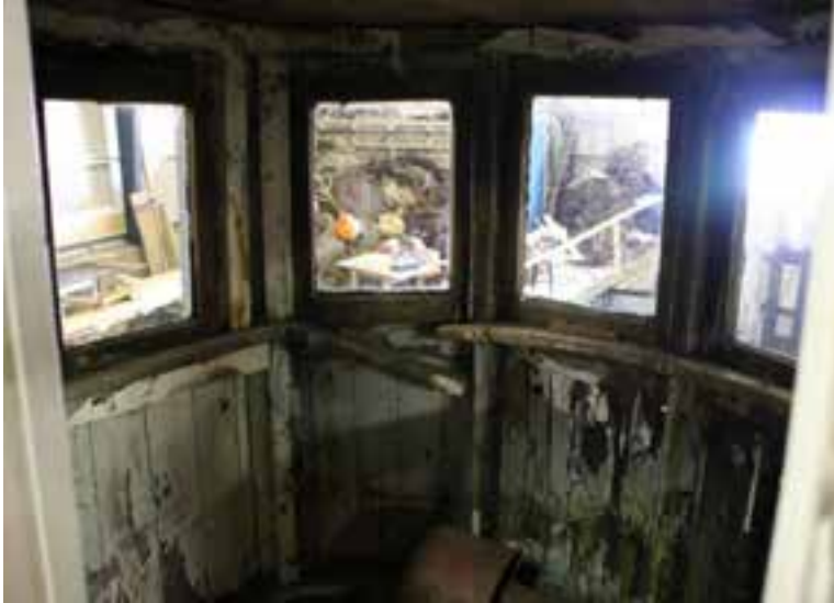
Nakkur SU 380 í Síldarsjóhúsinu, stýrishúsið. Siglingatækin vantar.