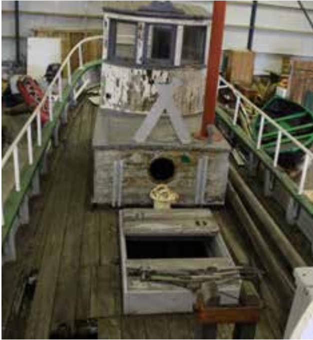
Nakkur SU 380 í Síldarsjóhúsinu, 2018, millidekkið og stýrishúsið.