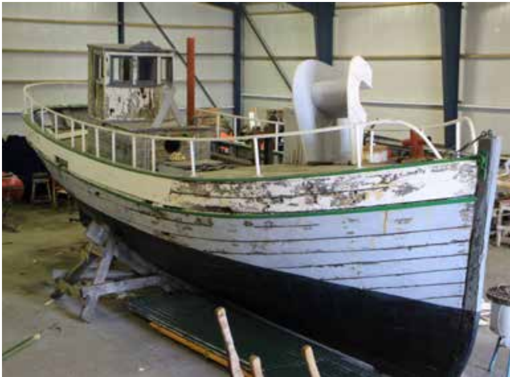
Nakkur SU 380 í Síldarsjóhúsinu, 2018. Renna stendur upp á endann í stafni.