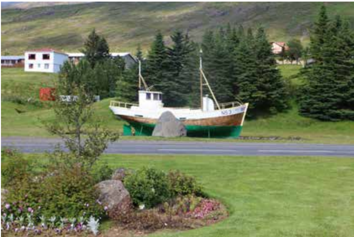
Rex fer vel í landslaginu á Fáskrúðsfirði. Verst er að hann þolir illa að vera úti. Ljós. HMS 2018