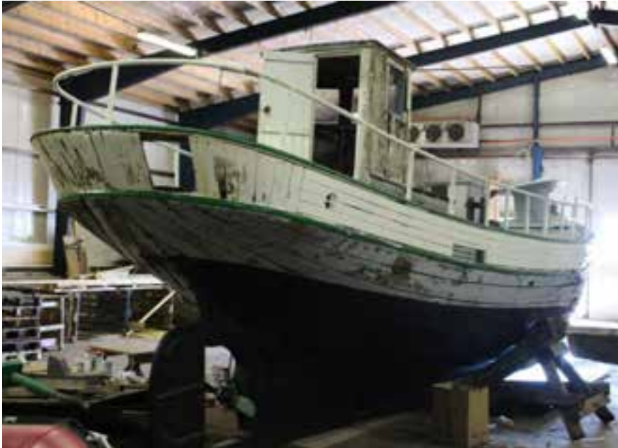
Nakkur SU 380 í Síldarsjóhúsinu, 2018.