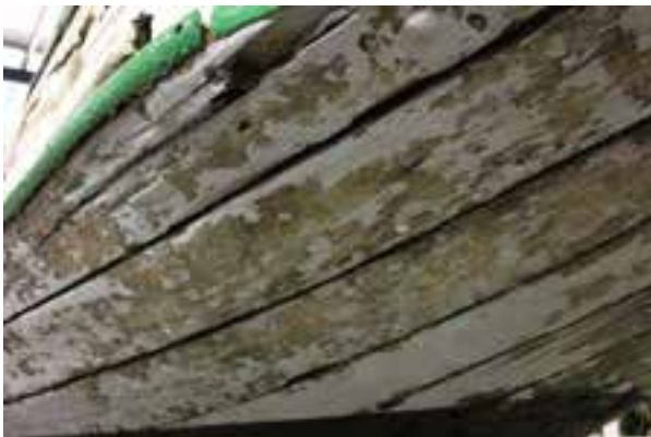
Nakkur SU 380 í Síldarsjóhúsinu, byrðingurinn.

Nakkur á sér langa og merka sögu. Hann er annar elsti bátur sem varðveist hefur á Austurlandi, á eftir Hrólfi Gautrekssyni, og þar með annar elsti fiskibáturinn og vélbáturinn. Hann er innfluttur eins og algengt var með austfirska báta. Hann á sér sögu á Íslandi frá árinu 1929. Saga hans er að mestu skráð.