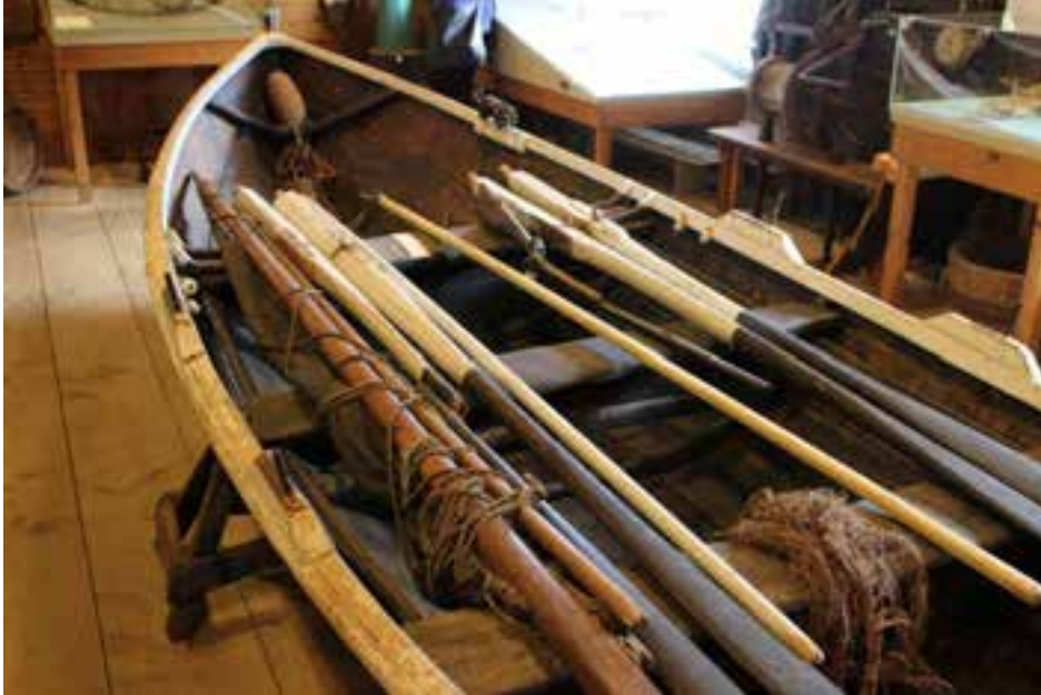
Búnaður í árabátnum, mastur og segl, árar, net, byssa.

Með honum eru flest þau veiðarfæri og tól sem eigandinn notaði, m.a. handfæri og hnísuskutull.