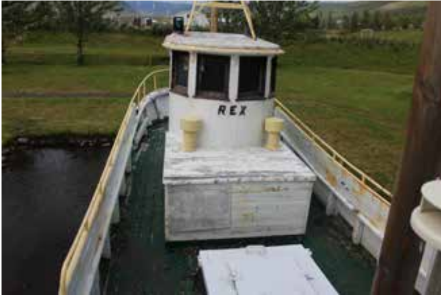
Rex NS 3, stýridhúsið og millidekkið. Ljós. HMS 2018