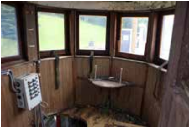
Rex NS 3, stýrishúsið, 2018.