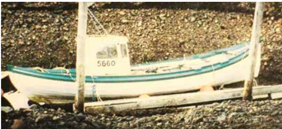
Svanur SU 513 fyrir neðan bæinn Stóru Breiðuvík, Reyðarfirði. Ljós. Jón Allansson 1995.