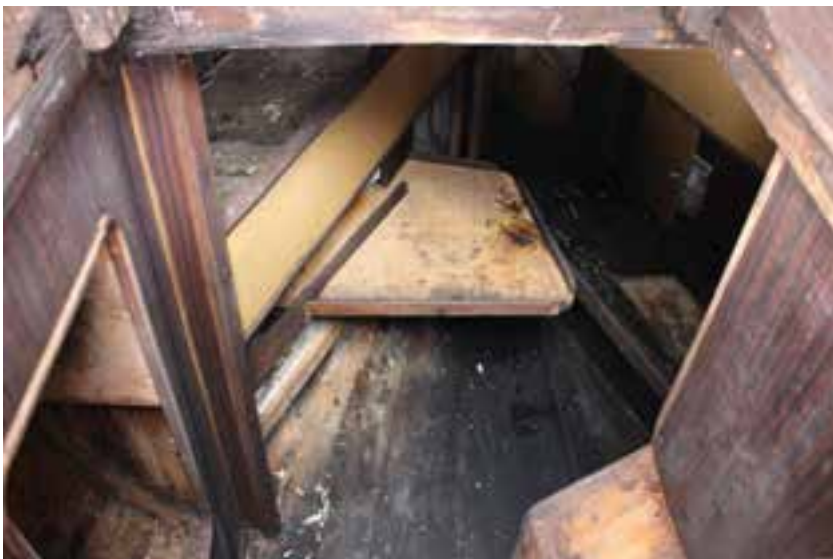
Rex NS 3, lúkarinn, árið 2018.