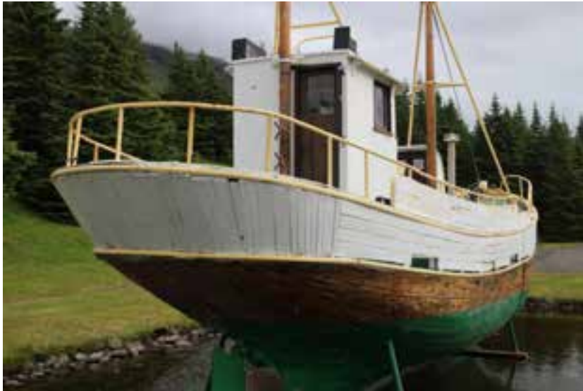
Rex NS 3, á Fáskrúðsfirði, skuturinn, 2018.

11. Lengd, breidd og dýpt í m: 8,7 x 2,81 x 1,05 52