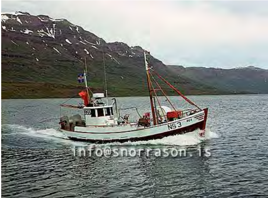
Rex NS 3 á siglingu, 2002.