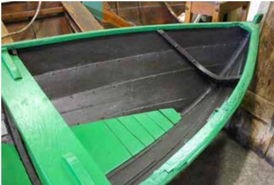
Árabátur norskur, árg. 1957, skuturinn. Ljós. HMS 2018.