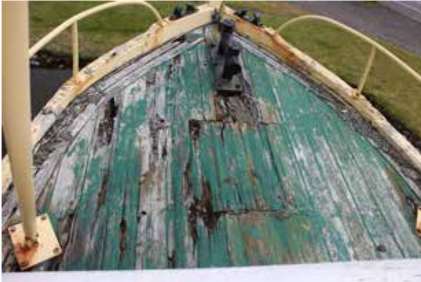
Rex NS 3, á Fáskrúðsfirði, fúi á dekki, 2018.