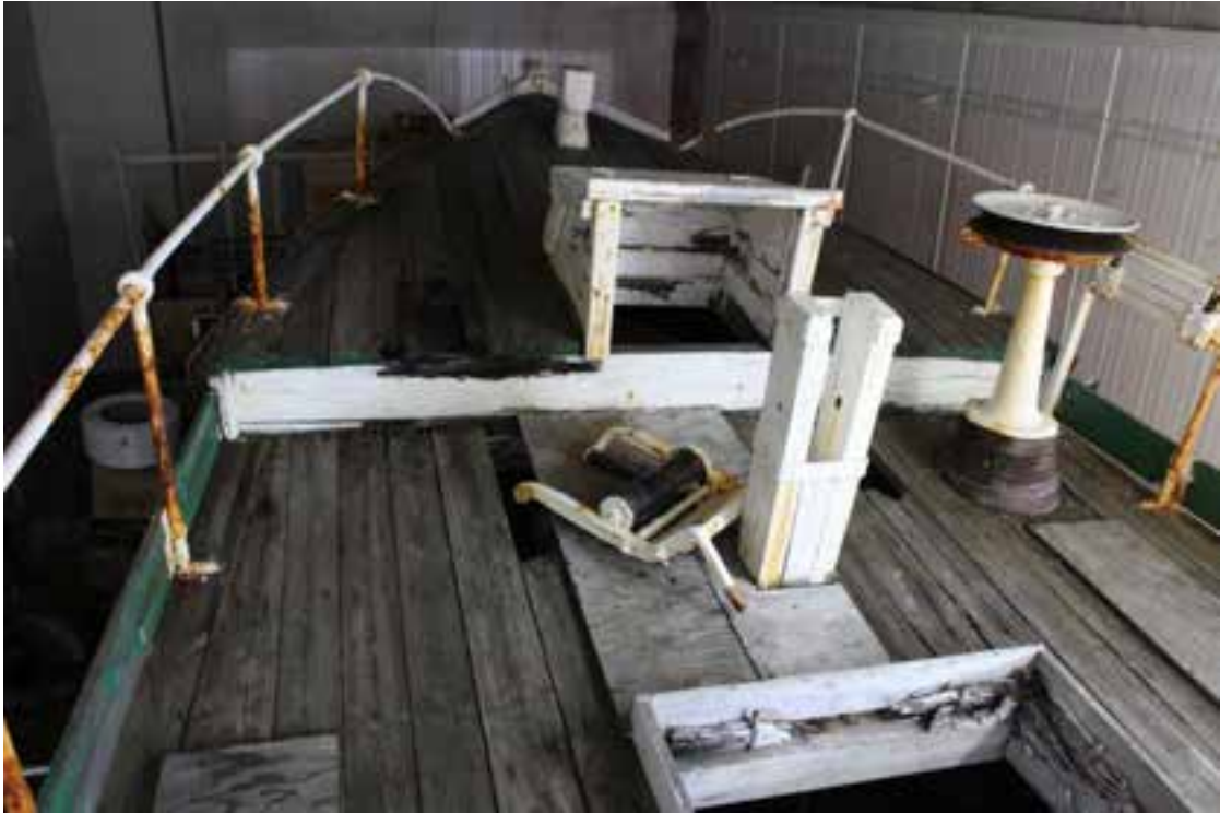
Hrólfur Gautreksson SU 299, miðskips. Ljós. HMS 2018