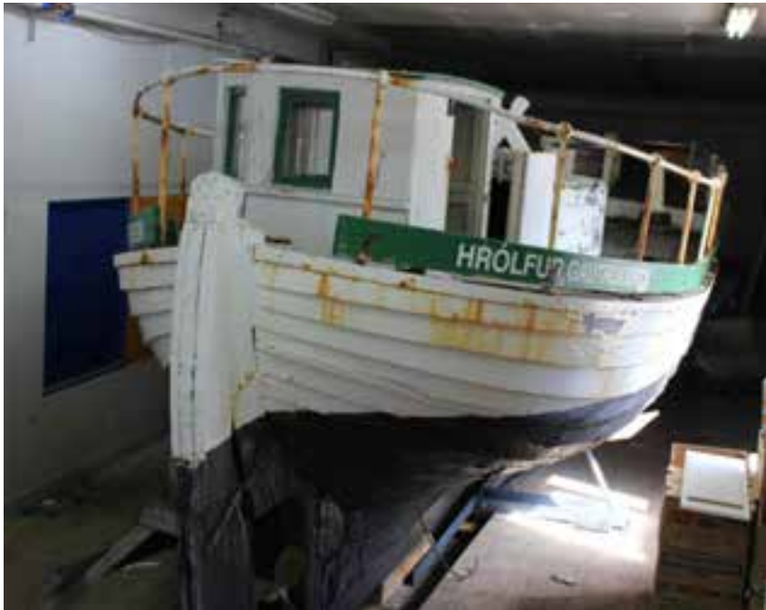
Hrólfur Gautreksson SU 299, í geymslu 2018.

6. Varðveislustaður: Í skemmu við hlið safnahússins í Neskaupstað.