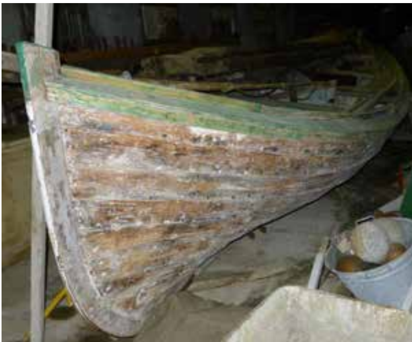
Svanur SU 513 árið 2018 í geymslu á Reyðarfirði.

13. Skrokklag: Norskt bátalag. 34 Skv. einni heimild er hann svokallaður Lófótungur en hann líkist þó ekki mikið Nirði TH 246 sem varðveittur er á Húsavík.