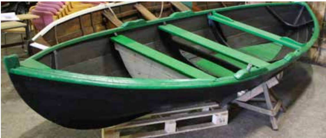
Árabátur norskur, árg. 1957. Ljós. HMS 2018.