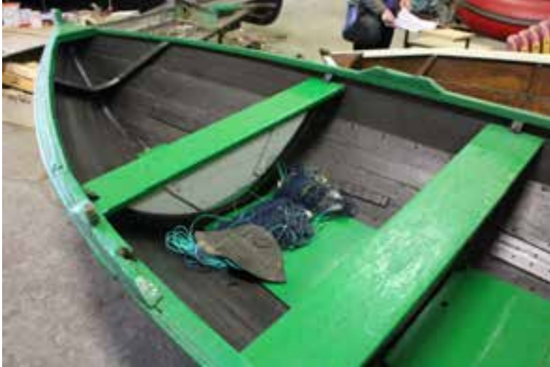
Árabátur norskur, árg. 1957, barki. Ljós. HMS 2018.

Báturinn er í góðu standi. Saga hans er dæmigerð fyrir sjálfsbjargarviðleitni heimamanna.