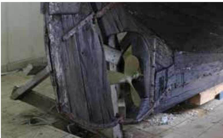
Hrólfur Gautreksson SU 299, stýrið og skrúfan.