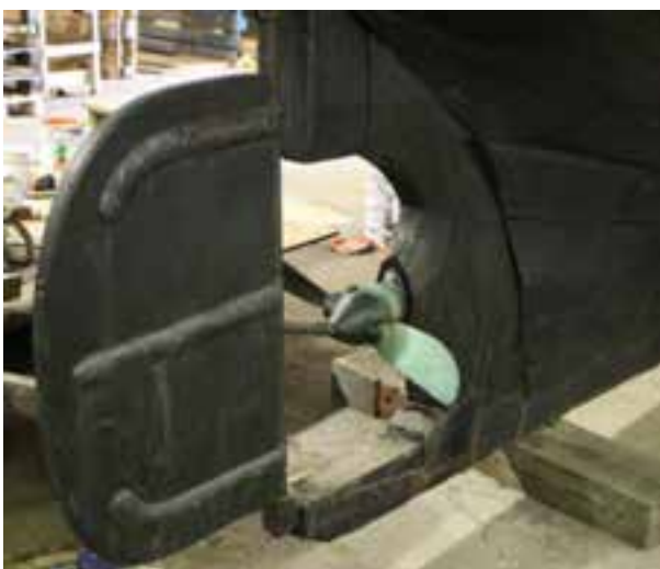
Nakkur SU 380 í Síldarsjóhúsinu, stýri og skrófa. Ljós. HMS 2018