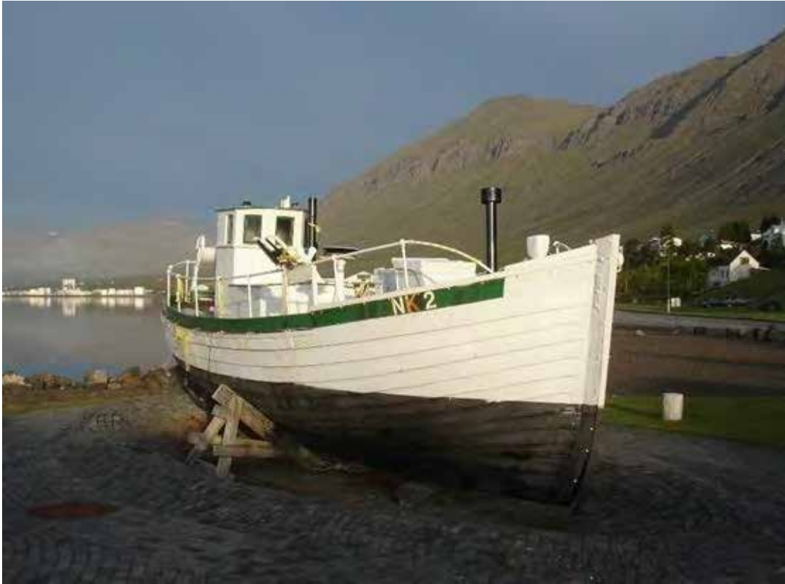
Hrólfur Gautreksson SU 299 / NK 2 árið 2013.