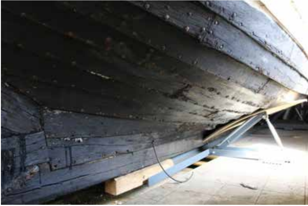
Hrólfur Gautreksson SU 299, byrðingurinn.