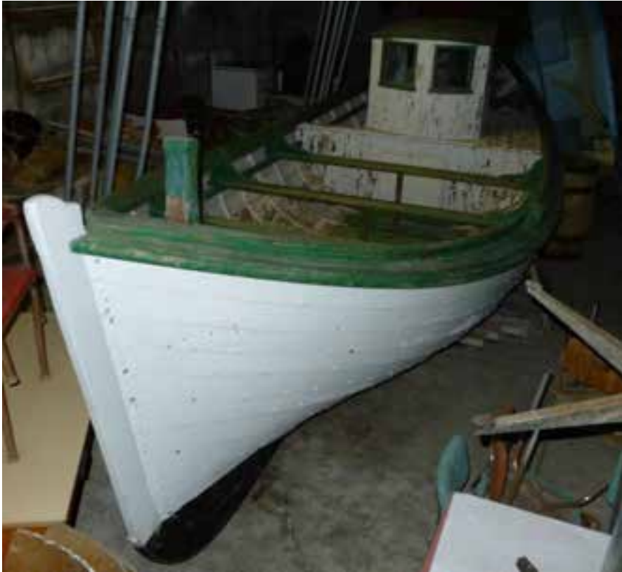
Kópur í geymslu á Reyðarfirði, 2018.