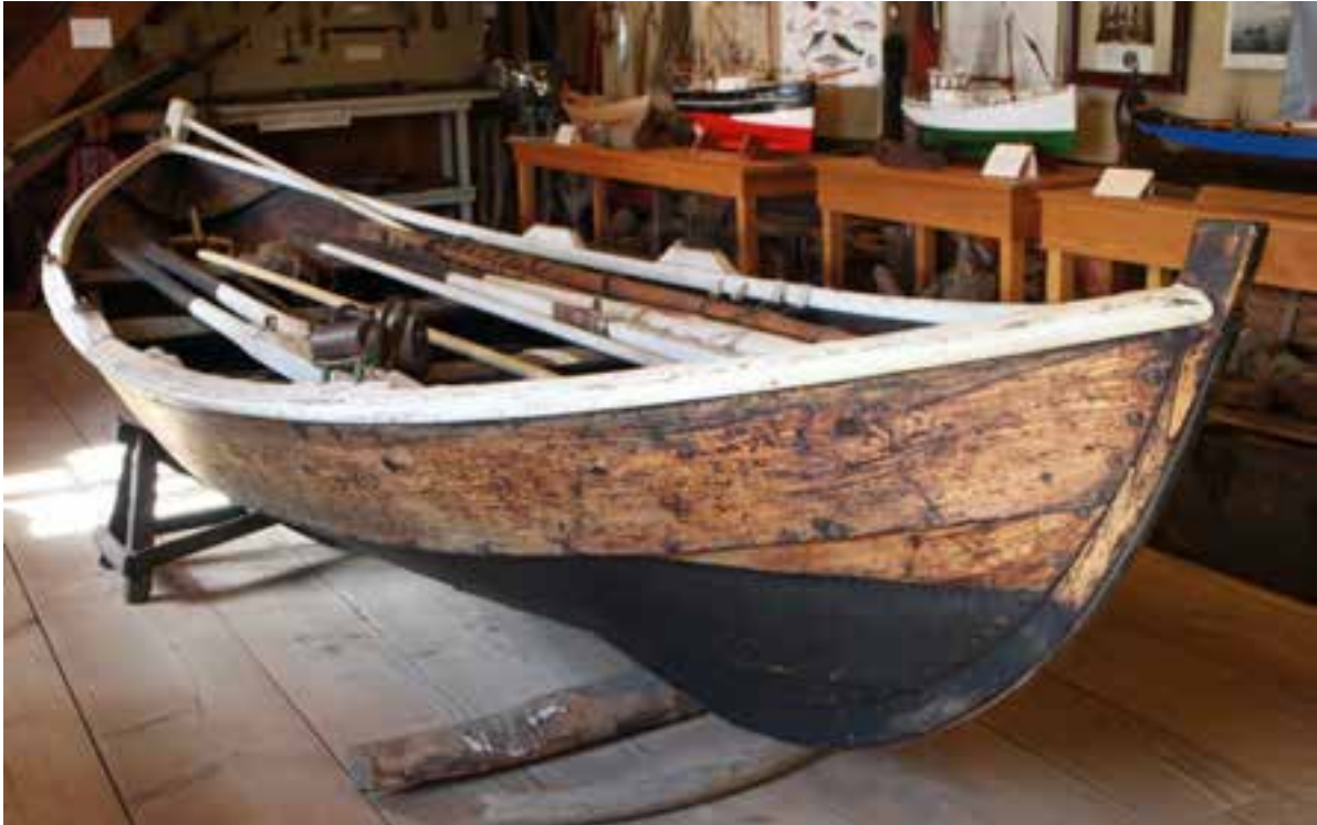
Árabátur, árgangur 1915-1916.