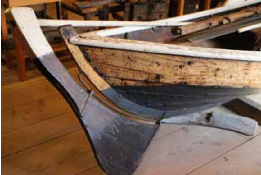
Árabátur, árgangur 1915-1916, skutur.