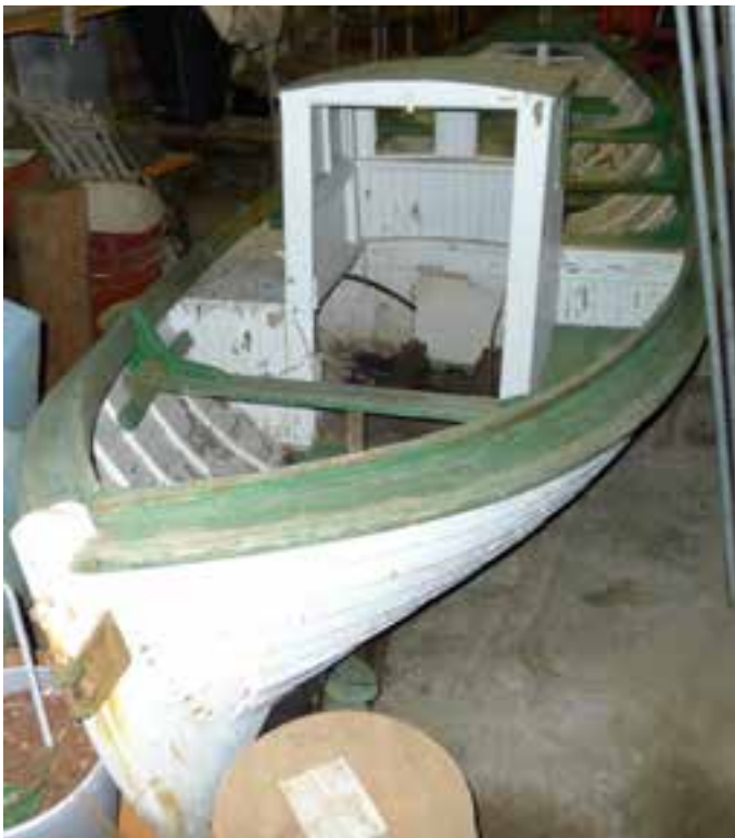
Kópur í geymslu á Reyðarfirði, 2018. Horft ofan í hann og skuturinn.