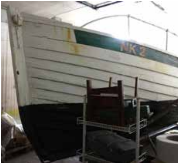
Hrólfur Gautreksson SU 299, stefnið.