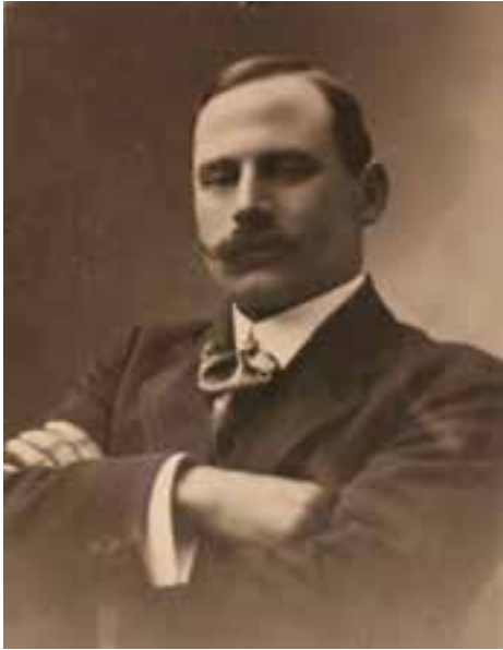
Karl Jónasson. Ljósmynd. Sjóminjasafn Austurlands