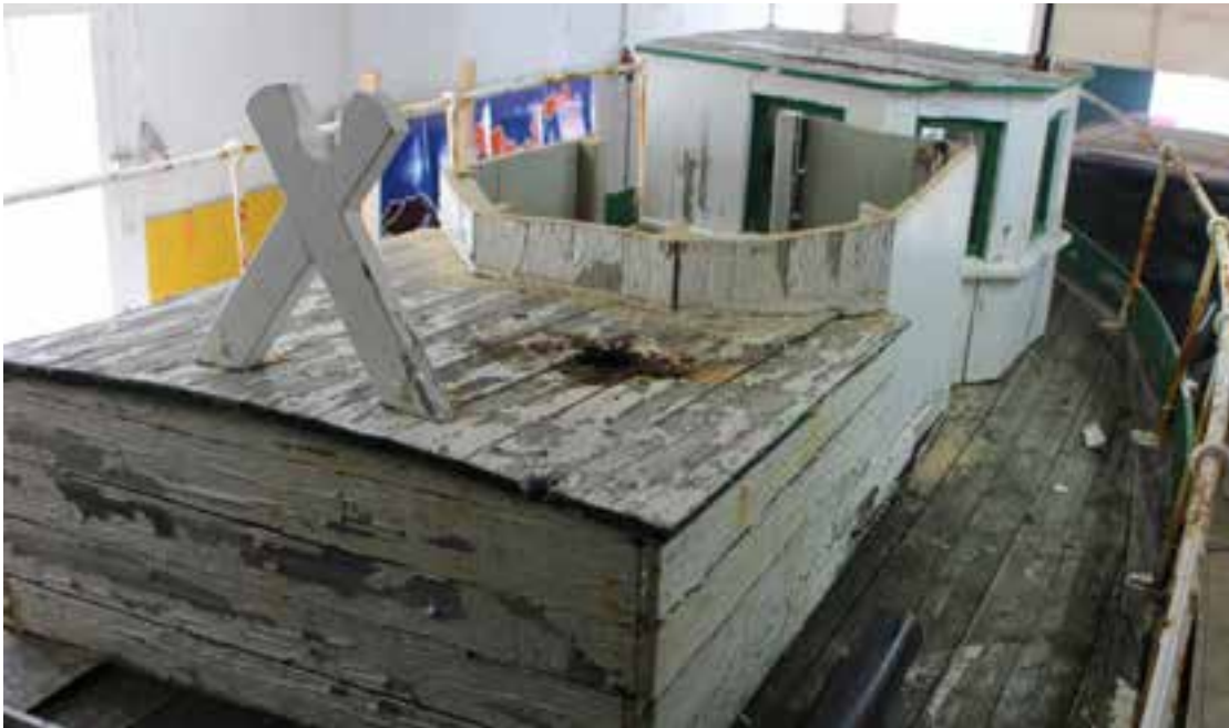
Hrólfur Gautreksson SU 299, vélarreisnin nær, stýrishúsið, sagað í tvennt til að koma bátum inn í hús, fjær. Ljós. HMS 2018