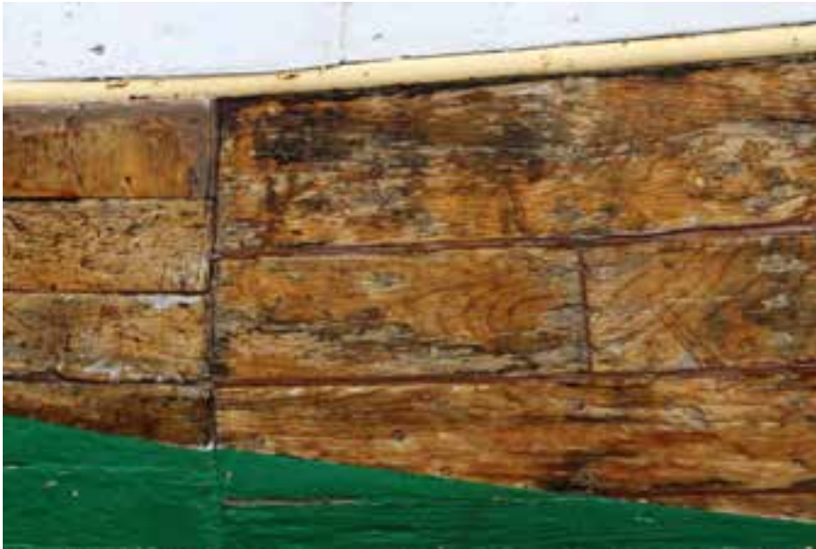
Rex NS 3, byrðingurinn, 2018.