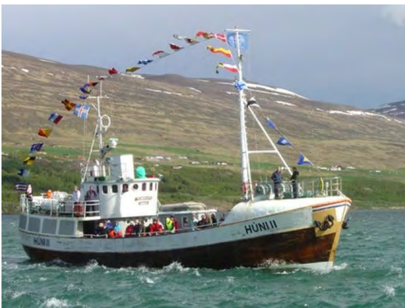
Húni II á siglingu með ferðamenn á Eyjafirði.