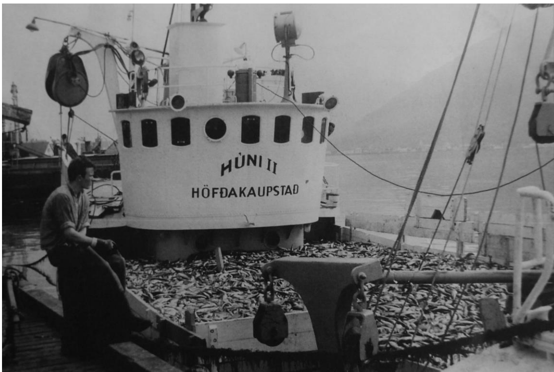
Húni bíður löndunar, líklega á Seyðisfirði. 10

Um og eftir 1990 lenti báturinn á flakki sem tengdist íslenska kvótakerfinu. Hann var gerður út í eitt ár frá Ólafsvík og fór eftir það aftur til Skagastrandar. Þá var hann enn seldur til Hornafjarðar. 1994 var honum lagt við kant á Seyðisfirði, hann tekinn af skipaskrá og gert ráð fyrir að hann yrði úreltur, rifinn. 9