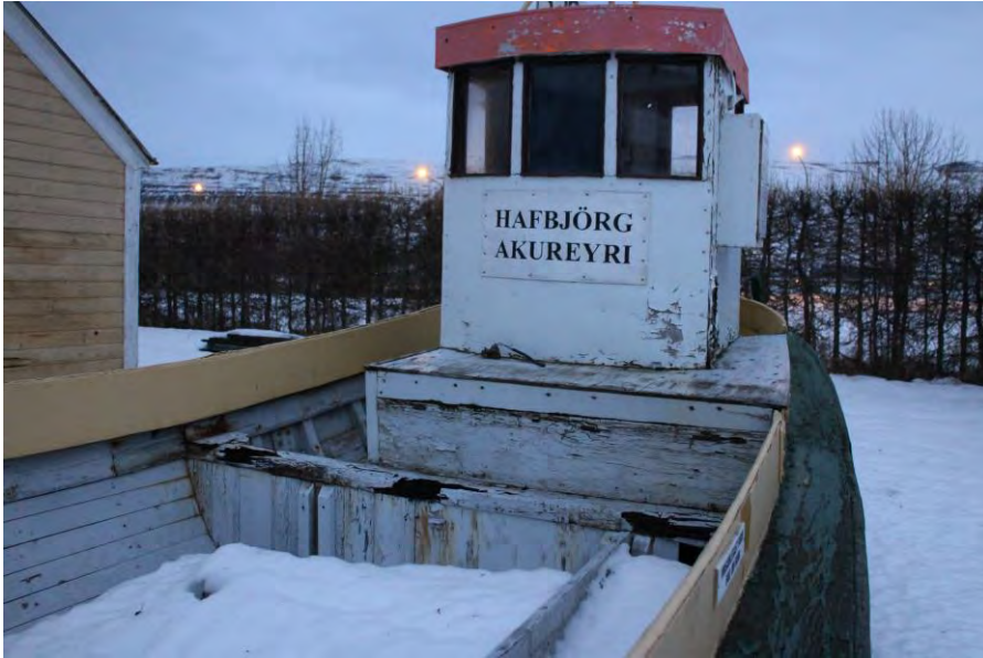
Hafbjörg EA 174 fyrir framan Iðnaðarsafnið, nóvember 2017.