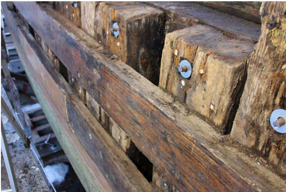
Plankaskipti í Húna II haustið 2017. Byrðingurinn er að mestu leyti Upprunalegur eftir 56 ár.

Húni II er stærsta eikarskip smíðað á Íslandi sem enn flýtur. Alls voru smíðaðir yfir 100 stærri eikarbátar á Íslandi á árunum 1940 til 1970. Húni II er eini báturinn sem eftir er. Hann er í öllum meginatriðum óbreyttur frá fyrstu gerð.