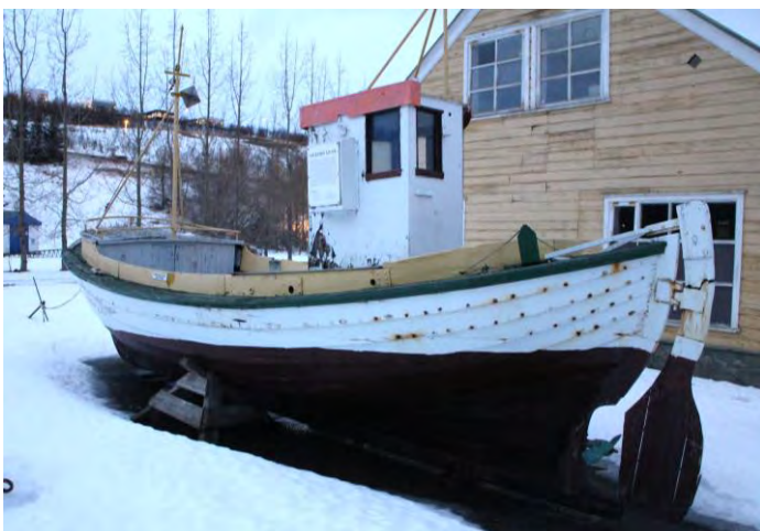
Hafbjörg fyrir framan Iðnaðarsafnið, nóvember 2017.