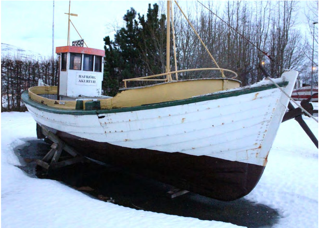
Hafbjörg EA 174 fyrir framan Iðnaðarsafnið, nóvember 2017. Ljós. HMS