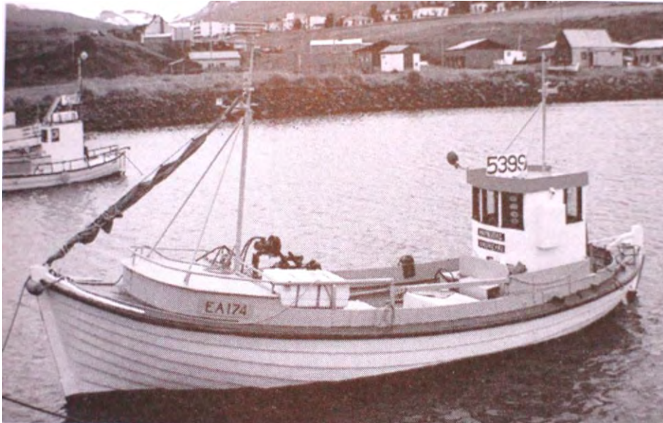
Hafbjörg EA 174 meðan hún var gerð út. 16

11. Lengd, breidd og dýpt í m: 7,53 (mesta lengd) x 2,25 x 1,02