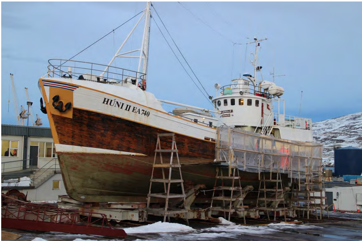
Húni II í árlegum slipp á Akureyri. Ljós. HMS