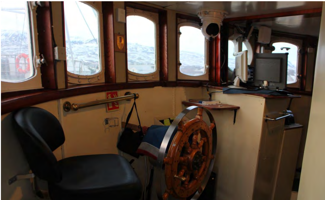
Úr brú Húna II, 2017.

Öll helstu siglingatæki eru um borð í Húna II, sbr. meðfylgjandi mynd, enda er hann með haffærnissskírteini.