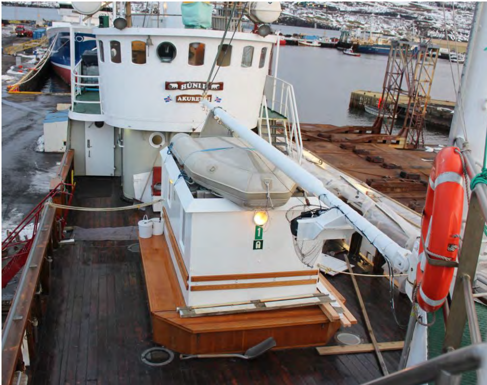
Dekkið og stýrishúsið á Húna II, haustið 2017.