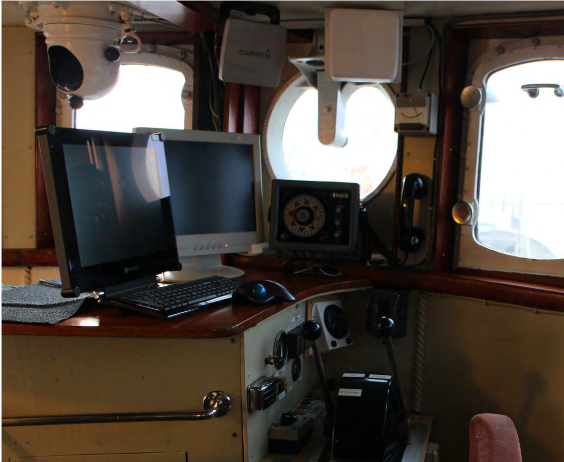
Úr brú Húna II, 2017. Ljós. HMS