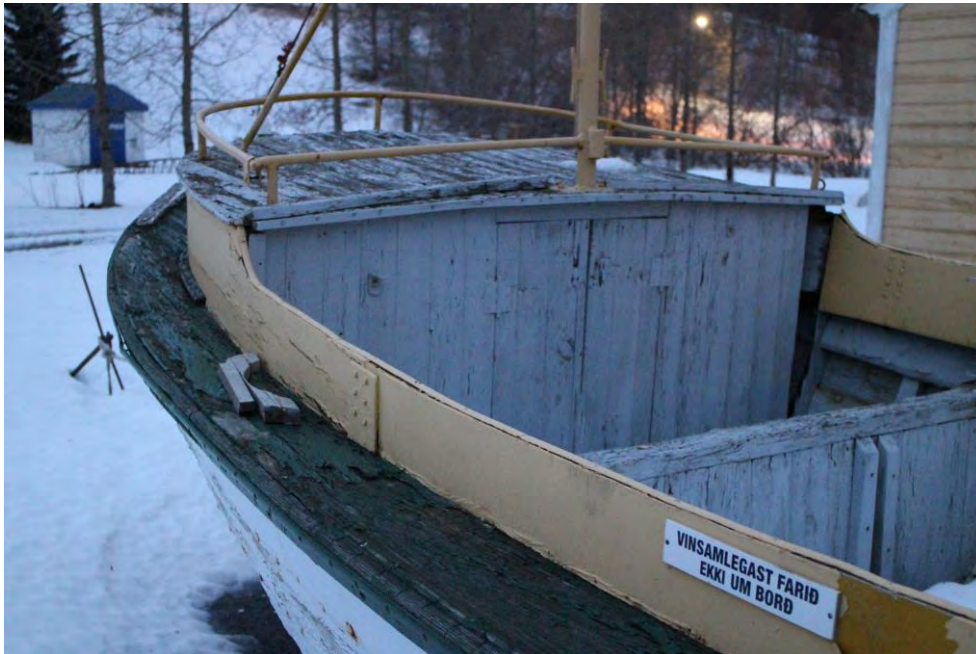
Hafbjörg EA 174 fyrir framan Iðnaðarsafnið, nóvember 2017.