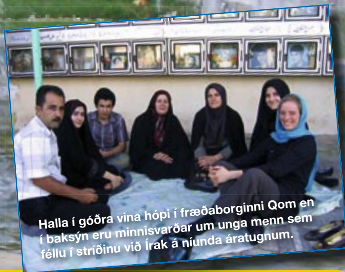
Halla í góðra vina hópi í fræðaborginni Qom en í baksýn eru minnisvarðar um unga menn sem féllu í stríðinu við Írak á níunda áratugnum.

Ungar konur spjalla í almenninggarði í Teheran. Teheran-búar njóta oft lífsins í almenninggörðum og eru mikið fyrir lautarferðir.