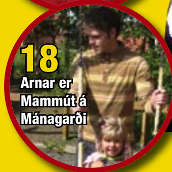
18 Arnar er Mammút á Mánagarði