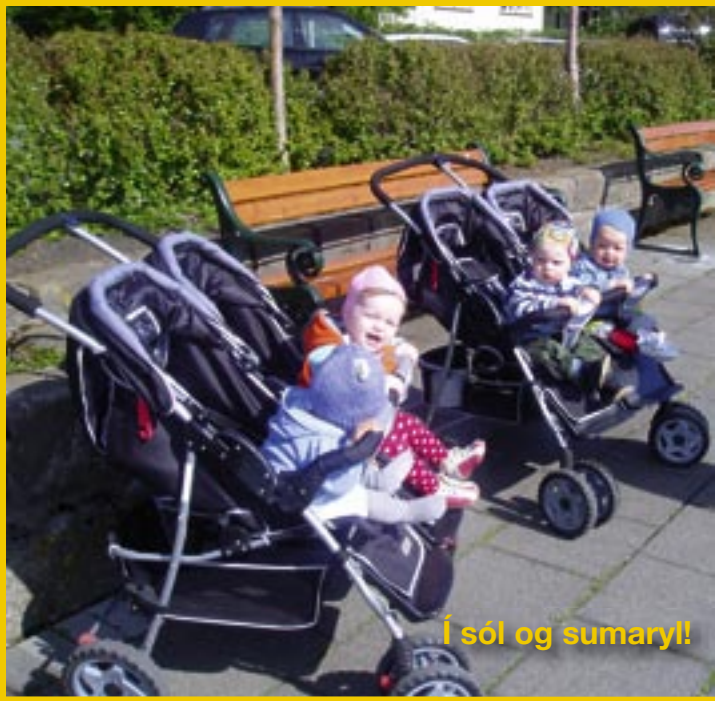
Í sól og sumaryll!