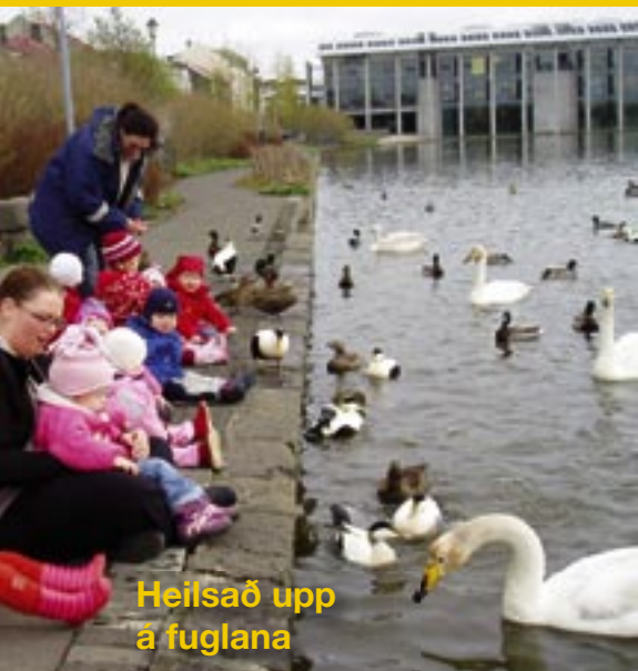
Heilsað upp á fuglana