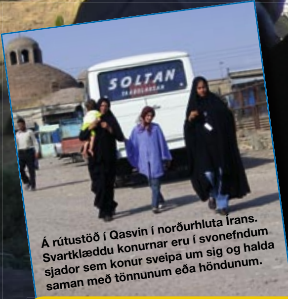
Á rútustöð í Qasvin í norðurhluta Írans. Svartklæddu konurnar eru í svonefndum sjador sem konur sveipa um sig og halda saman með tönnum eða höndunum.

Allir stúdentar sem útskrifast frá Háskóla Íslands geta sótt um verkefnastyrki FS. Árlega eru veittir fjórir styrkir vegna BS- eða BA-verkefna. Að auki eru tveir styrkir veittir vegna meistara- eða doktorsverkefna. Markmið styrkveitinganna er að hvetja stúdenta til að skapa metnaðarfull lokaverkefni og koma þeim á framfæri og kynna frambærileg verkefni. Öllum stúdentum sem skráðir eru á hi-nem er sendur tölvupóstur sem inniheldur upplýsingar um umsóknarferlið en einnig má finna upplýsingar á heimasíðunni www.fs.is .