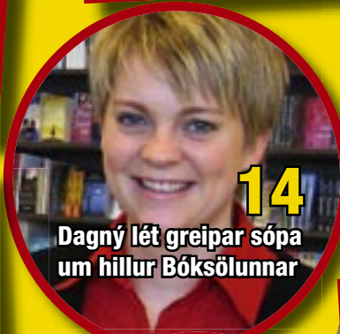
14 Dagný lét greipar sópa um hillur Bóksölnunnar