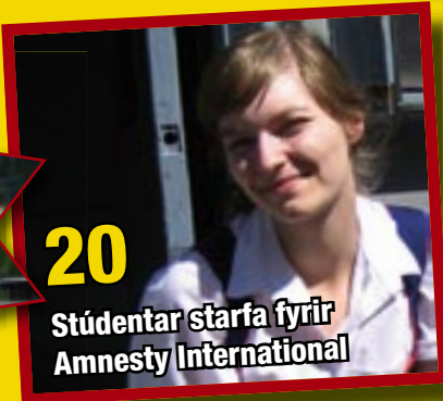
20 Stúdentar starfa fyrir Amnesty International