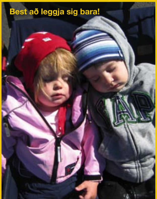
Best að leggja sig bara!