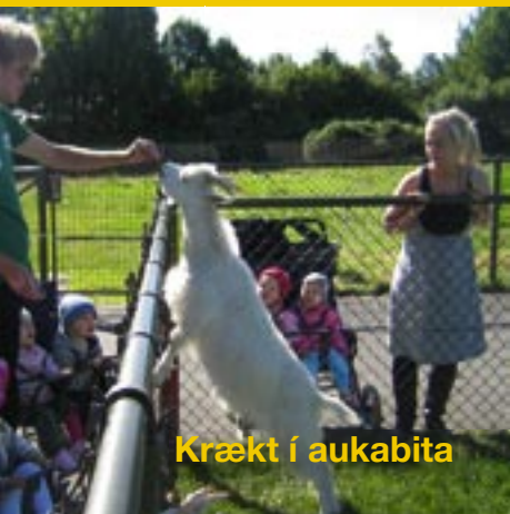
Krækt í aukabita