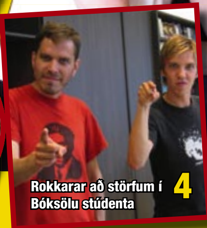
4 Rokkarar að störfum í Bóksölu stúdenta

Tímarit Félagsstofnunar stúdenta, 1. tbl. 2008. FS-blaðið er kynningarrit sem gefið er út af Félagsstofnun stúdenta. Ritstjóri: Magnús Björn Ólafsson. Ábm.: Rebekka Sigurðardóttir. Auglýsingar: Markaðsmenn ehf. Prentun: Litlaprent.