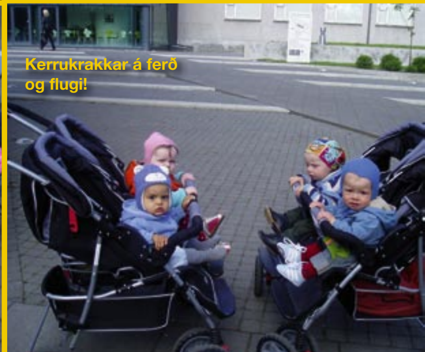
Kerrukrakkar á ferð og flugi!