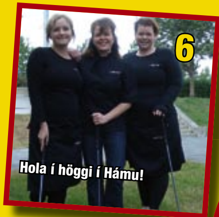
6 Hola í höggi í Hámu!