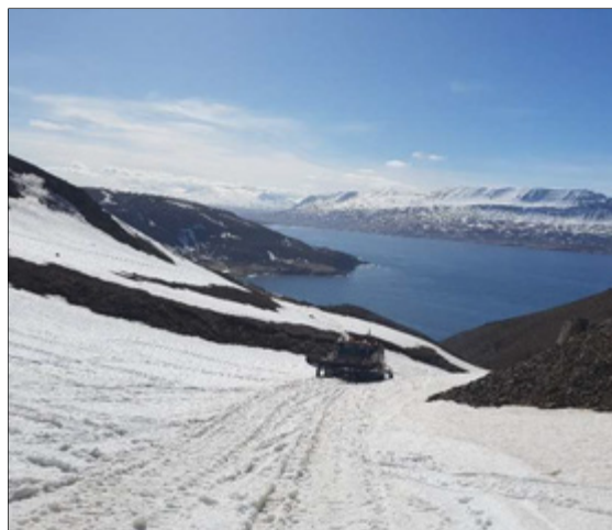
Horft yfir Eyjafjörð úr hlíðum Kaldbaks

RMF kallar eftir tilnefningum í janúar ár hvert fyrir verkefni sem voru metin til prófgráðu á árinu á undan. Forsenda tilnefninga er að lokaverkefni uppfylli ítrustu kröfur sem gerðar eru til rannsóknaritgerða á viðkomandi námsstigi og séu faglega unnin í hvívetna.