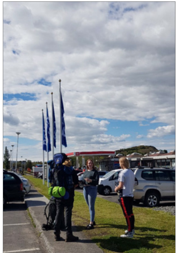
Gagnasöfnun á Egilsstöðum fyrir verkefnið Erlendir gestir á einstökum svæðum

Rannsóknin tilheyrir reglulegri gagnasöfnun hins opinbera á ýmsum þáttum ferðaþjónustu og ferðamennsku á Íslandi og var unnin af RMF og Rannsóknasetri Háskóla Íslands á Húsavík fyrir Ferðamálastofu.