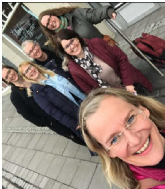
Starfsfólk RMF á góðri stundu milli funda á Akureyri í apríl.