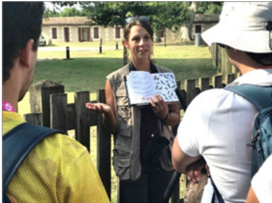
Vettvangsferð á MMV 9 - ráðstefnunni í Bordeaux