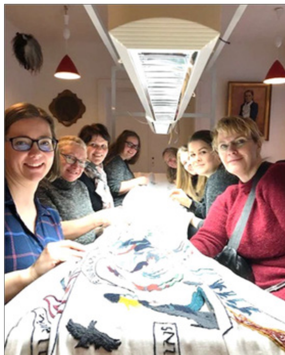
Starfsfólk RMF við refsilaum á Blönduósi í desember