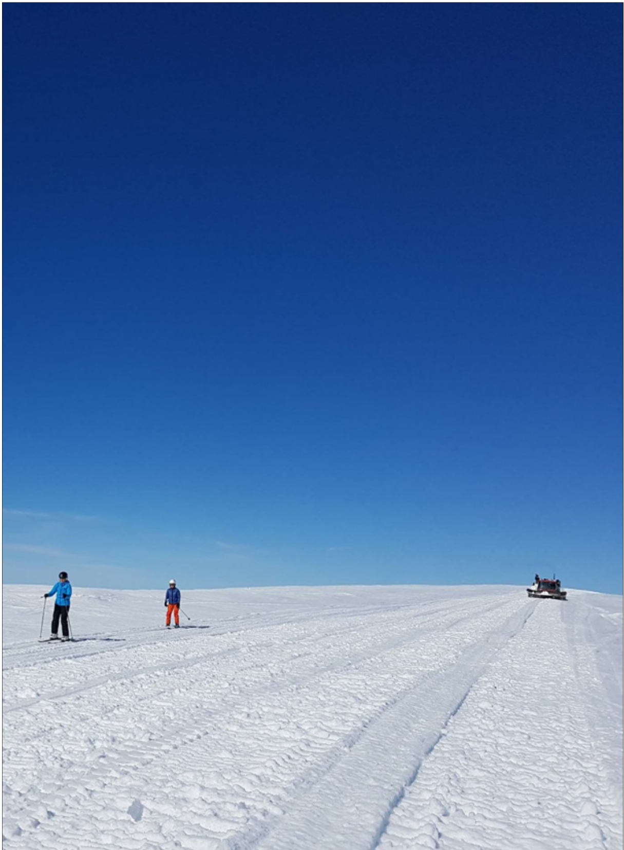
Úr vorferð Skemmtifélags starfsfólks Háskólans á Akureyri á Kaldbak