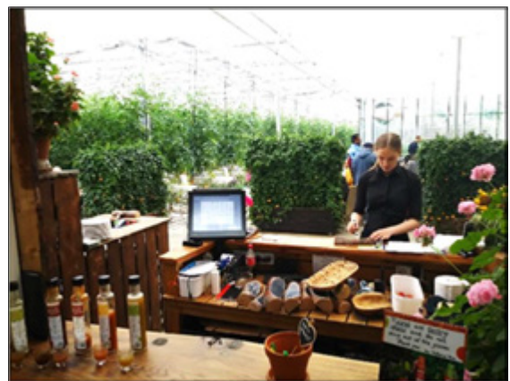
Friðheimar í Reykholti

Forrannsókn á kjörum og aðstæðum erlends starfsfólks í ferðaþjónustutengdum greinum á Íslandi. Rannsóknin er tvískipt. Annars vegar eru um að ræða viðtöl við fulltrúa staðbundinna verkálýðsfélaga og stofnana sem veita upplýsingar til innflytjenda um réttindi og skyldur í íslensku samfélagi. Þessi viðtöl fóru fram sumarið 2018. Hins vegar er um að ræða viðtöl við starfsfólk í ferðaþjónustu sem verða tekin á vormánuðum 2019. Í rannsókninni verða áskoranir og aðstæður erlends starfsfólks í ferðaþjónustu bornar saman eftir svæðum. Sjónum er beint að völdum svæðum á Suðurlandi (Mýrdalshreppi og Bláskógabyggð), Reykjanesbæ og Vestfjörðum. Svæðin eru mismunandi með tilliti til ársíðasveiflu og ásókn