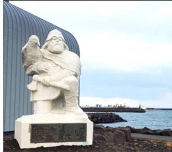
Hrafna-Flóki stendur vaktina við Víkingaheima í Reykjanesbæ

Rannsóknahópur um aðferðafræði og samburð rannsókna í ferðamálum. Hópurinn var myndaður í kjölfarið á 13. ráðstefnunni um ábyrga ferðþjónustu á áfangastöðum (e. 13th International Conference on Responsible Tourism in Destinations), sem haldin var í Reykjavík 28. – 29. september 2017. Markmið hópsins er að kanna hvernig hægt sé að setja saman skilvirka ferla, eins konar verkfærakistu, sem er ætluð hagsmunaaðilum í ferðþjónustu svo að hægt sé að nálgast viðfangsefni í ferðþjónustu á sjálfbæran og ábyrgan hátt.