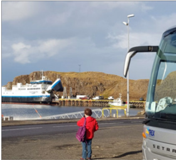
Ferðamaður horfir yfir til Súgandiseyjar þar sem Breiðafjarðarferjan býr sig til brottfarar frá Stykkishólmi. Ferðavenjur erlendra ferðamanna og viðhorf heimamanna til ferðamanna og ferðaþjónustu voru könnuð í Stykkishólmi á árinu.