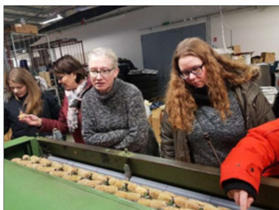
Heimsókn í Þrjónastofuna Kidku á Hvammstanga í desember.