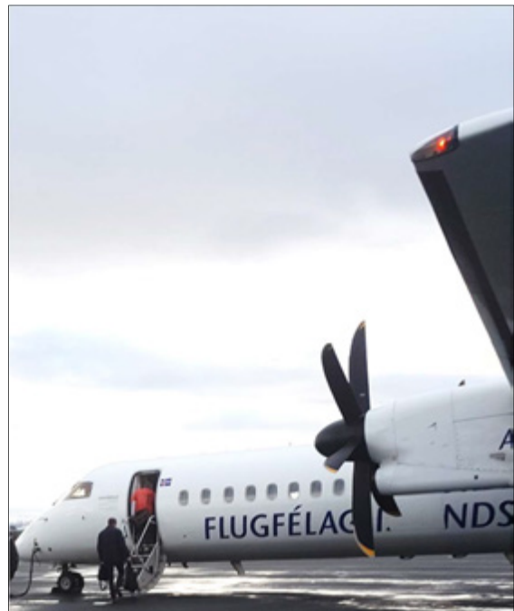
Farþegar ganga um borð. RMF kannaði viðhorf ferðamanna í beinu tengiflugi milli Keflavíkur og Akureyrar.

Könnun á viðhorfum ferðamanna í beinu tengiflugi milli Keflavíkur og Akureyrar. Gögnum var safnað um erlenda ferðamenn í tengifluginu til að varpa ljósi ferðahegðun og neyslu þeirra á Norðurlandi. Einnig var kannað hvaða hópar aðrir hefðu verið í tengifluginu, hvað hefði einkennt þá, hvernig ferðaskipulagi þeirra hefði verið háttað, hvaða flugtengingar þeir hefðu notað ásamt viðhorfi þeirra til þjónustu flugfélagsins. Könnunin var netkönnun