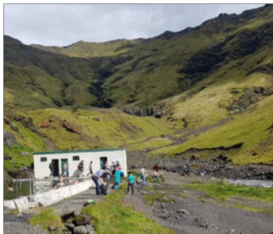
Ferðamenn við Seljavallalaug

Meginmarkmið rannsóknarinnar er að kanna áhrif ferðapjónustu og ferðamanna á heimamenn á Íslandi. Ferðamennska og ferðapjónusta geta markað djúp spor í samfélög heimamanna en töluverður munur getur verið á því í hverju samfélagi hvaða áhrifaþættir veða mest. Í rannsókninni eru könnuð viðhorf heimamanna sem búa við nærveru ferðamanna og skoðað er hvaða áhrif ferðamennska hefur á lífsgæði þeirra. Rannsóknin er liður í vöktun á viðhorfum landsmanna til ferðapjónustu með reglubundnum hætti, annars vegar með könnunum á landsvísu og hins vegar með könnunum á einstaka svæðum.