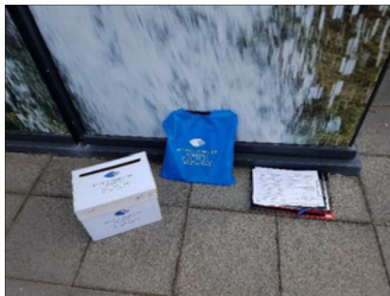
Vinnugögn spyrta við könnun meðal farþega skemmtiferðaskipa á Akureyri