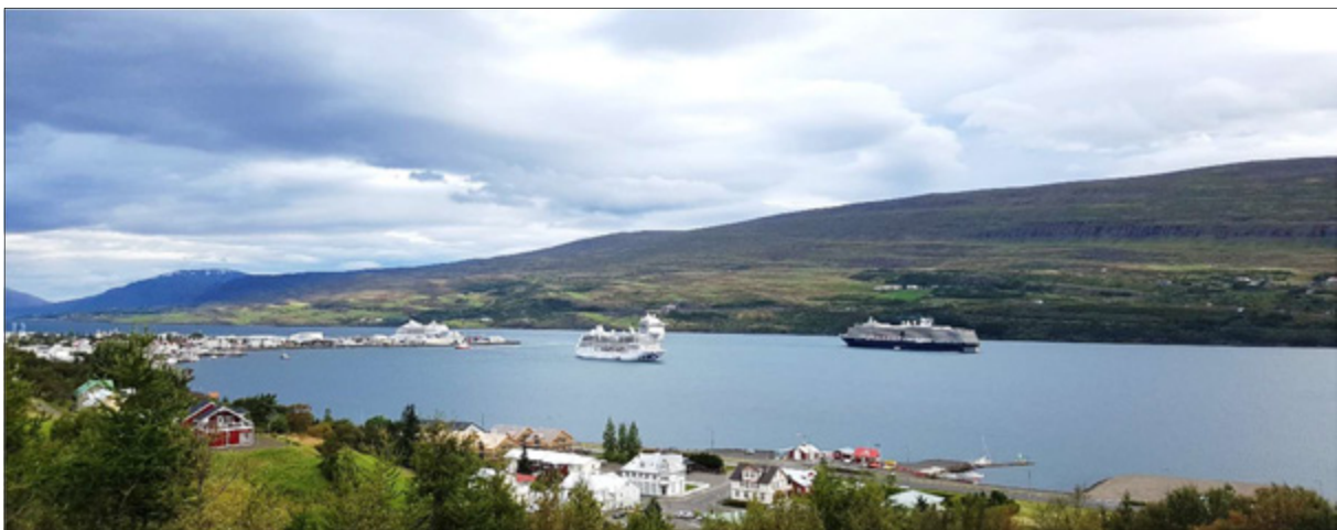
Í lok ágúst voru fjögur skemmtiferðaskip samtímis við Akureyri

Vera Vilhjálmstöttir stýrir verkefninu sem lýkur með skýrslu vorið 2019.