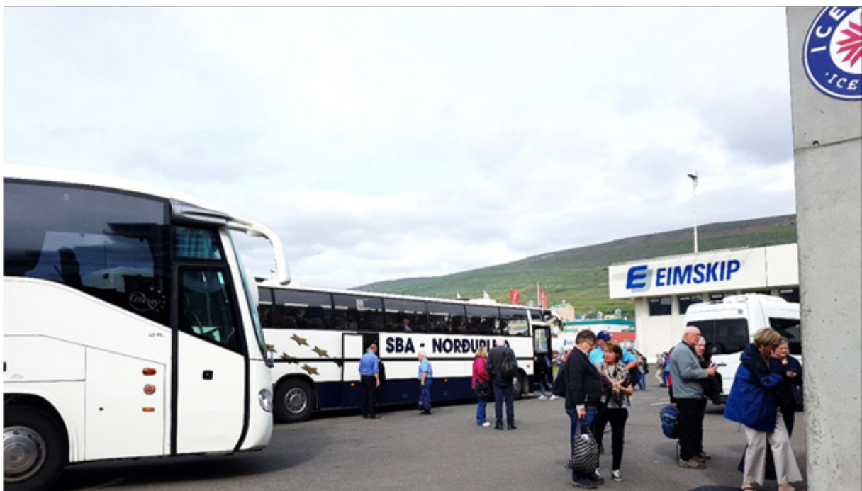
Hópur skemmtiskipafarþega á leið til skips á Akureyri

RMF er einn stofnaðila Norðurslóðanets Íslands - þjónustumiðstöðvar norðurslóðamála. Netið er samstarfsvettvangur stofnana, fyrirtækja og félagasamtaka á Íslandi sem vinna að málefnum norðurslóða.