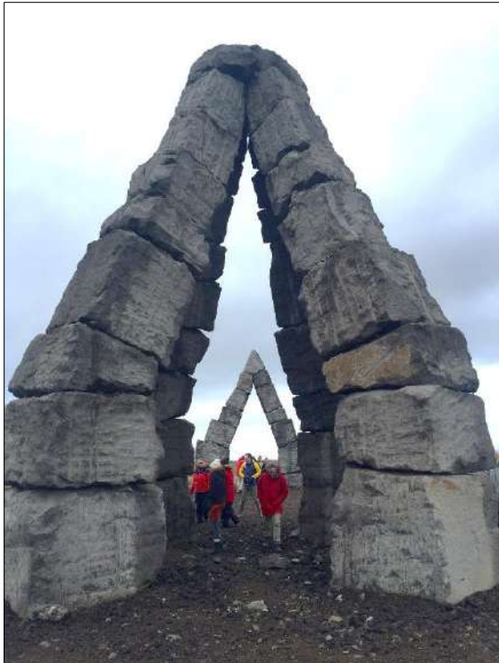
Heimskautsgerðið, Raufarhöfn

annarra stofnana. Fulltrúar úr íslenska stýrihópnum fóru á 8. MMV-ráðstefnuna í Novi Sad í Serbíu í september til að kynna umsóknina en varð hún á endanum að lúta í lægra haldi fyrir frönskum aðilum. Það voru mikil vonbrigði en þrátt fyrir það var þessi reynsla sem hlaut af umsóknarferlinu mikill og góður skóli fyrir RMF. Upp úr því stendur hæst sá góði og breiði samstarfsflötur sem varð til í kringum umsóknarvinnuna.