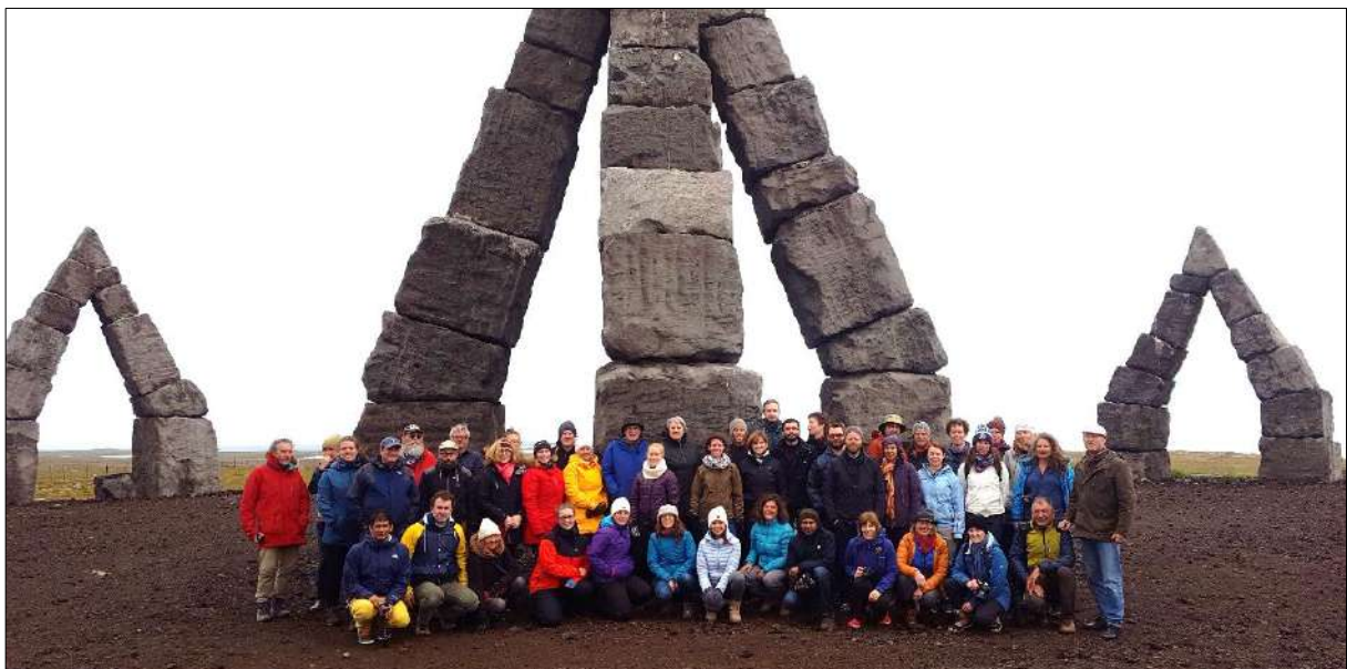
IPTRN-hópurinn á góðri stundu