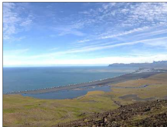
Víðsýnt yfir Héraðsflóann

líffræði, mannvistarlandfræði og ferðamálafræði. Hópurinn mun vinna umsókn að stærra verkefni á árinu 2017 sem miðar að því að fá fram nauðsynlegar upplýsingar til að undirbyggja ákvarðanatökur fyrir sjálfbæra og ábyrga ferðamennsku á norðurlóðum sem byggir á aðdráttarafli hafsins og lífríki þess.