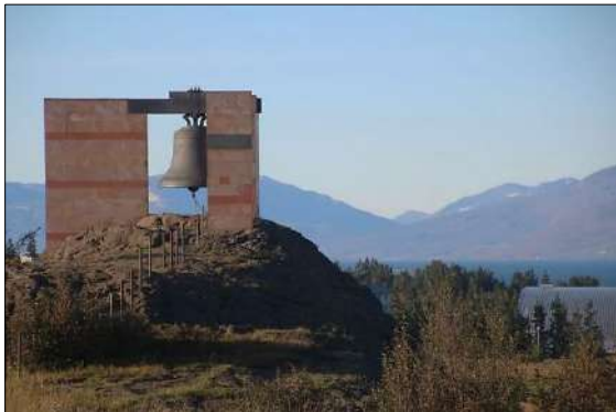
Íslandsklukkan við Háskólann á Akureyri