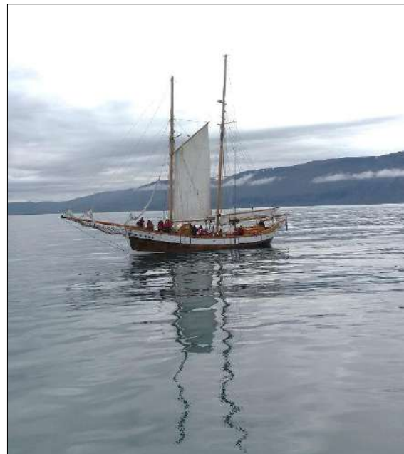
Hvalaskoðunarskip á Skjálfanda

RMF stóð að nokkrum viðburðum á árinu, stórum og smáum, sem lesa má nánar um hér síðar. Umfangsmestur þeirra var fimmta alþjóðlega ráðstefna Samtaka um ferðamálarannsóknir á heimskautasvæðum (IPTRN) sem var haldin í fyrsta sinn hér á landi um mánaðamótin ágúst/september. Ráðstefnan bar yfirskriftina Ferðapjónusta, fólk og vernduð svæði í víðáttu heimskautanna . Um það bil 50 manns frá 12 þjóðlöndum tók þátt í fjölbreyttri ráðstefnudagskrá sem stóð í fimm daga. Ráðstefnan hófst á Akureyri með málstofum og pallborðsumræðum um framgang og stöðu ferðamála á norðurlöndum. Ráðstefnugestir fóru síðan til Raufarhafnar þar sem unnið var með heimamönnum með þær áskoranir sem strjálbýl svæði á