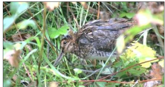
Hrossagaukur í Ásbyrgi