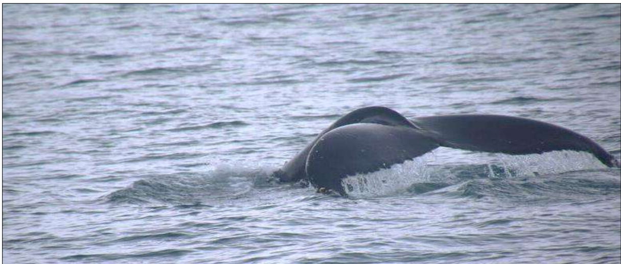
Hvalaskoðun á Skjálfanda