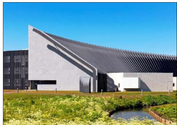
Háskóli Íslands, Askja

Stjórnarfundir á árinu voru fimm. Tveir vinnufundir stjórnar voru á fyrstu vikum ársins. Aðalfundur stjórnar var haldinn 3. mars á Akureyri. Vorfundur stjórnar var haldinn 7. júní í Reykjavík. Lokafundur ársins var haldinn á aðventunni þann 7. desember gegnum fjárfundarbúnað milli Reykjavíkur, Akureyrar og Hóla í Hjaltadal.