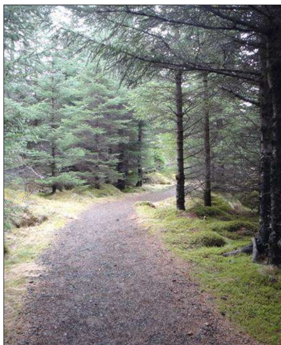
Frá Heiðmörk

Frumkvöðlaverkefni á sviði grunnrannsókna á hlutverki umhverfisins – og sér í lagi náttúrulegs umhverfis – í líðan fólks og heilsu. Rannsóknin er þverfagleg. Hún byggir annars vegar á rannsóknum í ferðamálafræði umhverfissálfræði og mannvistarlandfræði, og sem sýna fram á að hreyfing (að ganga, skokka) í náttúrulegu umhverfi hefur góð áhrif á líkamlega og andlega heilsu t.d. með streitulosun, en betri sannanir vantar fyrir slíkum endurnýjandi áhrifum náttúrunnar. Hins vegar byggir BREATH á þverfaglegum frumkvöðlarrannsóknum í frumulíffræði og sálfræði sem mæla öldrun/hrörnun mannslíkamans í gegnum lengd