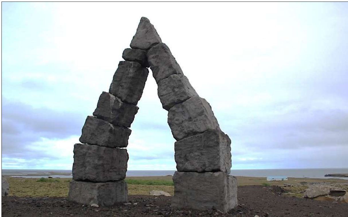
Við Heimskautsgerðið, Raufarhöfn

Ráðist var í forrannsókn (e. pilot study) á umfjöllun íslenskra fjölmiðla um ferðamennsku og ferðaþjónustu hérlendis. Til skoðunar var hvort og þá hvernig áhersla miðlanna hefði breyst samfara örum vexti ferðaþjónustunnar á síðustu árum. Valdar voru til greiningar fréttir hérlendra netmiðla dagana 15-21. janúar og 15-21 júlí árin 2010-2016. Unnið var út frá kenningum um annars vegar mikilvægi fjölmiðla í upplýsingu almennings og hins vegar mótunaráhrifum fjölmiðla í þjóðmála-umræðunni hverju sinni.