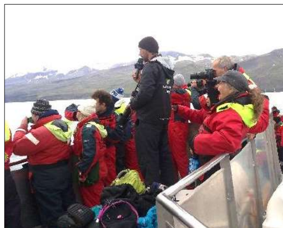
Hvalaskoðunarferð á Skjálfanda

Þórný Barðadóttir sinnir þessu verkefni.