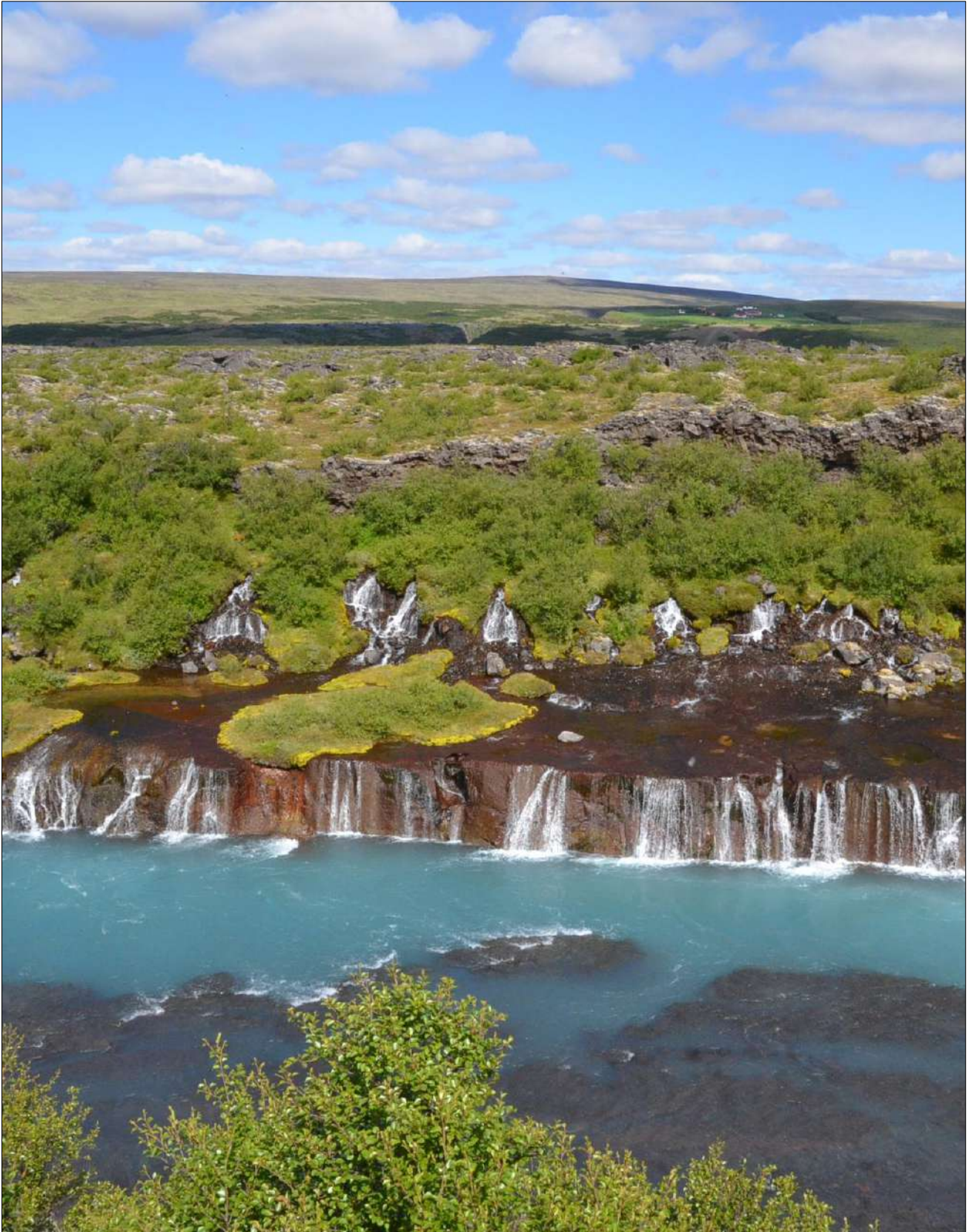
Hraunfossar í Borgarfirði