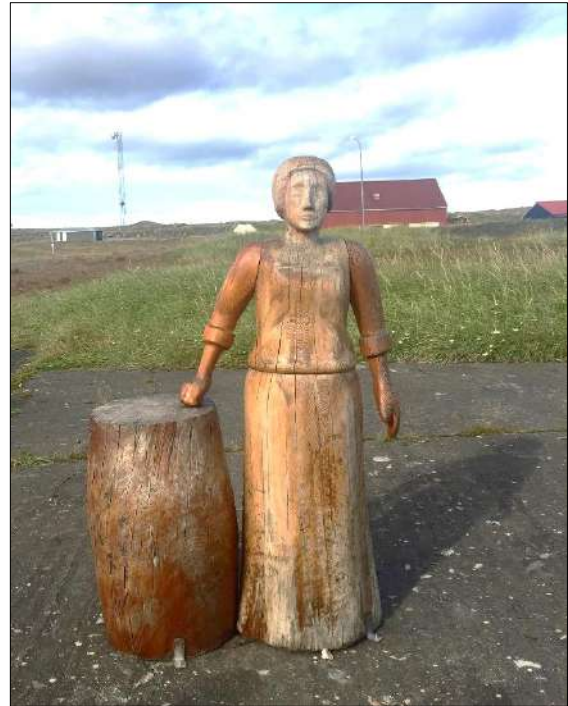
Síldarstúlkan starir út á hafið við Raufarhöfn