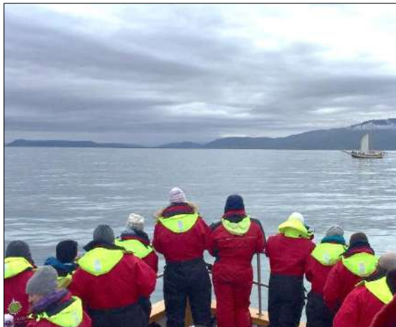
Hvalaskoðun á Skjálfanda

lögð á samtal við heimamenn. Hópurinn fór í vettvangsferðir um svæðið og tók þátt í sérstakri vinnustofu með heimamönnum þar sem unnið var með þær áskoranir sem strjálbýl svæði á norðurlóðum, líkt og Raufarhöfn, standa frammi fyrir við þróun ferðamennsku. Undirbúningur ráðstefnunnar var unninn í nánu samstarfi við heimamenn á Raufarhöfn; Norðurhjara – ferðaþjónustusamtök, Rannsóknastöðina Rif og verkefnið Raufarhöfn og framtíðin með stuðningi frá Sendiráði Kanada á Íslandi og Sveitarfélaginu Norðurþingi. Auk þess hlaut RMF styrk úr Verkefnasjóði Háskólans á Akureyri vegna ráðstefnunnar. IPTRN eru samtök helstu sérfræðinga heimsins á sviði ferðamálarannsóknna á heimskautasvæðum. Samtökin, sem voru stofnuð árið 2008, leggja mikla áherslu á þekkingarsköpun og á miðlun þekkingar og mismunandi sjónarmiða um þróun ferðamennsku á heimskautasvæðum.