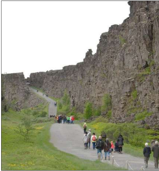
Frá Almannagjá