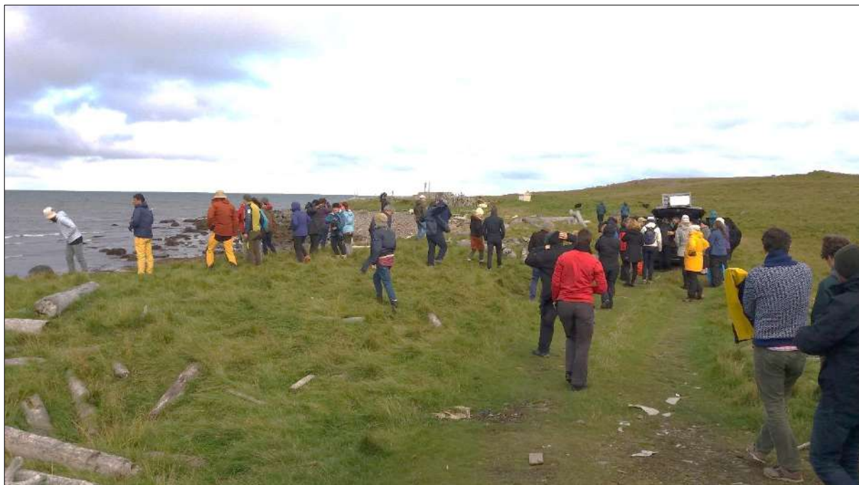
Ráðstefnugestir á IPTRN í vettvangsferð á Melrakkaslétu