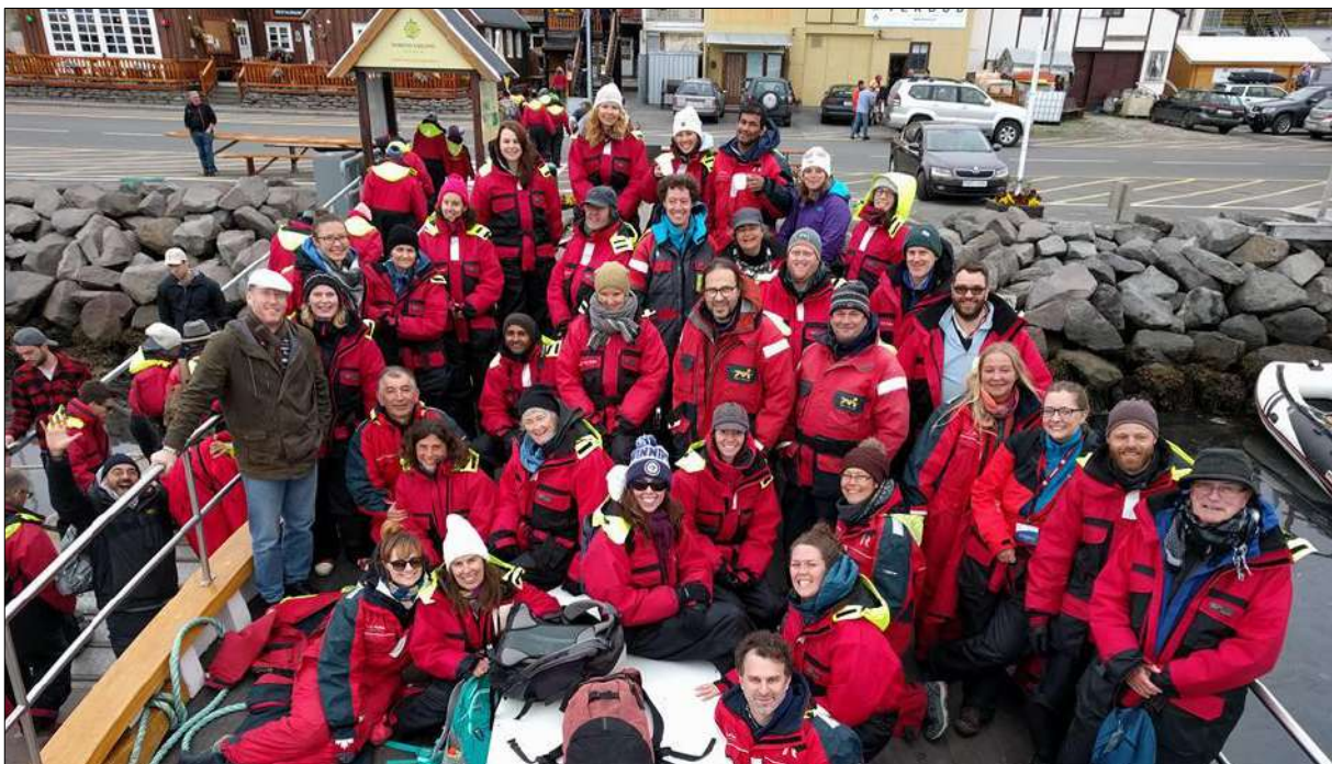
IPTRN-ráðstefnugestir að lokinni hvalaskoðunarferð á Húsavík

Auk þess voru á dagskrá opnar pallborðsumræður í Háskólanum á Akureyri um framgang og stöðu ferðamála á norðurslóðum með þátttöku ferðaþjónustuaðila í Eyjafirði. Á Raufarhöfn var rík áhersla