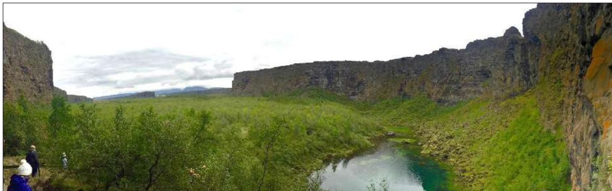
Frá Ásbyrgi

Rannsóknin tekur til fjögurra byggðakjarna: Húsavíkur, Mývatnssveitar, Siglufjarðar og Hafnar í Hornafirði. Rannsóknin byggir á verkefni sem unnið hefur verið í Þingeyjarsýslum frá árinu 2012. Það verkefni snýr að aðlögun alþjóðlegra aðferða við gerð ferðaþjónustureikninga að afmörkuðum svæðum landsins í þeim tilgangi að greina efnahagsleg áhrif ferðaþjónustu á svæðinu. Verkefnið var unnið fyrir Háskólann á Akureyri með fjárstuðningi frá atvinnu- og nýsköpunarráðuneyti. Verkefninu lauk í desember 2016.