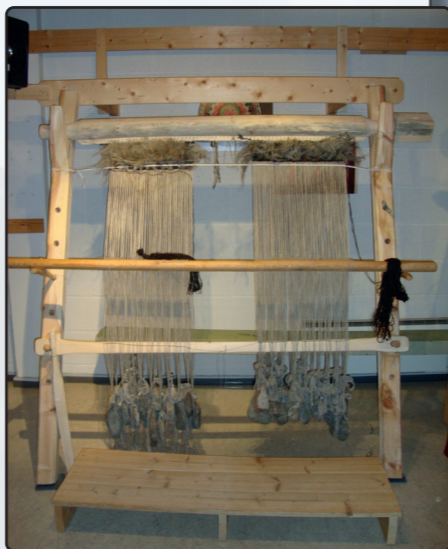
Kljástainavefstaður í Noregi þar sem verið er að vefa litla röggvarfeldi eða vararfeldi á námskeiði árið 2013.