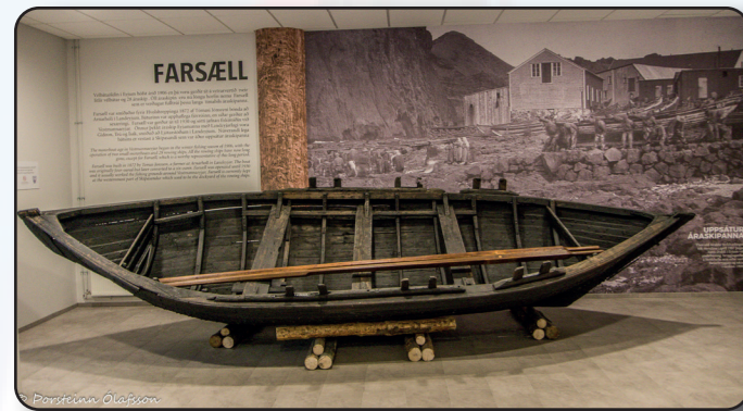
Áttæringurinn Farsæll með Landeyjalagi.