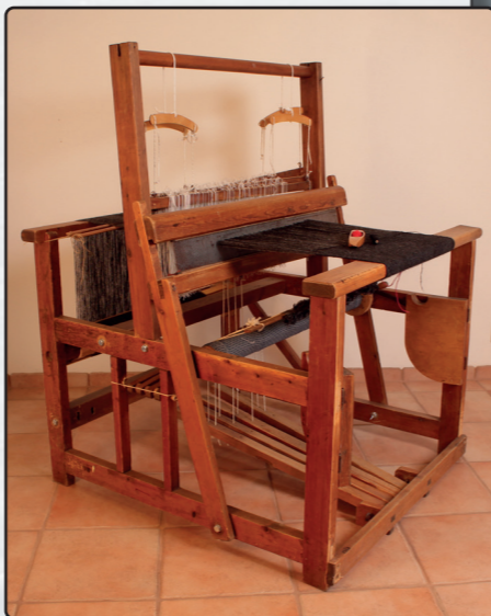
Íslenskur trissuvefstóll frá fyrri hluta 20. aldar.