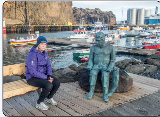
Ási í Bæ og höfundur greinarinnar