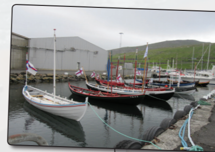
Færeyingar sýndu grindabátana sína

Margt bar fyrir augu og eyru á hátíðinni í Færeyjum.