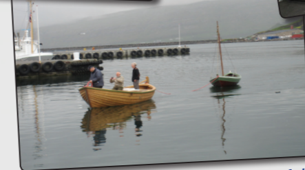
Reykhólabátarnir sigldu um höfnina