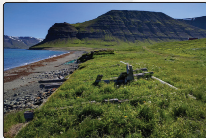
Sæból á Ingjaldssandi. Frá vettvangsferð Minjastofnunar í júlí 2016

Minjastofnun Íslands (áður Fornleifavernd ríkisins og Húsafriðunarnefnd ríkisins) hefur í fjölda ára reynt að vekja athygli á bágrri stöðu strand- og sjávarminja á Íslandi. Fornleifavernd Húsafriðunarnefnd og nokkrir starfsmenn voru stofnfélagar Íslenska vitafélaginu þegar það var stofnað árið 2003 og hafa starfsmenn stofnananna haldið þó nokkra fyrirlestra á ráðstefnum og kvöldfundum félagsins gegnum árin.