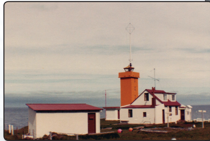
Galtarviti, íbúðarhús og viti

Laust fyrir 1990 hófst nýr kafla í vitatækninni þegar við byrjuðum að gera tilraunir með að nota sólarorku til að framleiða raforku fyrir vitaljós. Fyrsti búnaðurinn af þessu tagi var settur upp í Gerðistangavita sem er á Atlagerðistanga á Vatnsleysuströnd. Það er skemmst frá því að segja að sólarorkubúnaðurinn reyndist framar öllum vonum. Menn höfðu haft efasemdir um að hann kæmi að nógu góðum notum hér vegna þess hve skammdegið er langt en allar áhyggjur af því reyndust ástæðulausar.