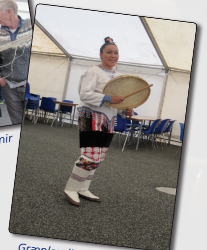
Grænlandingar sungu og sýndu dans