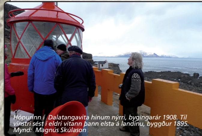
Hópurinn í Dalatanga víta hinum nýrri, byggingarár 1908. Til vinstri sést í eldri vitann þann elsta á landinu, byggður 1895.