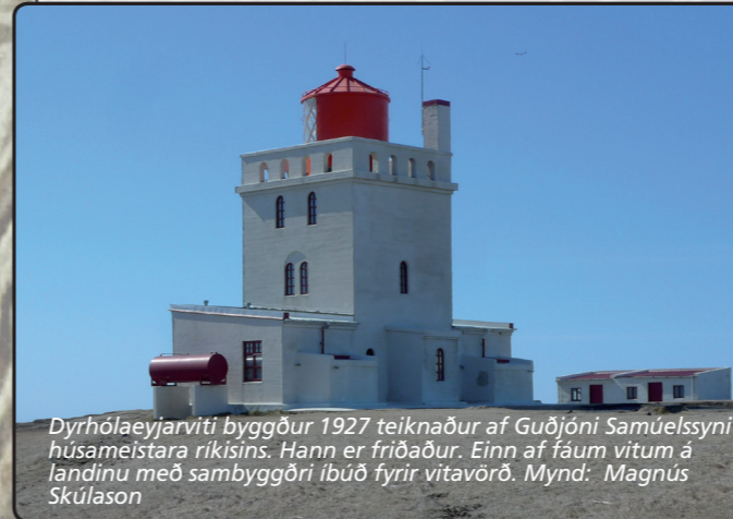
Dyrhólaeyjarviti byggður 1927 teiknaður af Guðjóni Samúelssyni húsaameistara ríkisins. Hann er friðaður. Einn af fáum vitum á landinu með sambyggðri íbúð fyrir vitavörð.