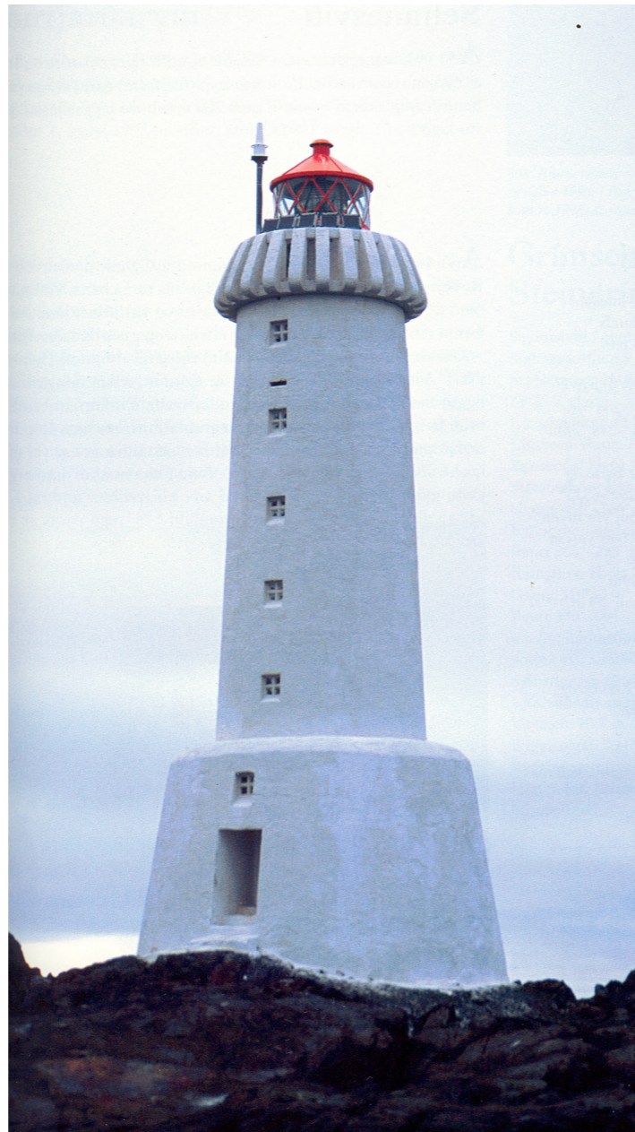
Selskersviti er talinn einn sterkbyggðasti viti landsins og stendur hátt og fallega í sínu umhverfi.