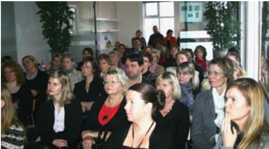
Gestir á UNIFEM-UMRÆÐUM í Miðstöð Sameinuðu þjóðanna. Fundirnir hafa verið sérlega vel sóttir.