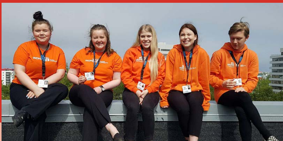
Götukynnar fjáröflunarteymis UN Women.

Ómetanlegur stuðningur almennings gerir UN Women á Íslandi mögulegt að veita konum og börnum þeirra um heim allan betra líf. Reglulegir styrkir frá rúmlega sjö þúsund styrktaraðilum auk fjölmargra smærri og stærri framlaga frá fyrirtækjum og stofnunum gerðu landsnefndinni unnt að senda hæsta fjárframlag allra landsnefnda til verkefna UN Women á árinu, þriðja árið í röð. Með slíkum stuðningi styrkti landsnefndin fjölbreytt verkefni til valdeflingar kvenna á árinu 2018.