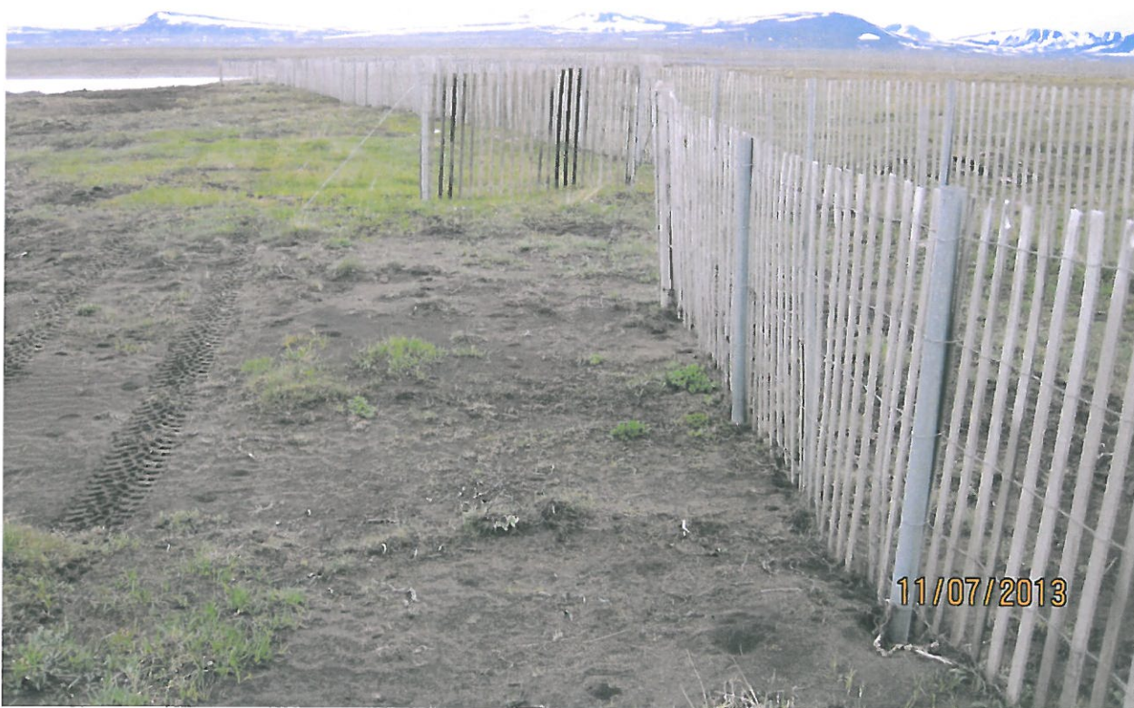
Mynd 4. Fokgirðing styrkt með rorum

Farið var með fokgirðingum beggja megin Kringilsár. Lítið sem ekkert þurfti að lagfæra girðingarnar í Kringilsárrananum en norðan Kringilsárinnar var töluvert viðhald. Þar hafði girðingin lagst á hliðina á kafla því staurarnir í henni höfðu ekki þolað álagið og bognað niður við jörð. Til að styrkja girðinguna voru tveggja tommu galvaniseruð vatnsrör rekin niður með tveggja metra millibili og fokgirðinganetin bundin við þau. Rörin voru höfð tveggja metra löng og það fóru fimmtíu og fjögur rör í girðingarnar.