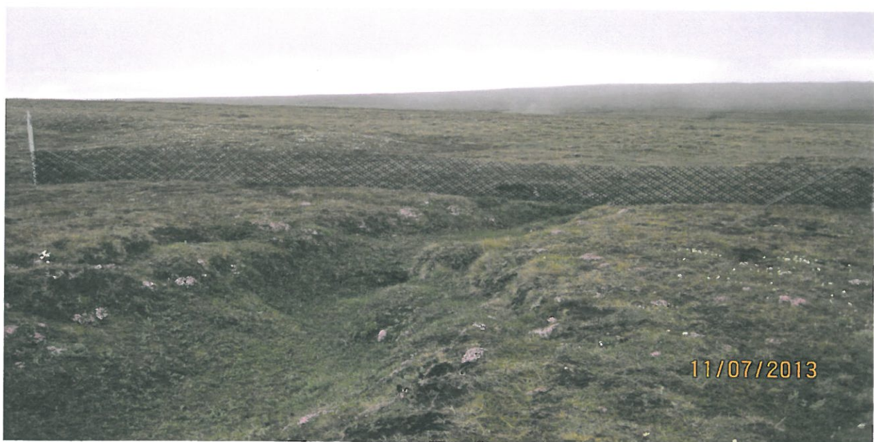
Mynd 3. Fokgirðing úr plastneti