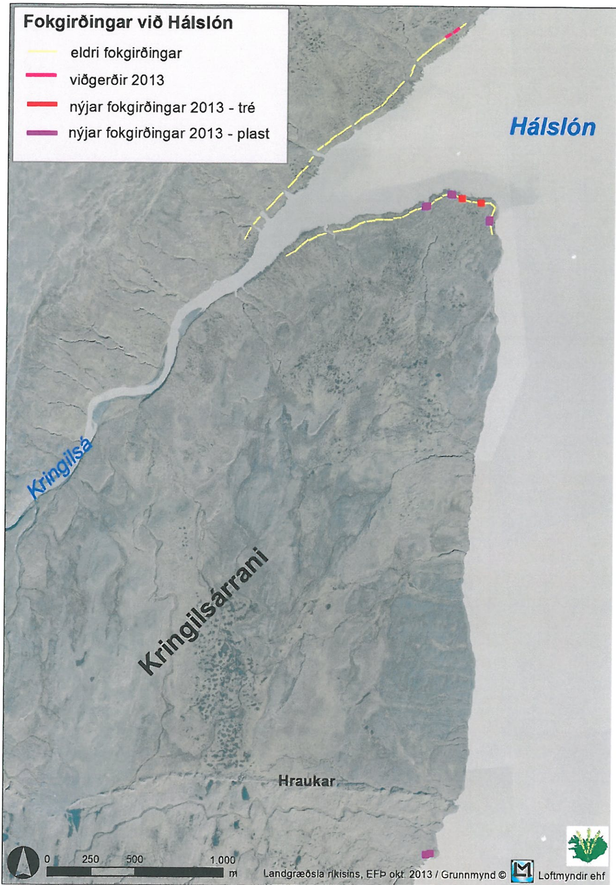
Kort 1. Fokgirðingar í Kringilsárrana og á bökkum Háslóns norðan Kringilsár