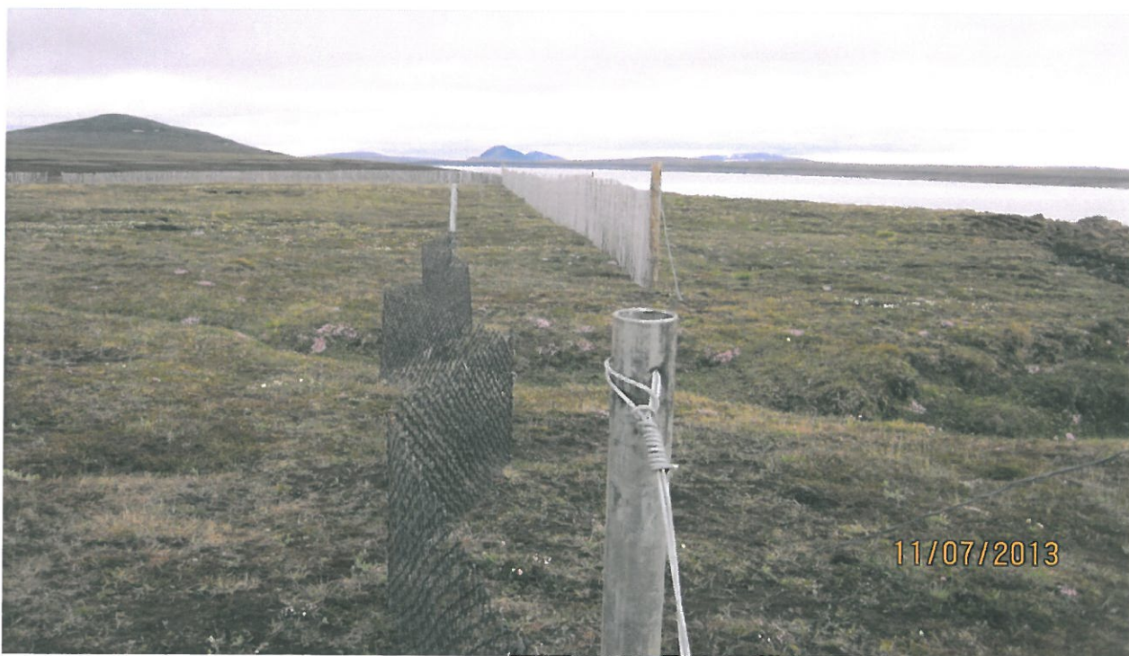
Mynd 2. Fokgirðing úr plastneti -

Netið er framleitt í 120 cm breiðum og 25 metra löngum rúllum. Hverri rúllu var skipt í tvennt og fengust með því móti tvær 60 cm breiðar rúllur. Notuð voru tveggja tommu galvaniseruð vatnsrör, þriggja metra löng, sem endastaurar. Endastaurarnir voru stagaðir með tvöföldum 4 mm galvaniseruðum stagvír og sem stagfesta var notaður 80 cm langur galvaniseraður girðingastaur. Í staura á milli endastaura var notað 16 mm kambstál, 110 cm langt. Kambstálsstaurarnir voru reknir 50 cm niður í jörðina og voru þeir settir sitt á hvað úr beinni línu á milli endastaura til að auka skjóláhrif girðingarinnar og til að strekkja á girðingunni.