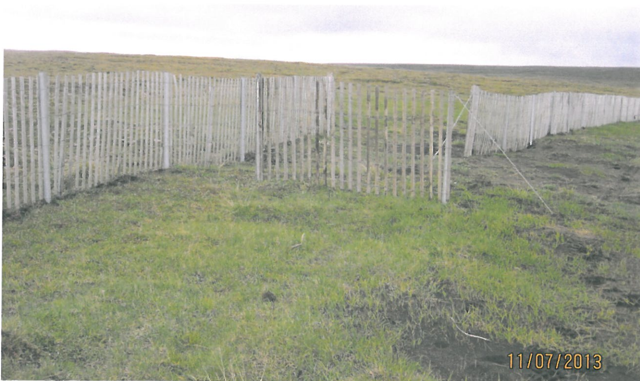
Mynd 6. Trérimlagirðing í skarði á milli eldri fokgirðinga