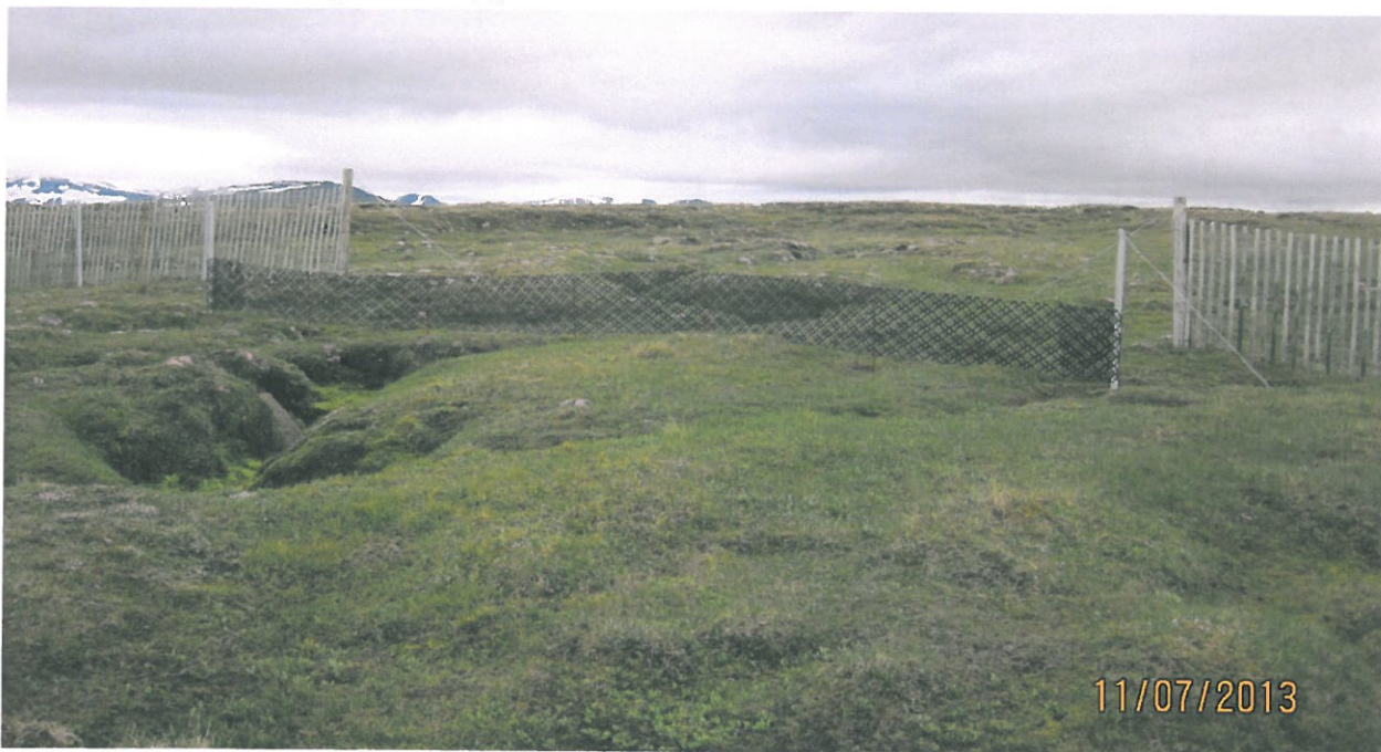
Mynd 5. Plastgirðing í skarði á milli eldri fokgirðinga

Settar voru upp fjórar lágar fokgirðingar úr plasti og tvær stuttar trérimlagirðingar í Kringilsárrana. Ein þessara lágu fokgirðinga var sett upp sunnan Hrauka þar sem sandur var farinn að berast úr lónstæði Háslóns inn á landið en hinar voru settar í skörð á milli eldri fokgirðinga nyrst í Kringilsárrana, sjá kort 1.