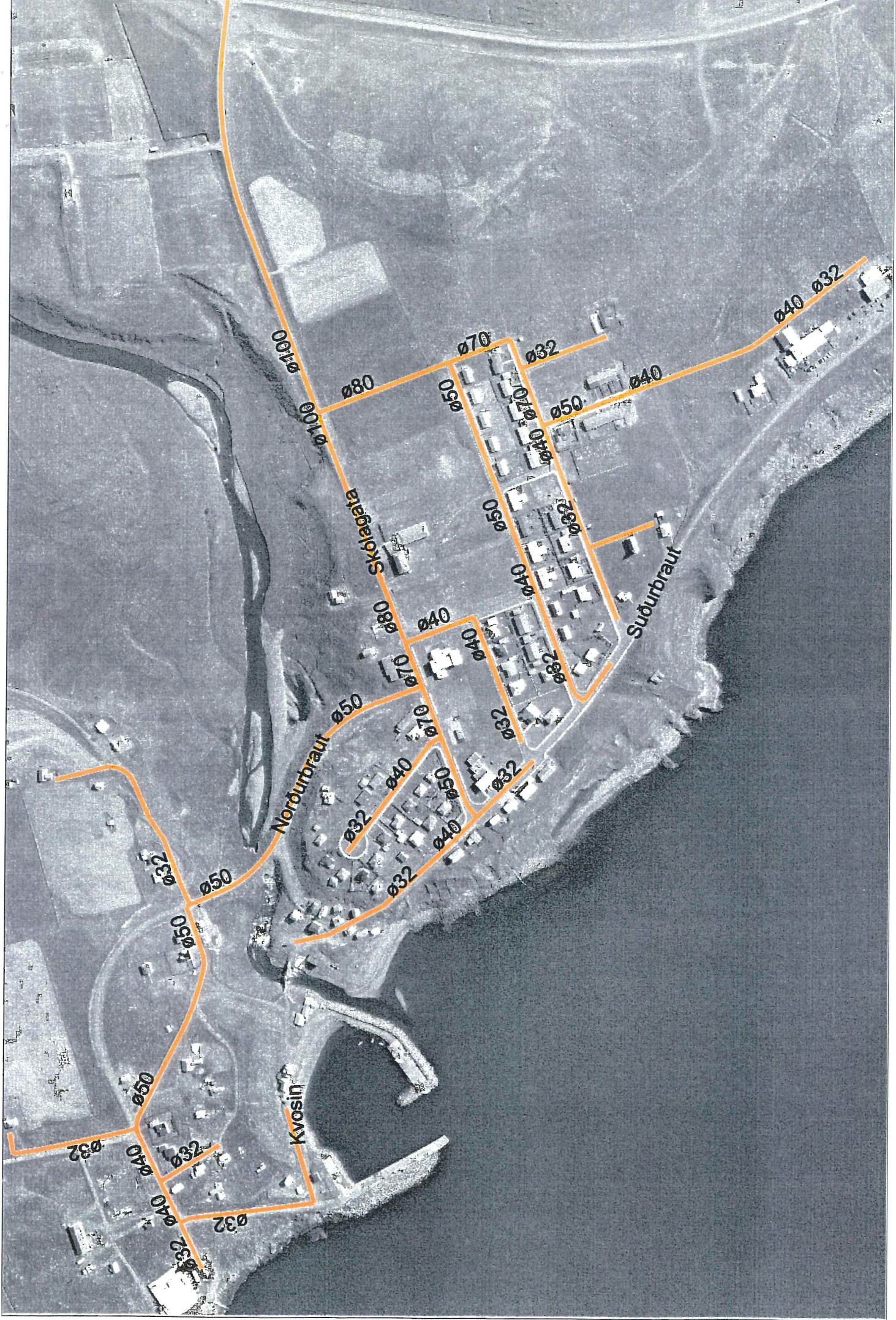
Mynd 1. Hofsvós, dreifikerfi