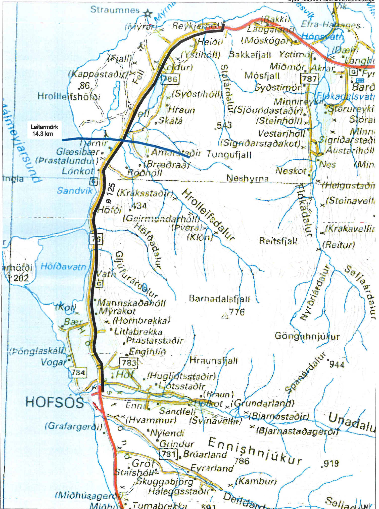
Mynd 3. Hofsós, hitaveita frá Reykjarhóli.