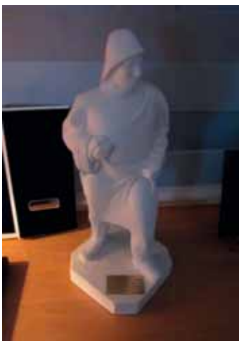
Gjöf frá Akranesi