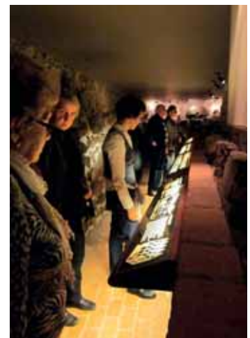
Fornleifar á Bessastöðum