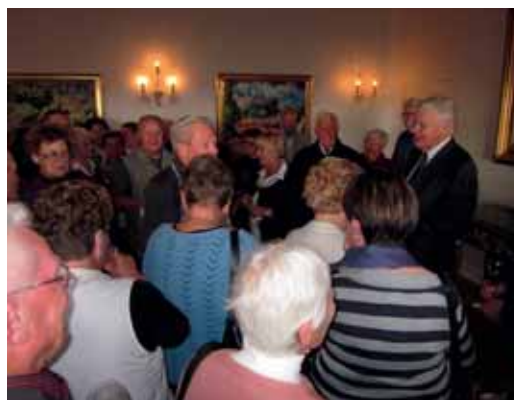
Hr. Ólafur Ragnar Grímsson ávarpar hópinn