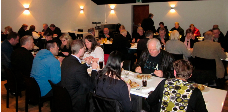
Að loknum aðalfundi Verkalýðsfélags Akraness var boðið upp á veitingar að hætti hússins.

hætti því fjárhagslega sterkt félag er engum háð og betur í stakk búið til að styðja við félagsmenn og berjast fyrir réttindum þeirra.