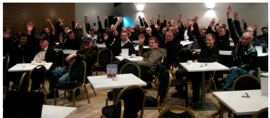
Starfsmenn ELKEM og Klafa á samstöðufundi í febrúar 2011.

Á fundinum var lögð fram tillaga frá fundarmanni þar sem lýst var yfir fullum stuðningi við forystu Verkalýðsfélags Akraness. Var tillagan samþykkt með dynjandi lófataki fundarmanna.