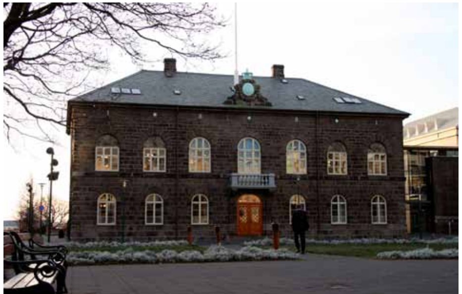
Alþingishúsið við Austurvöll.