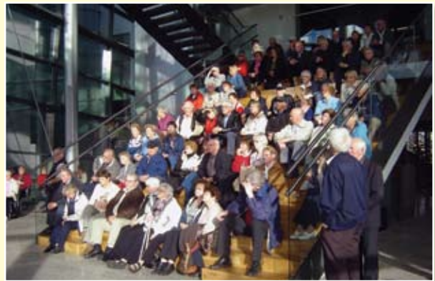
Þátttakendur í ferðinni hlýða á kynningu í Hellisheiðarvirkjun.