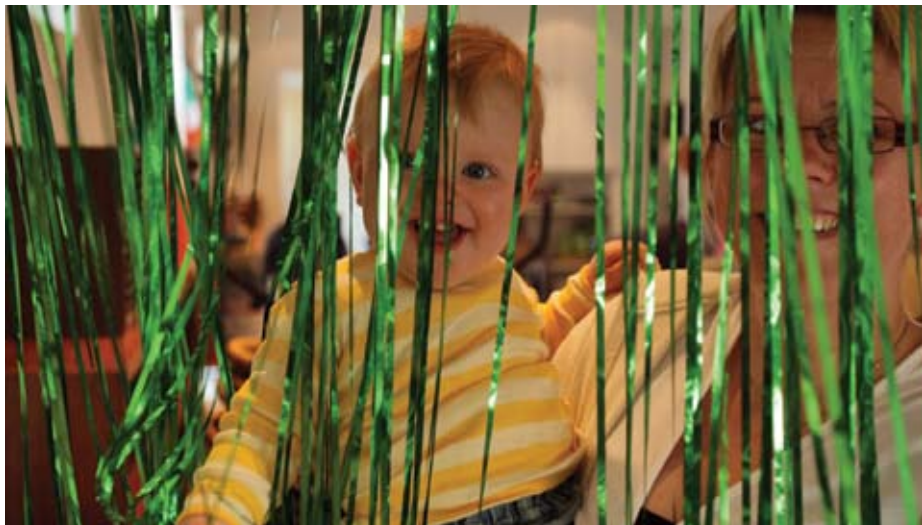
Umönnunarstörf verða aldrei ofmetin.