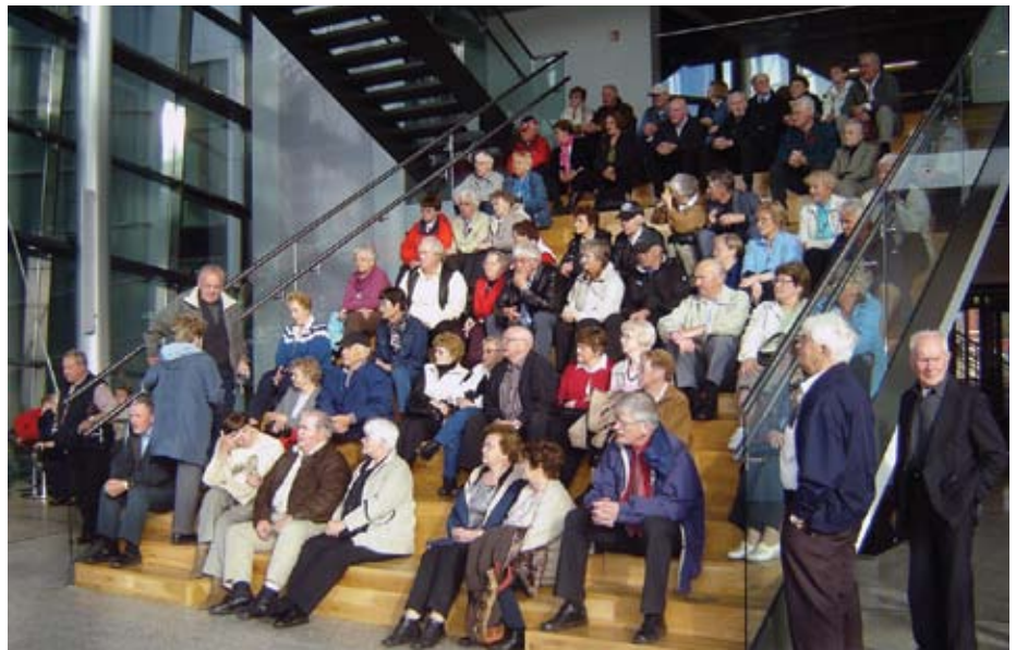
Úr ferð Verkalýðsfélags Akraness með eldri borgurum í ágúst sl.

Samkvæmt kröfugerðinni er gert ráð fyrir að samið verði til tveggja ára með skýrum forsenduákvæðum, þannig að mögulegt verði að segja upp launaliðum samningsins eftir eitt ár.