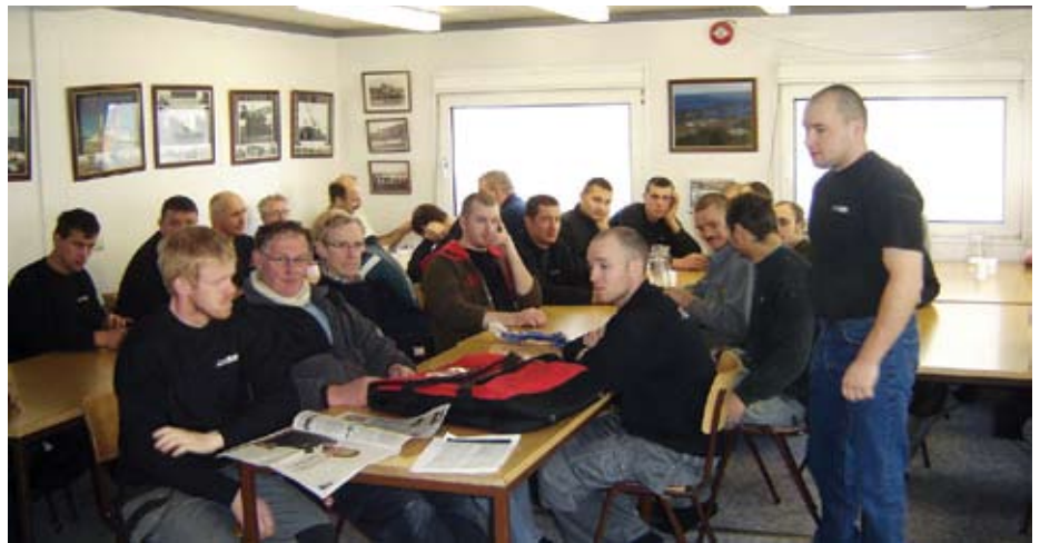
Hluti starfsmanna Smellinn á fundinum í lok október.