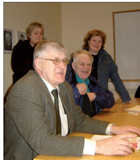
Frá fundi í stjórn félagsins. Stjórnarmenn eru að vonum ánægðir með góðan árangur í rekstri félagsins.

Rétt er að minna á að þegar ný stjórn tók við árið 2003 var félagssjóður rekinn á tveggja og hálfra milljóna króna yfirdrætti og með tapi upp á 1,7 milljónir. Og það er ekki bara í stórbættari afkomu félagsins sem hefur orðið algjör viðsnúningur því félagslegi þátturinn hefur styrkst verulega eins og