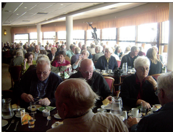
Úr ferð eldri borgara á síðasta sumri.

Sjúkrasjóður Verkalýðsfélags Akraness greiddi tæpar 20 milljónir í styrki og bætur á síðasta ári til félagsmanna. Greiðslur úr sjóði félagsins hafa aukist um 8% á milli ára og er það fyrst og fremst vegna þess að fleiri styrkir eru nú í boði til handa félagsmönnum en mörg undanfarin ár. Önnur ástæða aukningar er að töliverð breyting varð á greiðslu sjúkradagpeninga til félagsmanna eftir að greiðsluskyldu atvinnurekanda lýkur. Sjúkradagpeningar félagsmanna eru nú 80% af launum en þó að hámarki 250.000 og miðast þeir við laun síðustu sex mánaða fyrir veikindi. Á næsta aðalfundi verður lögð fyrir breyting á reglugerð sjúkrasjóðsins sem