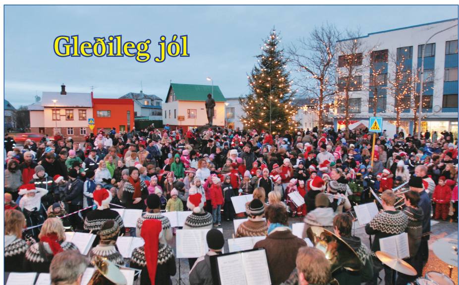
Kveikt á jólatrénu á Akragarði þann 2. desember s.l.

Að undanfögnu hafa margir orðið til að taka undir hve mikilvægt er að hækka lágmarkstaxta upp að markaðslaunum. Þar á meðal eru Magnús Þór Hafsteinson þingmaður Frjálslynda flokksins