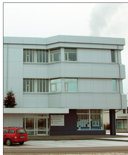
Skrifstofur sjóðsins á Akranesi eru að Kirkjubraut 40.

Hluti af starfsemi Festu - lífeyrissjóðs eru lánveitingar til sjóðfélaga. Lánareglur sjóðsins eru kynntar á heimasíðu sjóðs- ins www.festa.is og einnig er þar hægt að reikna út kostnað og afborganir lána.