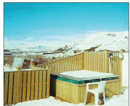
Heiti potturinn við bústaðinn í Ölfusborgum.

Tekið er við pöntunum á skrifstofu félagsins í alla bústaðina nema í Ölfusborgir. Gert er ráð fyrir að leigutakar gangi frá leigusamningi og greiði leigugjaldið