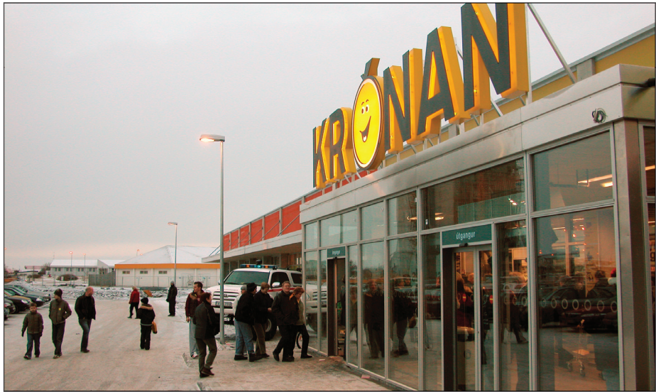
Sunnudaginn 17. desember var opnuð ný verslun Krónunnar á Miðbæjarreitnum. Eins og í öðrum verslunum á Akranesi var tekið vel á móti starfsmanni félagsins sem fylgist með vöruverði verslana.

Starfsmaður á vegum Verkalýðsfélags Akraness hefur þegar farið í allar verslanir á Akranesi í þessum tilgangi og var vel tekið á öllum stöðum. Þegar