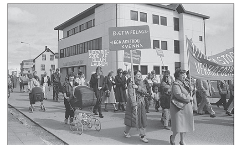
Þau réttindi sem verkamenn búa við í dag náðust með langri baráttu - Stöndum vörð um réttindi okkar. Kröfuganga 1. maí á 9. áratugnum.