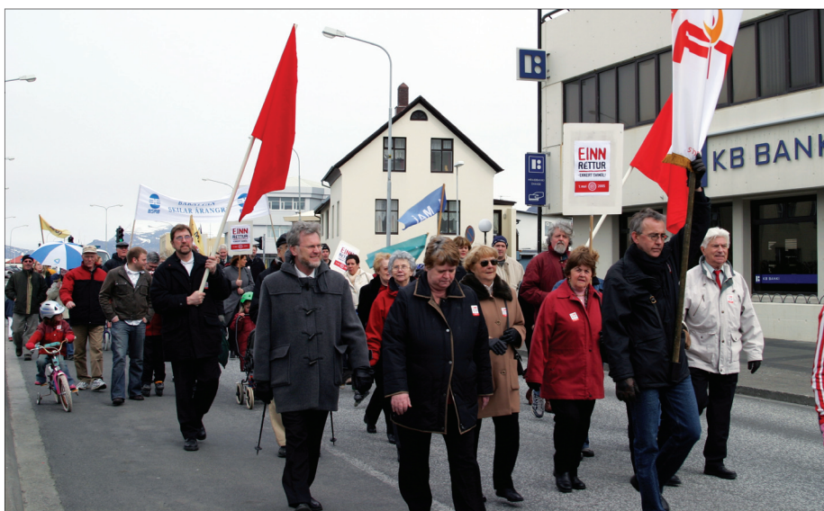
Frá kröfugöngu 1. maí í fyrra.

Forsenda þess að fá atvinnuleyfi í dag fyrir erlent vinnuafli er að ekki séu Íslendingar til í þau störf sem óskað er eftir að manna með erlendu vinnuafli.