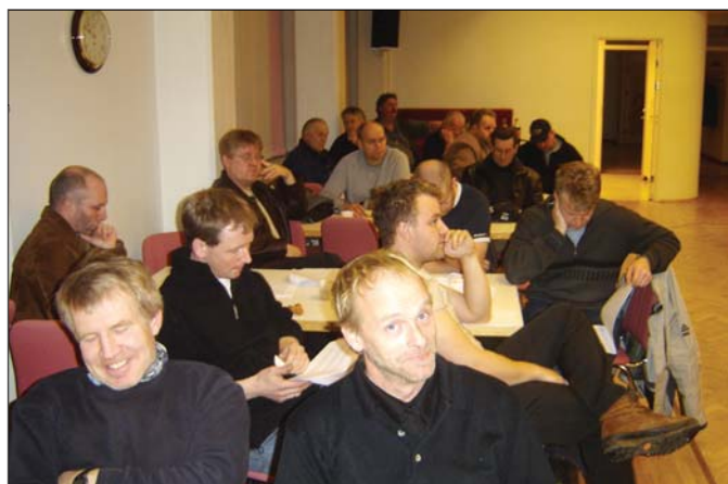
Ágæt mæting var á fundinn um öryggismál í stóriðju og gerður góður rómur að erindum fyrirlesaranna.