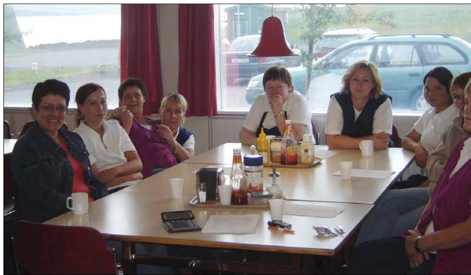
Starfsmenn Fangs ánægðir með nýjan fyrirtækjasamning!

Verkalýðsfélag Akraness vill þakka trúnaðarmönnum Fangs og Klafa sem og öllum starfsmönnum fyrir aðstoðina við gerð þessa samninga.