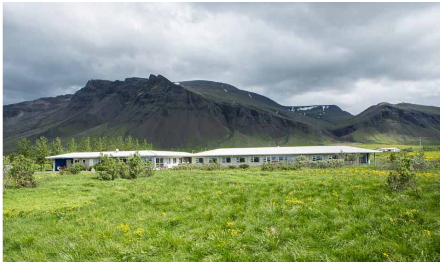
Vík á Kjalarnesi. SÁÁ á talsvert land við meðferðarstöðina Vík og liggur fyrir deiliskipulagstillaga að allt að 36 íbúða búsetu- og meðferðarúrræði fyrir endurkomusjúklinga sem þurfa meiri þjónustu en hægt er að veita með núverandi meðferð.