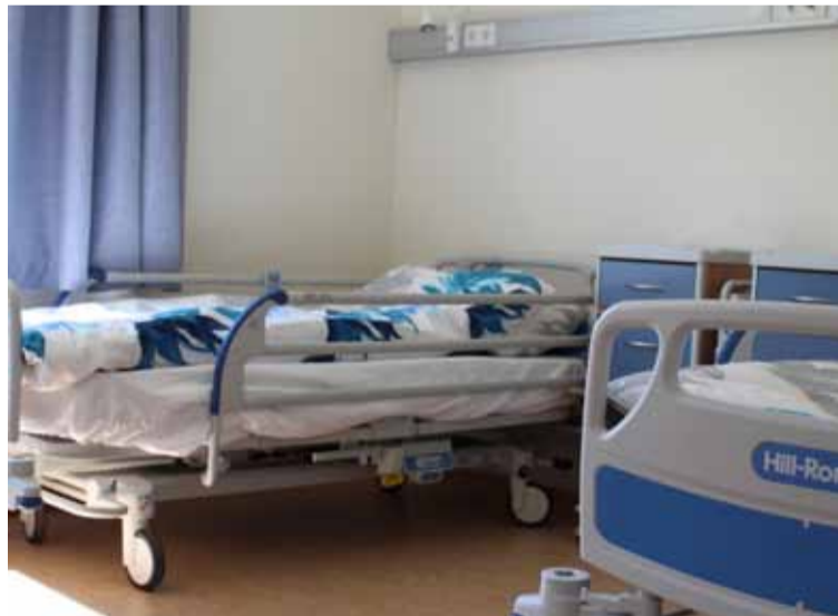
Nýju sjúkrastofurnar eru búnar fullkomnum sjúkrarúmum sem Styrktarsjóður SÁÁ gaf.

„Frá því SÁÁ voru stofnuð hafa samtökin byggt og keypt húsnæði undir starfsemi sína. Alla tíð hefur þetta að langmestu leyti verið gert fyrir sjálfsaflafé og án nokkurrar aðkomu frá opinberum aðilum. Þetta hefur okkur tekist með mikilli vinnu þeirra mörgu sjálfboðaliða, sem vinna óeingingjarnt starf í þágu SÁÁ.“