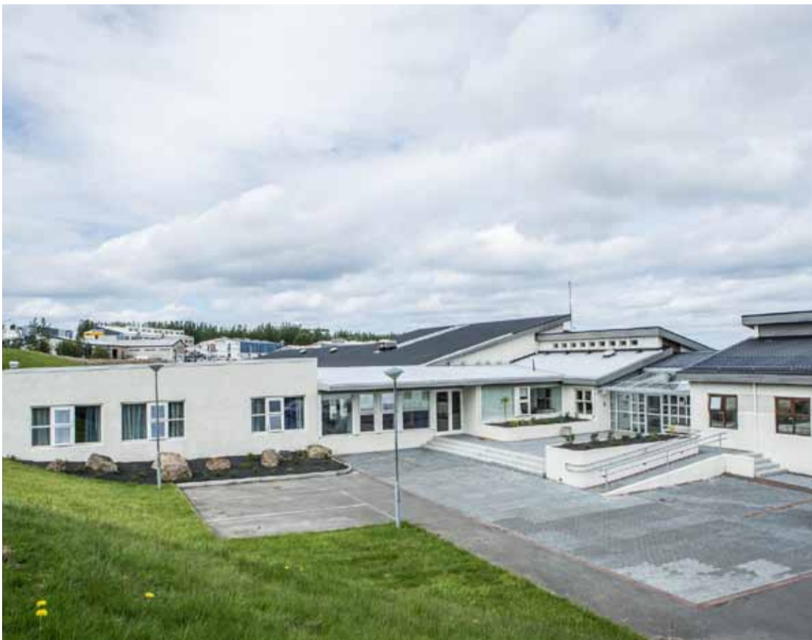
Svona lítur Vogur út eftir að nýja viðbyggingin, lengst til vinstri á myndinni, hefur verið tekin í notkun.