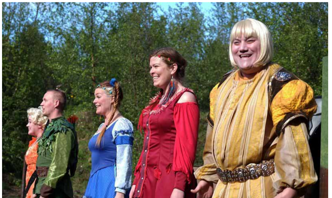
Hrói Höttur er aðalpersónan í leikriti Leikhópsins Lottu en Þyrnirós kemur líka við sögu.

Sýningin stendur í um það bil klukkutíma en Lotta mælir með því að foreldrar taki myndavélina með því eftir sýningu geta börnin fengið að kynnast persónunum, skoða munina sem notaðir eru í sýningunni og láta taka af sér myndir með uppáhaldsvini sínum úr Ævintýraskóginum hans Hróa Hattar.