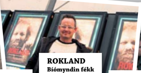
ROKLAND Bíómyndin fékk góðar viðtökur.