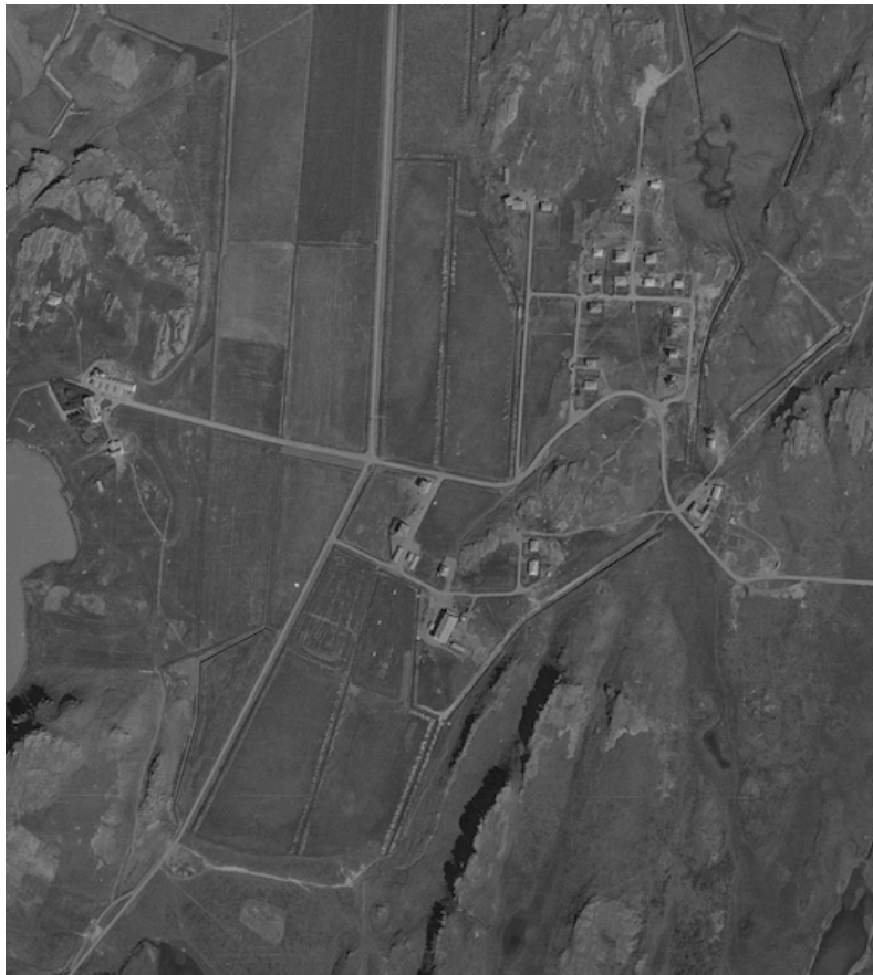
Mynd 2. Deiliskipulagssvæðið á loftmynd frá árinu 1955. Á myndinni má sjá Egilsstaðabýlið til vinstri á myndinni, krossgötur á miðri mynd og ræktuð tún þar sem miðbæjarsvæði Egilsstaða er nú.

Deiliskipulagssvæðið í miðbæ Egilsstaða er 16,6 ha. Það er austan við veg nr. 95 og hringveginn (nr. 1) sem liggur annars vegar inn á Velli og hins vegar út í Fellabæ. Svæðið nær yfir hluta Fagradagsbrautar, Miðvangs, Kaupvangs, Grenivangs, Sólvangs og Skjólvangs. Á svæðinu eru nú fjölbýlishús, hótél, verslanir og þjónustufyrirtæki, skrifstofur, tjaldsvæði og menningarhús.