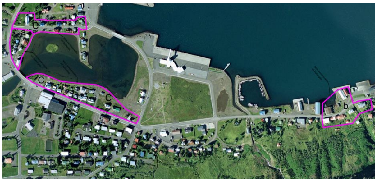
MYND 2. Mörk fyrirhugaðara verndarsvæða samkvæmt umsókn 2016

Í ágúst 2016 tók Seyðisfjarðarkaupstaður þá ákvörðun að sækja um styrk til að vinna tillögu að verndaráætlun í byggð fyrir hluta hverfisverndaða svæðisins H1 í gildandi Aðalskipulagi Seyðisfjarðarkaupstaðar 2010 – 2030, n.t.t. svæði við Norðurgötu og Bjólfsgötu. Jafnframt var gert ráð fyrir að taka til skoðunar svæði við Austurveg og hluta safnasvæðisins við Hafnargötu eins og sjá má á mynd 2. Minjastofnun Íslands veitti Seyðisfjarðarkaupstað á haustmánuðum 2016 styrk til að vinna verkefnið. Á fundi bæjarstjórnar Seyðisfjarðarkaupstaðar þann 14. desember 2016 var samningur um vinnslu verkefnisins við Minjastofnun samþykktur. Í kjölfarið óskaði Seyðisfjarðarkaupstaður eftir að byggingarfulltrúi, Sigurður Jónsson hjá EFLU verkfræðistofu verkstýrði verkefninu fyrir hönd bæjarins.