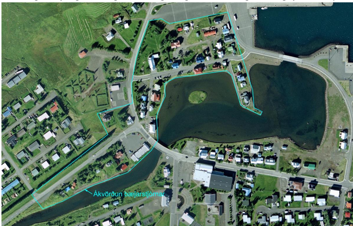
MYND 1. Afmörkun verndarsvæðis í byggð samkvæmt ákvörðun bæjarstjórnar Seyðisfjarðarkaupstaðar.

Hér er sett fram verkefnislýsing vegna vinnu á tillögu að verndaráætlun í byggð fyrir hluta hverfisverndaða svæðisins H1 í gildandi Aðalskipulagi Seyðisfjarðarkaupstaðar 2010 – 2030, n.t.t. svæði við Oddagötu, Bjólfsgötu, Öldugötu, Norðurgötu og hluta Vesturvegar eins og sjá má á mynd 1.