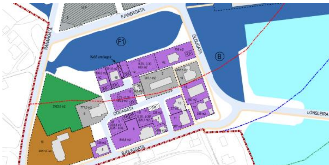
MYND 4. Úrklippa úr deiliskipulagsupprætti fyrir Hafnarsvæði, Fjarðarhöfn, Pálshúsréit og Öldu.

Á kortum eru dregnar jafnáhættulínur hættumats vegna ofanflóða en eftir er að endurskoða þær með tilliti til varnarmöguleika sem hafa verið byggð á brún í Bjólfi. Nýtingarmöguleikar svæðisins koma til með