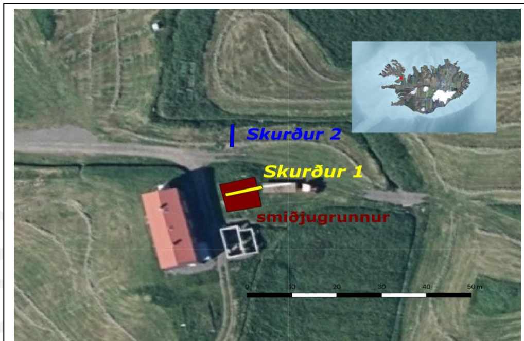
Mynd 1: Staðsetning könnunarskurða. Skurð 1 má sjá hægra megin við skólahúsið en skurðurinn var tekinn í gegnum smiðjugrunninn. Skurður 2 er staðsettur fyrir norðan skurð 1.