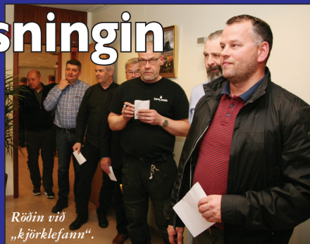
Röðin við „kjörklefann“.