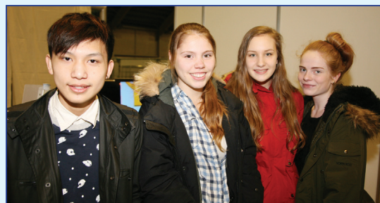
Unga fólkíð var ábugasamt og mætti vel í Kórinna 2014.

Húsið er allt bíð glæsilegasta. Vel fer um fimm til sex manns þar í gistingu. Allur aðbúnaður í húsinu er til fyrirmyndar utandyra sem innan.