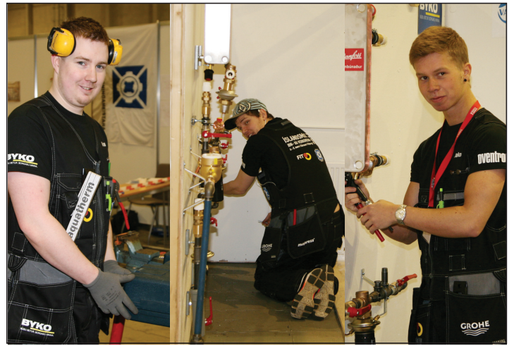
Myndirnar að ofan eru frá keppni pípulagninganema á Íslandsmótinu sem haldið var í Kórnum 2014.

Ísland mun senda sjö fulltrúa í keppnina í ár úr sjö iðngreinum og búast má við mikilli vinnu framundan. Það er gaman að segja frá því að fulltrúi okkar í pípulögnum er ekki að fara í „skemmtiferð“ heldur er hann að fara að keppa og er óhætt að segja að hann búi yfir miklu keppnisskapi