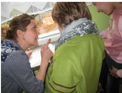
Eftir tímann komu áhugasamir nemendur og fengu eiginhandarítun