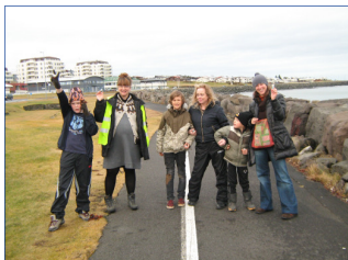
Stimplararnir eru alltaf mjög mikilvægir