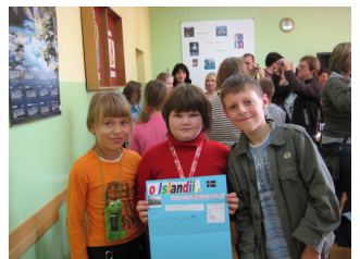
Krakkar í Szkoła Podstawowa í Pulawy, Póllandi sem voru að vinna verkefni um Ísland