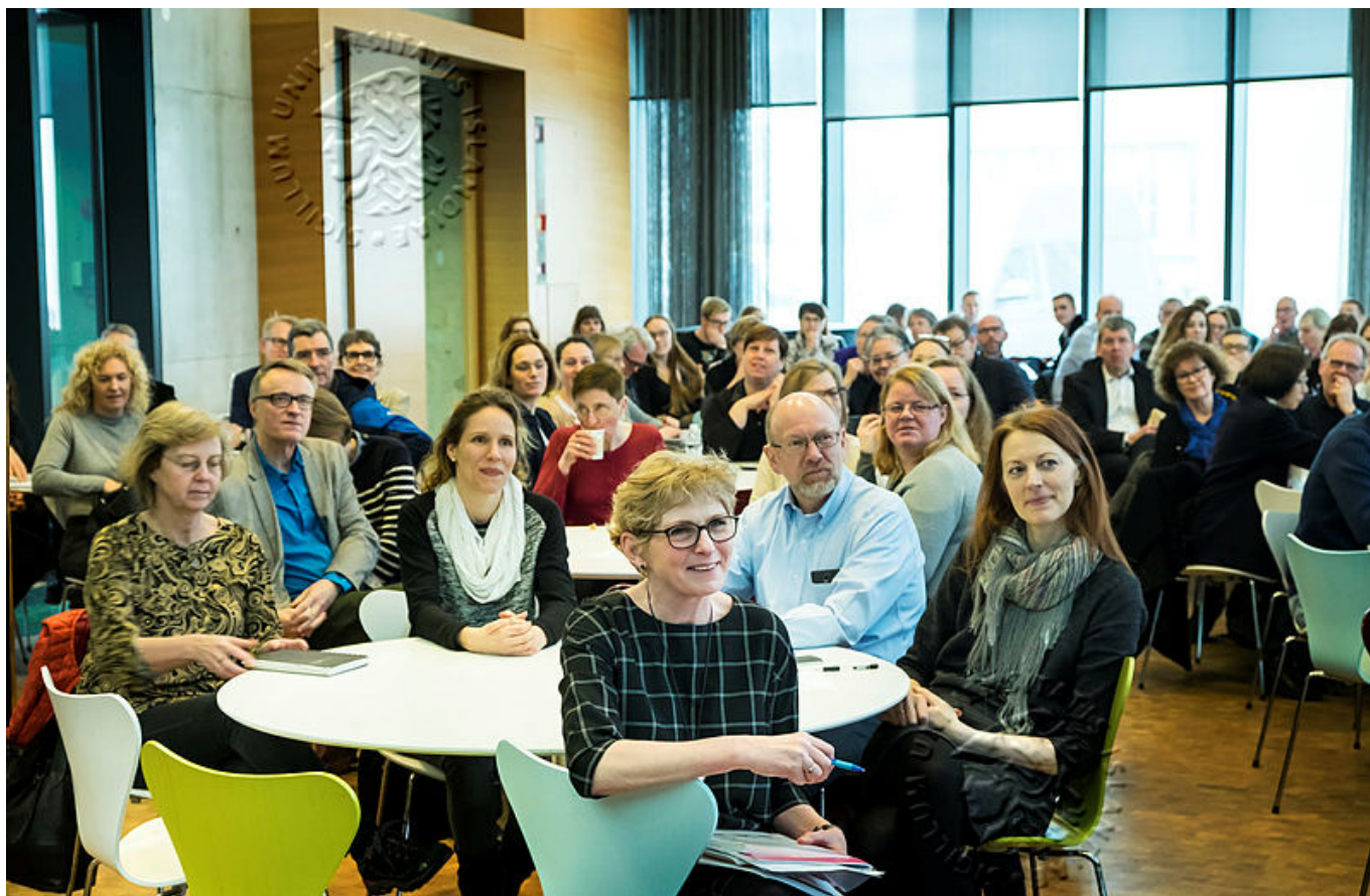
MYND 3. KENNSLUMÁLAPING Í HÁSKÓLA ÍSLANDS. GREINARHÖFUNDUR FREMST.