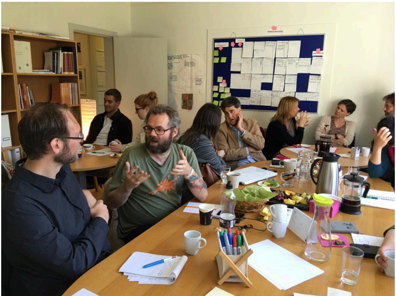
MYND 1. NÁMSKEIÐ Í HÁSKÓLAKENNSLUFRAEÐI

Aðstæður eru þessum nýja kennara erfiðar. Kennslan er tímafrekt verkefni og eflaust erfitt að finna rannsóknarvinnu stað og stund. Glíman við nemendur reynir á, það er flókið að sinna kennslufræðilegum verkefnum eins og námsmati og í deildinni virðist vera lítill vettvangur fyrir umræðu eða stuðning við nýliðann. Vonandi er þessi reynsla ekki dæmigerð fyrir nýja kennara við Háskóla Íslands og flestir þeirra ná að komast yfir fyrsta hjallann og ná betri tókum á kennslunni.