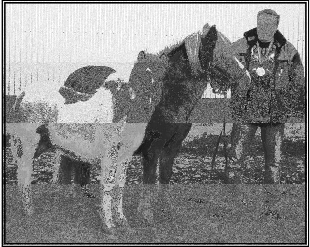
Sigurvegari 2006. Blær frá Reykhól með eig. Unnari Steini.