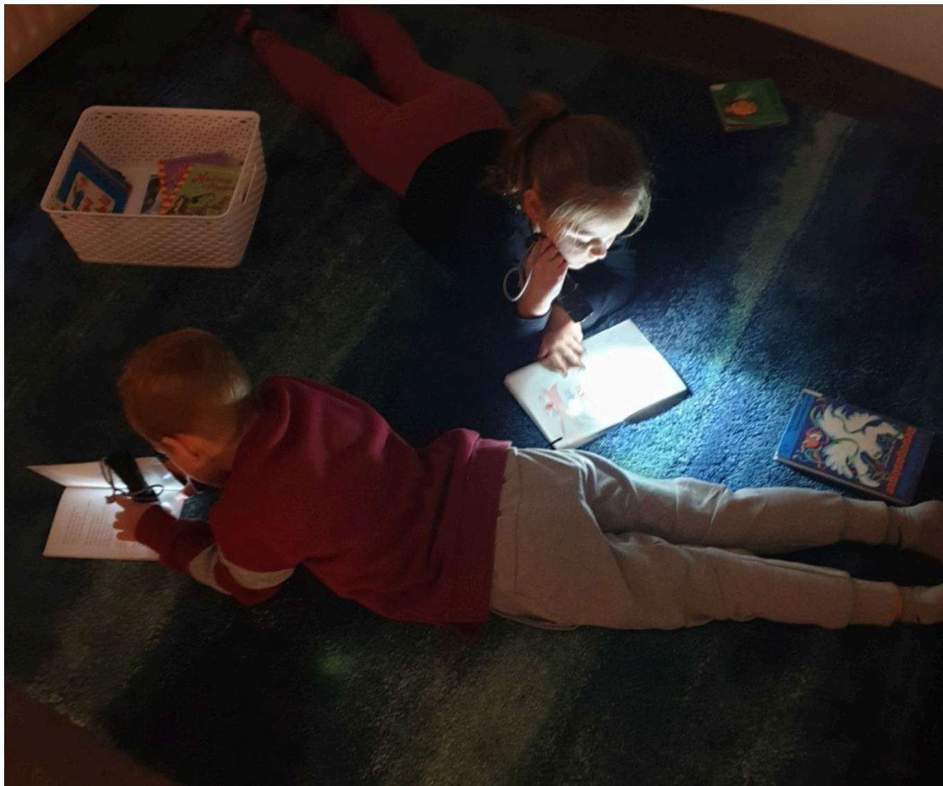
LESID VIÐ VASALJÓS Í HÚSASKÓLA.