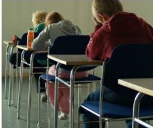
MYND 3.

matssviði Menntamálastofnunar, gagnleg samtöl við ritun greinarinnar.