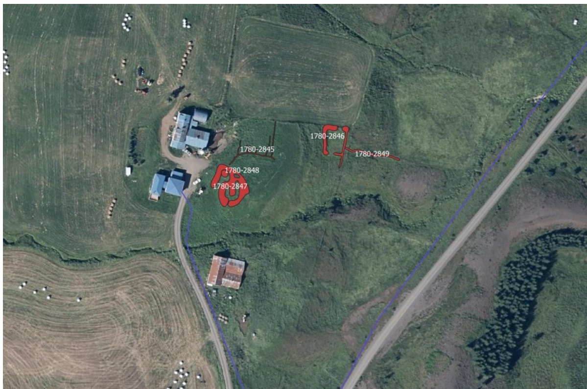
Mynd 4. Friðaðar- og friðlýstar fornleifar að Vaði. Línulögn ljósleiðara er merkt inn með blárrí línu.

Fyrst er getið um jörðina Vað í máldaga Vallaneskirkju frá því um 1270 (DI II, 83). Jörðin var Skriðuklausturseign, þar er talið hafa verið bænhús en staðsetning þess óviss (minjanr. SM-069:002 í fyrri fornleifaskrá). 5 Heimildir eru um Vaðshjáleigu sem var rétt innan við bæjarlækinn, til móts við íbúðarhúsið. Þar var tvíbýli fyrir aldamótin 1900. Um 1882 stóðu enn bæjartættarnar á hjáleigunni. Síðasti torfbærinn (tvö baðstofuhús samsíða, portbyggð) að Vaði var byggður 1887 og nýttur til 1939, þegar steipt einbýlishús var reist. Heimildir eru einnig um túngarðsleifar og part áveitugarðs á engjum og beðasléttum í gamla túni og 10 gripahús (Jónshús (þar eru nú fjarhús), Hjáleiguhús, Hesthús, Efstahús, Smiðja, Hesthús, Hólshús, Efsta, Mið- og Neðstahús) í túnjöðrunum sem sjást ekki lengur á yfirborði. 6