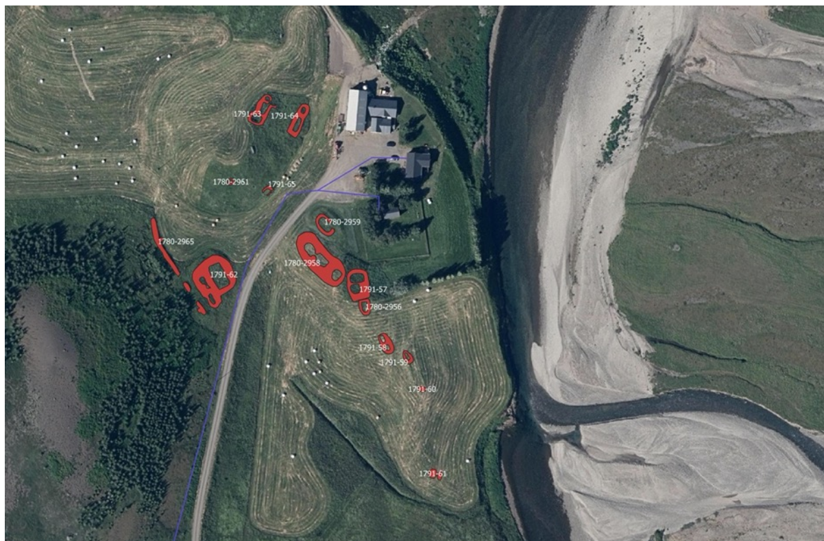
Mynd 8. Friðaðar- og friðlýstar fornleifar að Þingmúla. Áætluð línulögn ljósleiðara merkt inn með bláu.

Í 22. gr. laga nr. 80/2012 segir að friðlýstar fornleifar hafi um 100 m friðhelgað svæði. Óskað er eftir leyfi til að fara nær friðlýstu fornleifunum 1791-60 (dæld), 1791-61 (dæld), 1780-2954/1791-59 (búð/þúst), 1780-2955/1791-58 (búð/dæld), 1780-2956/1791-129 lambhús/tóft), 1780-2957/1791-57 (lambhús/útihús), 1780-2958/1791-55 (tóft/búð), 1780-2959/1791-54 (tóft/búð), 1780-2960 (garðlag), 1780-2961 (tóft), 1780-2962 (tóft), 1780-2963/1780-2963 (Goðatættur/óþekkt), en sem nemur 100 m friðhelgunarsvæðis. Þær minjar sem eru næst línunni, friðlýstar minjar nr. 1780-2963 og friðaðar minjar nr. 1780-2965, eru innan lagnarleiðarinnar. Þegar hefur verið lögð lína frá Milu í heimreið að Þingmúla. Lagt til að þeirri leið verði fylgt í stað þess að leggja aðra línu með tilheyrandi raski. Til að tryggja varðveislu minjanna er lagt til að friðlýstu minjarnar verði merktar á meðan á framkvæmdum stendur og að minjavörður/fornleifafræðingur hafi eftirlit með framkvæmdum, sjá mynd 8.