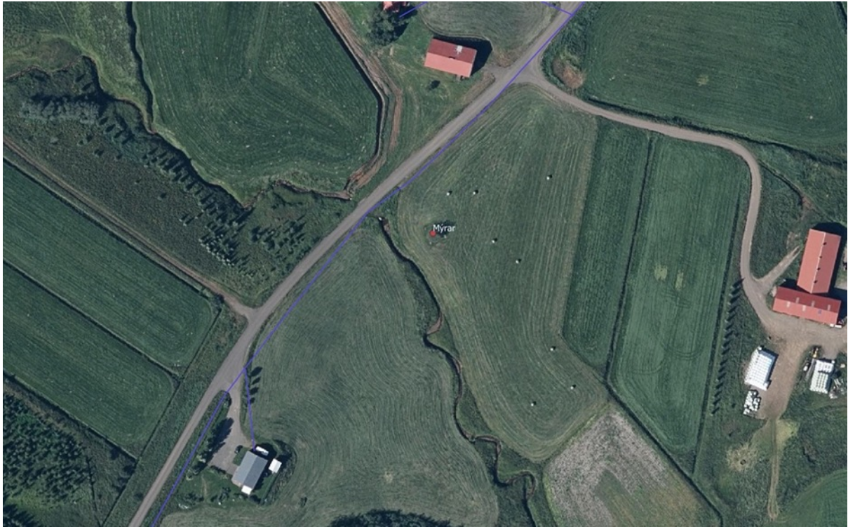
Mynd 6. Rauði punkturinn á myndinni sýnir staðsetningu heimagrafreitsins m.v. línulögn ljósleiðara (blá lína).

árum 20. aldar. Við ytri bakka nafnlaus lækjar sem er um 300 m sunnan við Bæjarlækinn, um 40-50 m ofan vegar, voru fornar tættur sem enginn veit nafn eða deili á en talið er sel. Þar mátti árið 1996 greina þrjú hólf, sambyggð. Innsta hólfíð var 6x9 m og ytri hólfín voru sameiginlega 6x7 m. Sundpollur var gerður við Bæjarlækinn á fyrstu áratugum 20. aldar og var sundlaugin innan við fjósið sem nú er. Um 300 m fram og niður af bæ var myllutóft við lítinn foss í Bæjarlæk sem heitir Myllufoss, þar var tóft sem var 3,5 x 5 m að utanmáli. Zophonías mundi eftir því að korn hefði verið malað í myllunni, hann taldi að hætt hefði verið að nota hana um 1910. Þá var mylluhúsið hrörlegt en stóð þó einhver ár á eftir. Tvíhólfa stekkur var fyrir neðan Bæjarlækjargilið, á grasi gróinni grund innan við lækinn, innra og efra hólfíð var 4x8 m að utanmáli og líkist fjárhústóft, hitt er sporöskjulaga 5x9 m að innanmáli. Gamall sveitavegur lá milli Mýra og Lynghóls, neðan undir Lönguhlíð og Græubrekku, víðast um