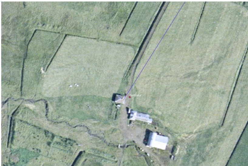
Mynd 7. Staðsetning punkts að Geitdal, 2362-2, þar sem lagt er til eftirlit með linulögn.

Í Sturlungu segir að 18 manns hafi farist í Skriðu að Geitdal árið 1185. Þegar grafið var fyrir súrheysgryfju á bænum kom fram brunnið harsl mannabeina, spýtur og sóststeinar á um tveggja metra dýpi. Einnig eru heimildir um húsatættur á mólendi norðan bæjar og undir fjárhúsum er hellulagður fjósgrunnur. Gamlar sagnir eru um fjós sem lind var veitt í gegnum, þegar grafið var fyrir fjárhúsunum fannst vatnsrennan og var hún rakin til lindarinnar. Um 1930 stóð í Geitdal íbúðarhús með timbri á tvo vegu 7x8 m og torf-grjótveggur á tvo, portbyggt. Norðan við var sambyggt fjós og hesthús með jarnstafni. Húsið skemmdist í snjóflóði 1952, mannbjörg varð. Steinhús var síðan byggt 1953. 23