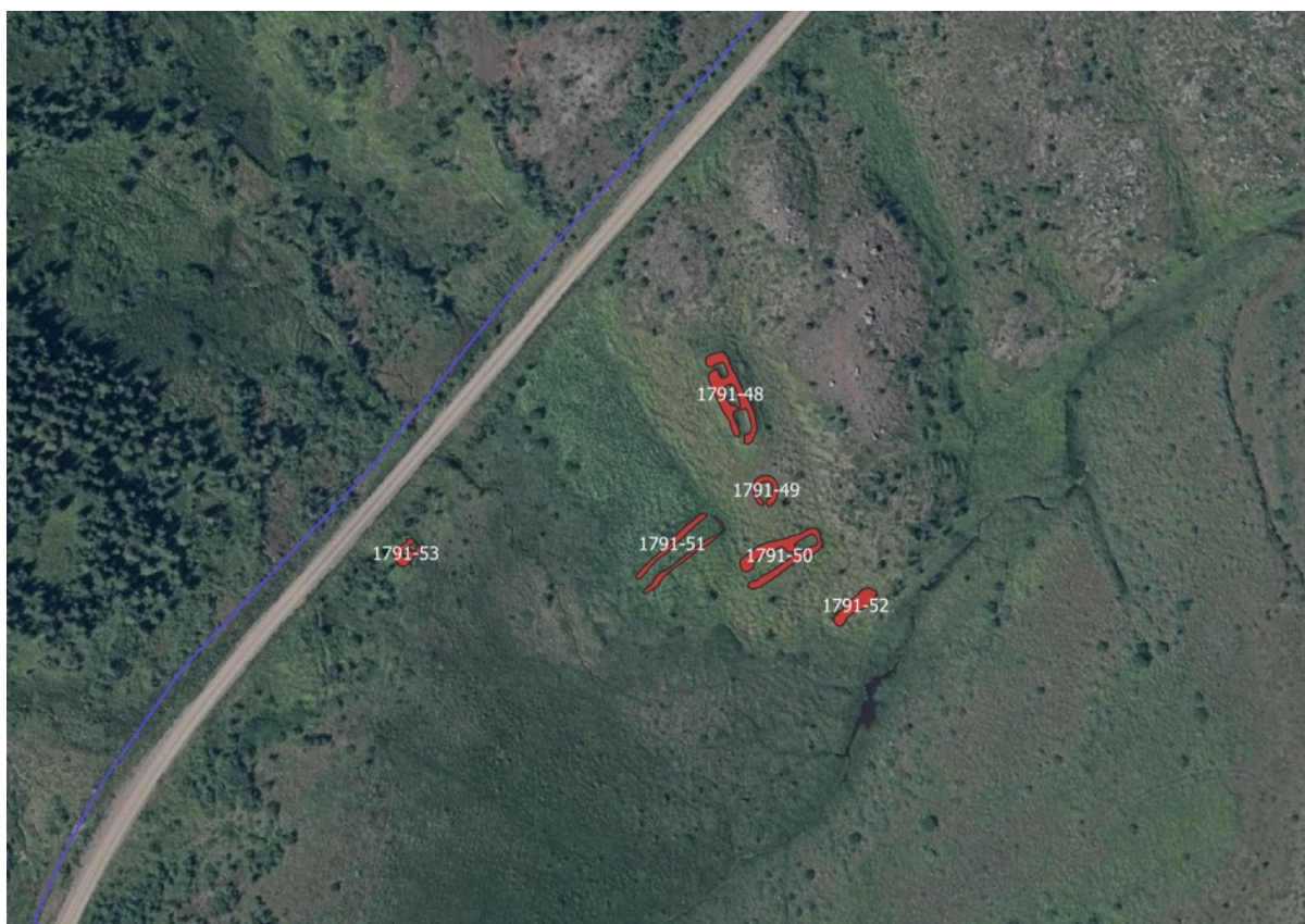
Mynd 9. Fornleifar skráðar undir minjanr. 1791 að Múlastekk, á milli Múlastekks og Birkihlíðar.

Plægingarleið ljósleiðara var færð vestan við veg til að vernda fornleifar nr. 1791-53 og aðrar fornleifar í nágrenninu sem eru skráðar undir minjanr. 1791 (Múlastekk).