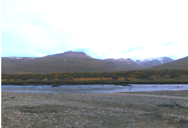
Mynd 3. Vaðið að Sauðhaga nr. SM-043-19.

Plægingarleið ljósleiðara fer nálægt fornleifum sem skráðar voru SM-043:019 í fornleifaskráningu Orra Vésteinssonar frá 2006. Í fornleifaskráningunni segir: „„Annað vað er niður af bæ“,“ segir í örnefnalýsingu. Vaðið er til móts við læk sem rennur á dálitlu gili niður í Grímsá að austan en þar er líka slóði niður að ánni. Á þessum stað er áin um 100 m breið og rennur grunnt. Klappir og malareyrar standa víðar upp úr og er gróinn klapparhólmi í farveginum austanmegin. Um 3 m hár bakki er að vestan en stallur er í hinum neðst.“