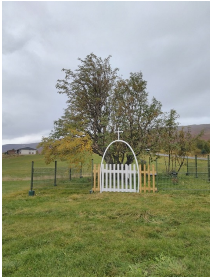
Mynd 5. Heimagrafreitur að Mýrum.

árum 20. aldar. Við ytri bakka nafnlaus lækjar sem er um 300 m sunnan við Bæjarlækinn, um 40-50 m ofan vegar, voru fornar tættur sem enginn veit nafn eða deili á en talið er sel. Þar mátti árið 1996 greina þrjú hólf, sambyggð. Innsta hólfíð var 6x9 m og ytri hólfín voru sameiginlega 6x7 m. Sundpollur var gerður við Bæjarlækinn á fyrstu áratugum 20. aldar og var sundlaugin innan við fjósið sem nú er. Um 300 m fram og niður af bæ var myllutóft við lítinn foss í Bæjarlæk sem heitir Myllufoss, þar var tóft sem var 3,5 x 5 m að utanmáli. Zophonías mundi eftir því að korn hefði verið malað í myllunni, hann taldi að hætt hefði verið að nota hana um 1910. Þá var mylluhúsið hrörlegt en stóð þó einhver ár á eftir. Tvíhólfa stekkur var fyrir neðan Bæjarlækjargilið, á grasi gróinni grund innan við lækinn, innra og efra hólfíð var 4x8 m að utanmáli og líkist fjárhústóft, hitt er sporöskjulaga 5x9 m að innanmáli. Gamall sveitavegur lá milli Mýra og Lynghóls, neðan undir Lönguhlíð og Græubrekku, víðast um