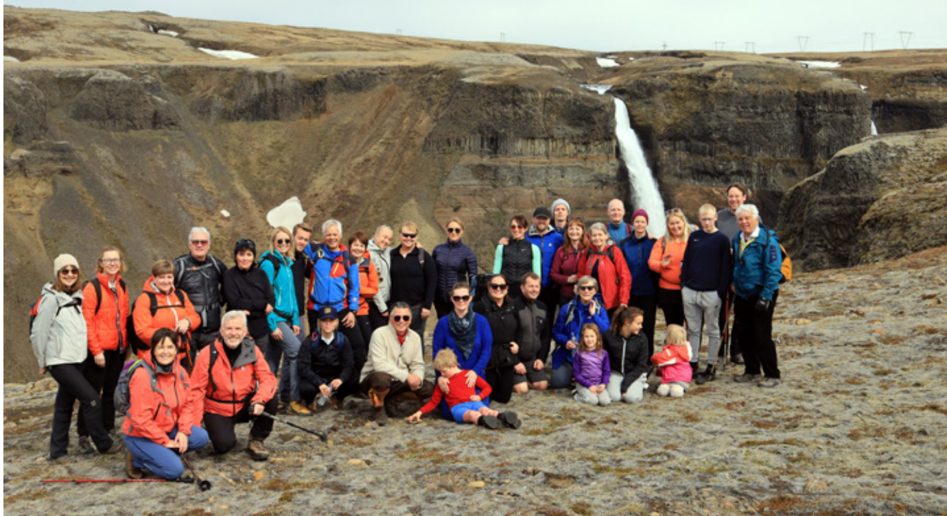
Alls 36 tóku þátt í göngunni, sá elsti 79 ára og yngsti 4 ára. Á myndina vantar Helga Jóhannesson en hann tók flestar myndirnar.