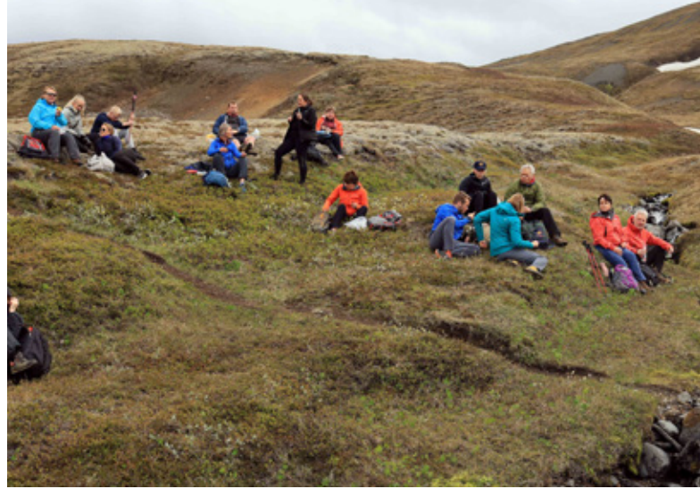
Nestispásur eru skemmtilegastar í gönguferðum, um það eru flestir sammála. Hér situr hluti hópsins á mjúku undirlagi mosa og lyngs.