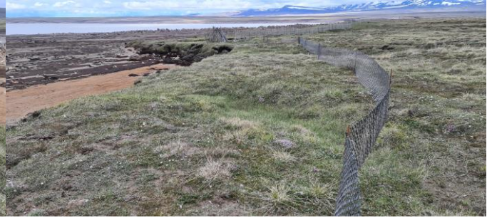
Mynd 5: Sama girðing. Horft til Snæfells.