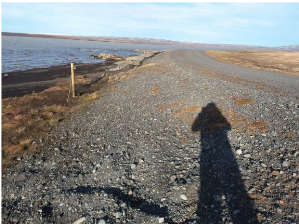
Mynd 8: Við Kofaöldu. Girt milli vegar og lóns. Sandur hefur safnast austan við veg undanfarin tvö ár.