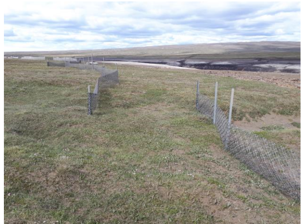
Mynd 7: Hluti girðinga inn með Kringilsá er endurnýjaður.