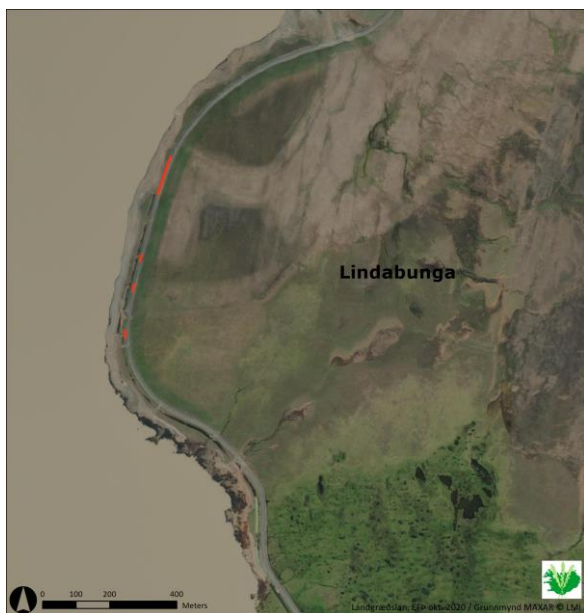
Mynd 2: Lindabunga. Staðsetning fógirðinga sem reistar voru á austurbakka Háslóns 2020.

Á austurbakka Háslóns voru settar upp girðingar á nokkra kafla vestan við vegstæði þar sem áfok hafði mælst hvað mest austur yfir veg (sjá skýrslur Úttekt og mælingar á áfoki við strönd Háslóns Áfangaskýrsla 2019 og 2018). Hluti þeirra var settur upp um mánaðarmótin júní-júlí og verkinu lokið um miðjan ágúst. Girðingar voru settar á 8 staði, samtals um 550m langar.