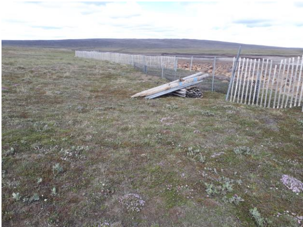
Mynd 6: Endurnýjuð girðing og efnislager.