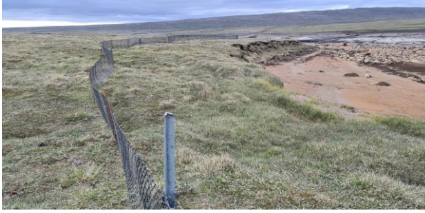
Mynd 4: Eldri girðing endurnýjuð í plasti og færð ofar.