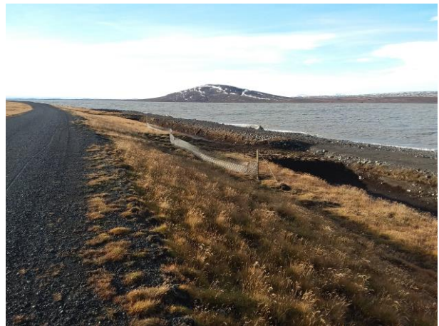
Mynd 9: Á Lindabungu. Girt á milli sandgilda. Ljósm. RIH.