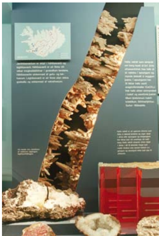
Mynd: Frá sýningu Náttúrugripasafns Ísl. © Náttúrufræðistofnun Íslands.

Eftir þann tíma tekur forstöðumaður Náttúruminjasafns Íslands sæti í safnaráði samkvæmt lögum þessum.“ Náttúrugripasafn Íslands, sem Náttúrufræðistofnun Íslands hefur umsjón með, er grunnur Náttúruminjasafns Íslands. Frá upphafi hafa verið settar á fót hátt í 20 nefndir sem fjallað hafa um málefni safnsins en hægt hefur þó miðað í málefnum þess. Safnið hefur aðsetur í þröngu sýningarrými í óhentugu húsnæði m.t.t. safnastarfs, við Hlekk 3-5, þar sem Náttúrufræðistofnun Íslands er staðsett. Aðgengi að sýningum er erfitt og lítið fjármagn hefur fengist til starfseminnar sem kemur m.a. illa niður á forvörslu safngripa. Auknar fjárveitingar til safnsins eru aðkallandi, svo og flutningur þess í hentugt húsnæði. Þá er aðkallandi að sett verði sérlög um Náttúruminjasafn Íslands eins og safnalög kveða á um.