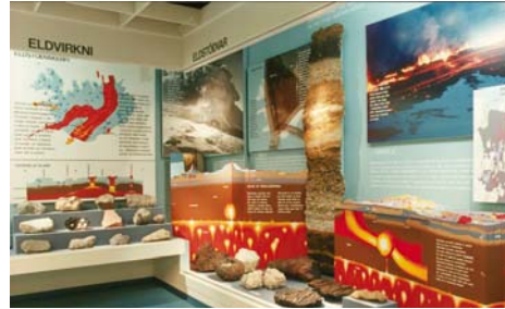
Mynd: Frá sýningu Náttúrugripasafns Ísl.

Þegar safnalög voru sett árið 2001 voru sett ákvæði til bráðabirgða í lögnum hvað varðar Náttúrugripasafn Íslands. Í bráðabirgðaákvæði segir: „Ákvæði 5. mgr. 5. gr. sem kveður á um að Náttúruminjasafn Íslands hafi stöðu höfuðsafns kemur ekki til framkvæmda fyrr en sett hafa verið sérlög um Náttúruminjasafn Íslands í samræmi við lög þessi. Náttúruminjasöfn eiga eftir sem áður rétt á styrkjum úr safnasjóði á grundvelli 10. gr. með sama hætti og önnur minjasöfn. [...] Þar til Náttúruminjasafn Íslands hefur verið sett á stofn, sbr. 5. mgr. 5. gr., skal forstjóri Náttúrufræðistofnunar Íslands eiga sæti í safnaráði og tilnefna varamann í sinn stað.