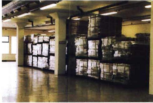
Mynd 2. Kjarnageymsla á Akureyri

Allur kjarninn var skráður niður áður en hann fór norður en eftir á að merkja hann í samræmi við hugmyndir um aðgengi í Oracle gagnagrunni OS.