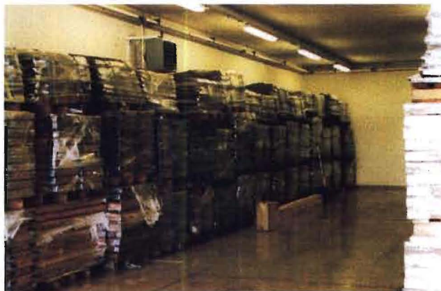
Mynd 1. Kjarnageymsla á Akureyri

Kjarnasafnið var flutt í leiguhúsnæði á Akureyri, sem er í eigu Sjafnar. Flutningur hófst í apríl, þegar leigusamningur var frágenginn milli eiganda og Náttúrufræðistofnunar, en ROS gerði síðan samkomulag við Náttúrufræðistofnun um samvinnu um notkun húsnæðisins. Flutningi lauk seinni hluta sama mánuðar. Hér á eftir eru tvær myndir frá núverandi kjarnageymslu.