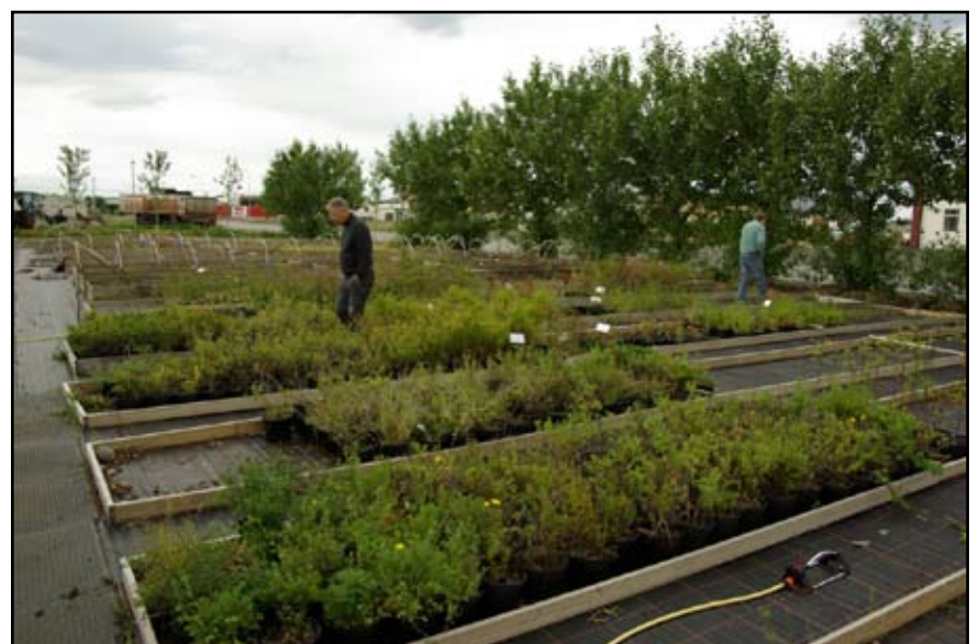
Mörg skógræktarfélög voru snögg að nýta sér þetta tækifæri og fækkaði plöntum ört eftir því sem leið á sumarið (Mynd: BJ).

Á vordögum bárust fréttir af því að verið væri að selja plöntur úr gjaldþrota gróðrarstöð á Akranesi. Forsvarsmenn Skógræktarfélags Íslands, sem þá höfðu nokkru áður innsiglað samning við Innanríkisráðuneytið um framhald atvinnuáttaks, sáu sér leik á borði að eignast þessar plöntur í því skyni að nota þær í verkefnum sumarsins. Í framhaldi var haft samband við dótturfélag Arion banka, Landsel, sem fór með eign hins gjaldþrota fyrirtækis og náðust mjög hagstæðir samningar um kaup á öllum þeim plöntum sem voru í gróðrarstöðinni en það voru um 50 þúsund garðplöntur af ýmsum gerðum. Skógræktarfélagi Akraness var falin varsla og umhirða á plöntunum. Öllum aðildarfélögum Skógræktarfélags Íslands var gefinn kostur á því að fá plöntur, að því gefnu að þær færu í svæði félaganna, en fyrst og fremst hefur þessi viðbót nýst atvinnuáttaksverkefnum félaganna. Þegar þessi klausa er fest á blað í lok ágúst mánaðar er lunginn af trjáplöntunum kominn í jörð í fjölmörg svæði félaganna um land allt. Segja má að fjölbreytni og litskrúð hafi aukist til muna þegar tugir nýrra trjátegunda og runna hafa bæst við útivistarskóga skógræktarfélaganna.