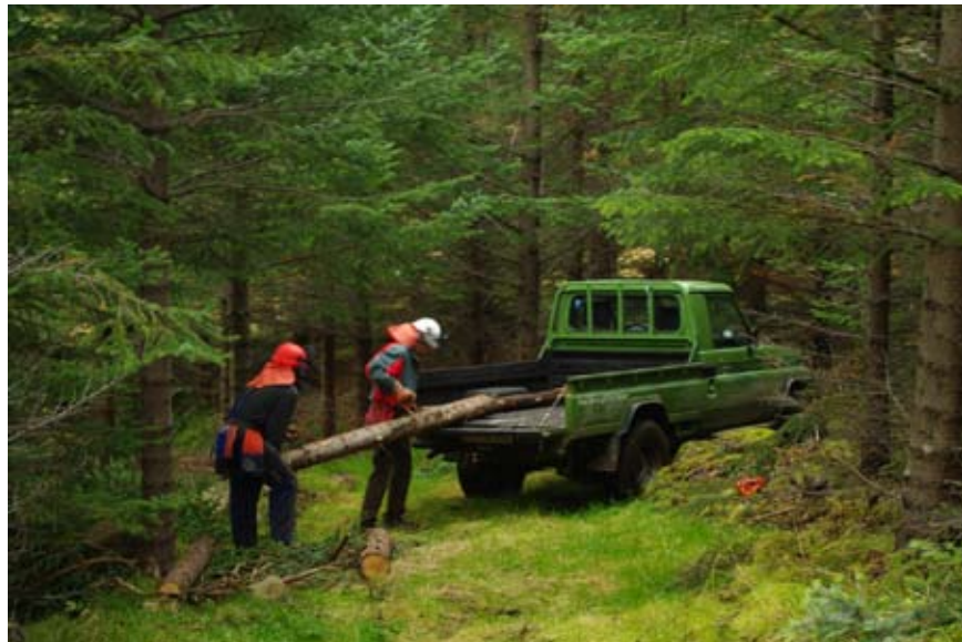
Krúsi að störfum á Fossá í Hvalfirði.

kynnu að meta tilprifin og nú bíða menn spenntir eftir að sjá hvernig sá græni tekur sig út á hvíta tjaldinu.