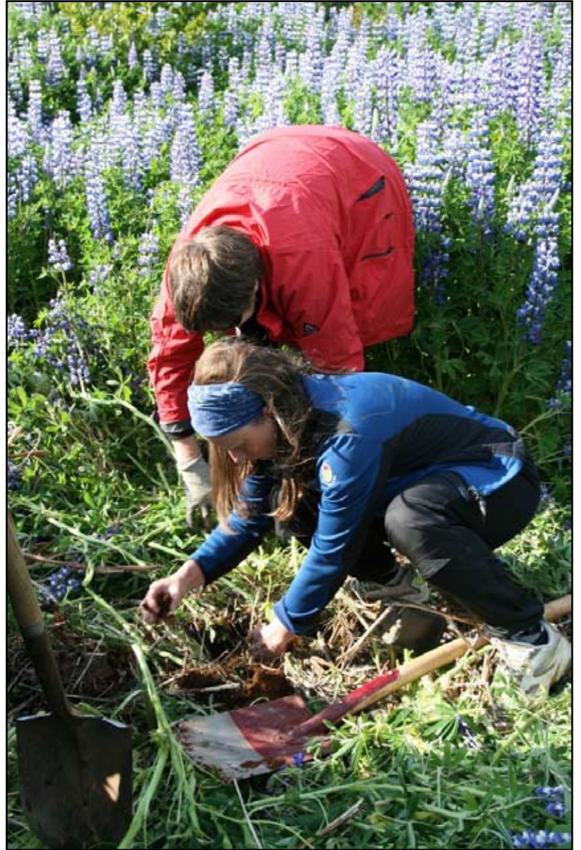
Til hægri. Hjálpast að við að setja niður plöntur.