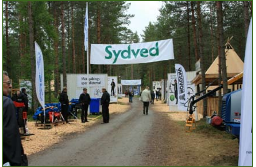
SkogsElmia er sett upp úti í skógi og var hægt að ná ágætis göngutúr með því að ganga um skóginn og líta á alla básana.

European Forest Network (EFN) eru óformleg samtök skógræktarféлага í Evrópu og er megin áhersla þeirra að skiptast á upplýsingum um skóga- og skógræktartengd málefni. Fulltrúi Skógræktarfélags Íslands sótti fund EFN í Svíþjóð 26.-28. maí. Auk íslenska fulltrúans mættu fulltrúar frá Svíþjóð, Þýskalandi, Austurríki, Eistlandi, Finnlandi og Skotlandi. Voru allir fulltrúar með kynningu á stöðu skógarmála í sínu heimalandi og spunnust heilmiklar umræður út frá því, en eins og gefur að skilja er töluverður munur á aðstæðum og áherslum skógræktar þessara landa. Einnig var farið í heimsókn til skógarbónda, sem auk skógræktar er með venjulegan búskap, veiði og vindmyllur! Kungliga Djurgården almenningagarðurinn í Stokkhólmi var einnig heimsóttur, en hann er gott dæmi um svokallaða borgarskógrækt. Auk þess fóru þátttakendur á SkogsElmia kaupstefnuna, sem er ein af fimm stærstu skógartengdu kaupstefnum í heimi. Til að gefa hugmynd um stærð hennar þá voru hátt í átta hundruð söluaðilar með bása á svæðinu.