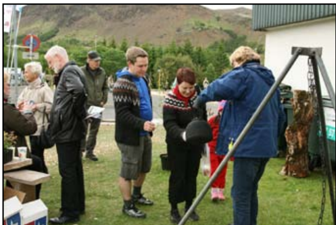
Gestir smakka á ilmandi og bragðgóðu ketilkaffi.