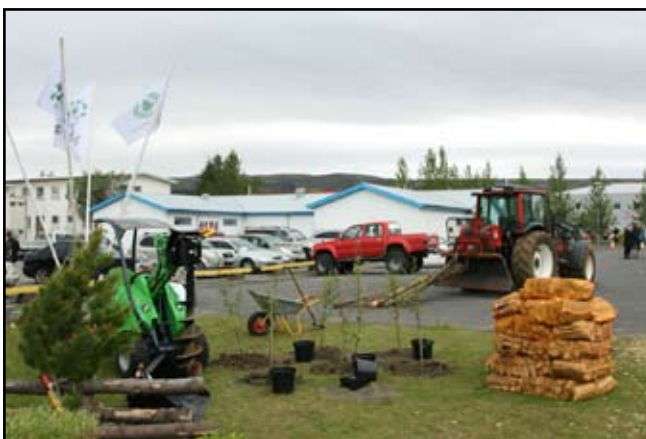
Á svæði Skógræktarfélagsins mátti sjá ýmis tól og tæki tengd skógrækt, plöntur og skógarafurðir, svo sem eldivið og kurl.