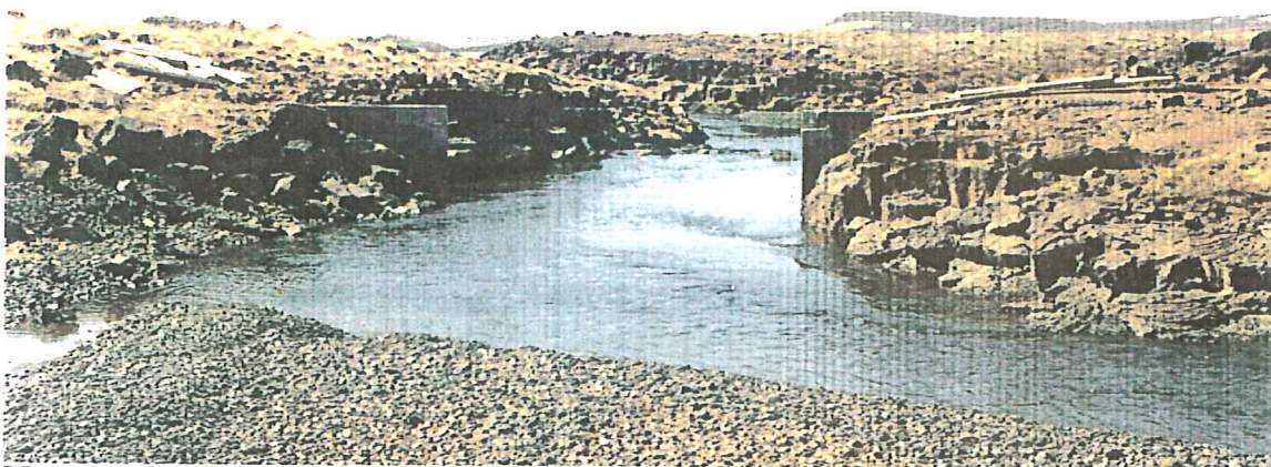
Mynd 3: Stíflumannvirki, farvegurinn hefur verið sprengdur í gegnum bergið (mynd AVB, maí 1999)