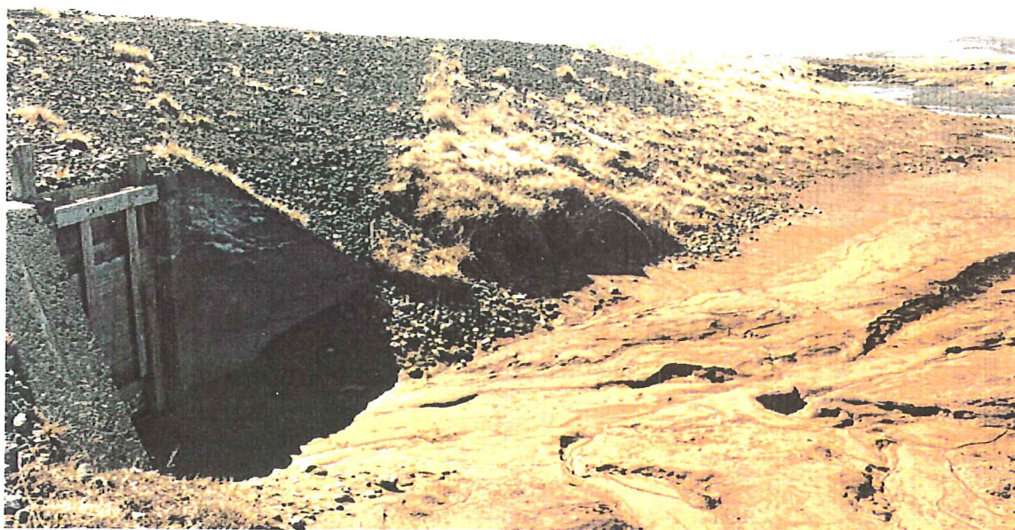
Mynd 2: Varnargarðurur með ræsi, lækurinn í bakgrunni rennur í vesturátt (mynd AVB, maí 1999)

á einum þeirra (mynd 2). Um 20 metrum neðar blasti við lítið stíflumannvirki (mynd 3) sem greinilega var í einhverri notkun því nýlegt timbur var á víð og dreif á staðnum. Neðan við stífluna er greinilega búið að sprengja farveg í gegnum hraunið. Var nú þessi könnunarganga fyrst að verða spennandi enda ekki auðséð í svipan hvert þetta vatn rynni. Síðar kom í ljós að lækurinn steypist ofan í sprungu eina djúpa (mynd 4) og þaðan eftir henni í áttina að Öxará og Almannagjá. Með öðrum orðum: vatni úr Grímagili, Svartagili og Hrutagili er veitt með görðum og rásum ofan í þessa annars ágætu gjá en handan ræsisins blasir við þurr farvegur Leirulækjar sem annars rennur framhjá þjóðveginum og steypist fram af gjábrún Hvannagjár.