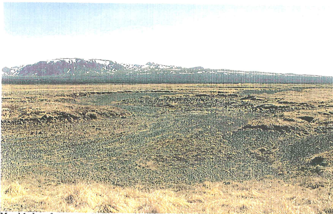
Mynd 1: Þurr farvegur norðan þjóðvegarins til Þingvalla. Hrafnabjörg í baksýn (mynd AVB, maí 1999)

Ef keyrt er þjóðveginn milli brúarinnar yfir Öxará og hliðsins inn í þjóðgarðinn þar sem vegurinn liggur niður á vellina, má sjá þurra farvegi norðvestan við veginn (mynd 1). Sætti þetta nokkurri undran enda kom í ljós að vatn er í farveginum ofan til hjá skeiðvellinum skammt frá Bolabás en hvert það vatn rann var á huldu enn sem komið var. Það er í sjálfum sér ekki í frásögur færandi að farvegir séu þurrir en að það renni einungis í hluta farvegar ofan til sem er síðan þurrausinn stuttu neðar var undarlegt. Var því gengið eftir blautu farveginum hjá skeiðvellinum og í áttina að þjóðveginum því eitthvert hlaut vatnið að renna enda ekki algengt svo vitað sé, að vatnsföll gufi hreinlega upp á nokkrum hundruðum metra kafla.