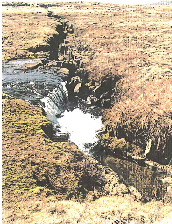
Mynd 4: Lækurinn steypist ofan í gjá