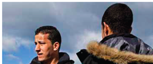
Biðtími hælisleitenda lengist í tvö ár án aukinna framlaga

bejar. Enginn skriflegur samningur hefur verið gerður um rekstur vistheimilis fyrir flóttamenn en Útlendingastofnun hefur falið Reykjanesbæ að veita þessa þjónustu. Reykjanesbær er í samstarfi við tvö gistihelmi í Reykjanesbæ um þjónustu við hælisleitendur, gistihelmið Fit í Njarðvík og gistihelmið við Hótel Keflavík, samkvæmt upplýsingum frá félagsþjónustunni í Reykjanesbæ. Álls eru 73 hælisleitendur á framfæri Reykjanesbæjar. Af þeim eru 40-50 skráðir í gistingu á Fit. Af þeim eru 10-15 að jafnaði fjarverandi án vitneskju yfirvalda en ekkert eftirlit er með því hverjir dveljast á gistihelminu. Hælisleitendur geta sótt um tímabundið atvinnu- og dvalarleyfi ef þeir finna vinnu en missa þá félagsleg réttindi hælisleitenda sem felast í húsnæði, mat, almennri lækniþjónustu, afþreyingu og vaspeningum. Samkvæmt upplýsingum frá félagsþjónustunni í Reykjanesbæ fá hælisleitendur jafnframt afhent símkort, hreinlætisúbur og Bónuskort við komuna til landsins. Þeir sjá hins vegar sjálfir um innkaup og matseld. Eftir fjögurra vikna dvöl fá þeir 2500 krónur í vaspeninga á viku. Auk þess er boðið upp á íslenskukennslu og fá