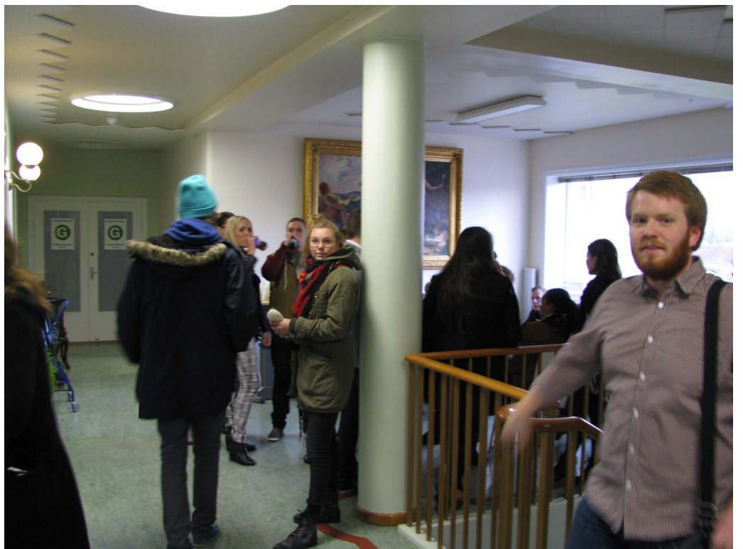
Unga fólkíð fyllti sali VG þegar leið á daginn