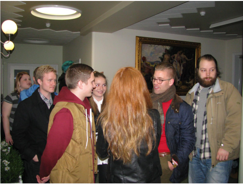
Fríður hópur ungs fólks úr Hí

Vel heppnaður haustfagnaður Hægri grænna 19. okt.