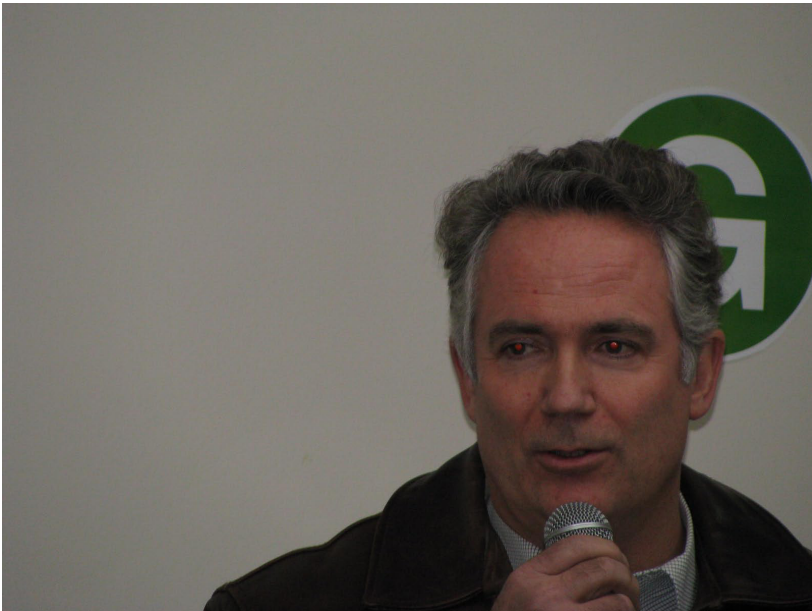
„Flugvöllinn í Reykjavík“ sagði þessi flugmaður.