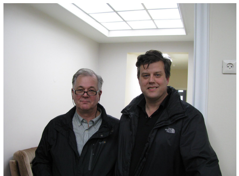
Þeir ræddu málin, traustir stuðningsmenn XG.